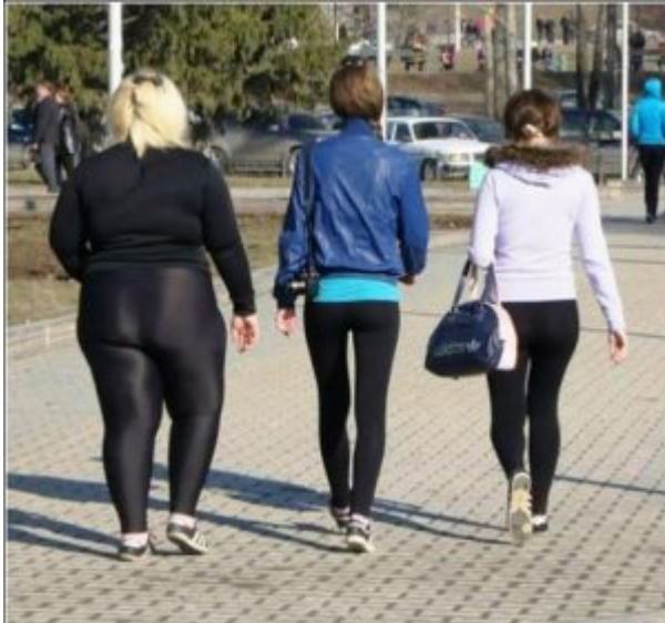
Nicht jede Polin ist für Leggings geschaffen.

Vor allem die Provinz kleidet sich auf den Basaren ein. Zu Tausenden wiegen sich dort an der frischen Luft Nachahmungen von Modellen aus den großstädtischen Bekleidungsketten: billige Stoffe, oft lieblos zugeschnitten und nicht gerade sorgfältig verarbeitet, aber preiswert.