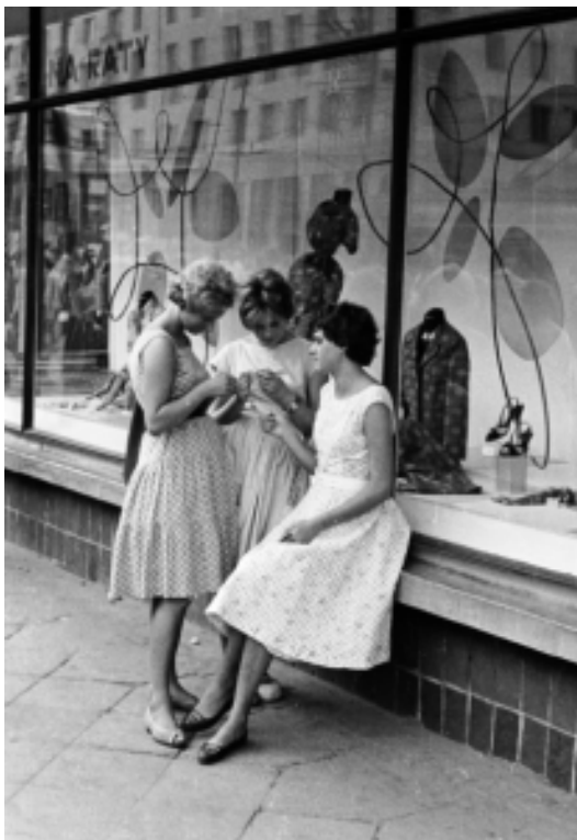
Modische Polinnen in Warschau Anfang der Sechziger...

Die Polinnen haben übrigens während der Zeit des Kommunismus trotz aller Widrigkeiten ihr Modebewusstsein sehr eindrucksvoll unter Beweis gestellt. Es wurde genäht, gestrickt, gehäkelt, umgeändert und gefärbt was das Zeug hielt. Gab es keine Schnittmuster, mussten Fotos aus westlichen Illustrierten und Modejournalen reichen, die ihren Weg hinter den eisernen Vorhang gefunden hatten. Es gab im kommunistischen Polen häufig Anlass sich nach schicken Mädchen umzudrehen. Besucher aus dem