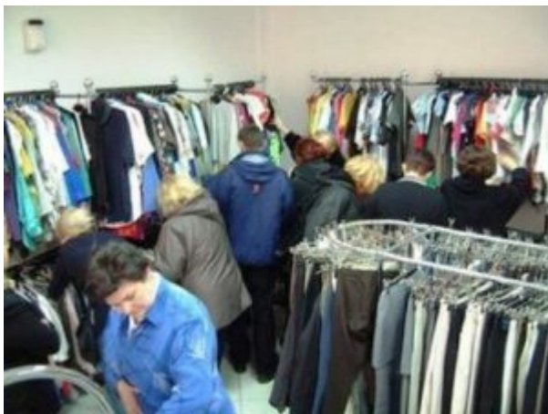
...und im Laden.

Die „lumpeksy“ buhlen um Kundschaft, indem sie sich spezialisieren: auf „heiße Klamotten direkt aus Amerika“, „gute deutsche Ware“ oder „echten französischen Chic“. Alles angeliefert in Großcontainern von irgendwoher auf Welt.