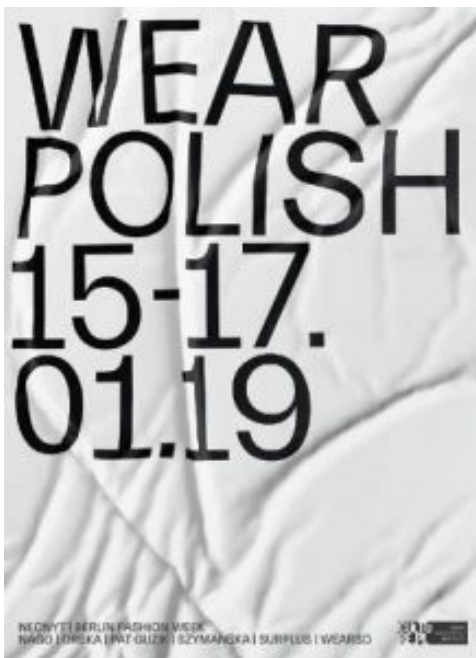
Plakat des polnischen Auftritts auf der Berliner Fashion Week 2019.

Auch die Farbvorlieben sind inzwischen gut erforscht. Die meisten Polen mögen's nicht so schrill. Bevorzugt werden Sachen in Schwarz, Dunkelblau, Anthrazit, Indigoblau, Violett, Karminrot. Bei Frauen kommt noch Braun in verschiedenen Schattierungen hinzu. Man traut sich eben nicht aufzufallen, so sehen es jedenfalls die polnischen Modedachleute.