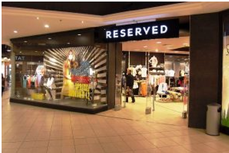
Reserved-Filiale in Gdańsk.

Der uniformlastige Kommunismus ging unter, der Kapitalismus kam und mit ihm die neue Vereinheitlichung des Outfits. Weltumspannende Bekleidungsketten ziehen die Polen genauso an, wie gleichaltrige Tschechen, Ungarn, Belgier, Deutsche. Knapp siebzig Prozent der Polen geben an dort Stammkunden zu sein.