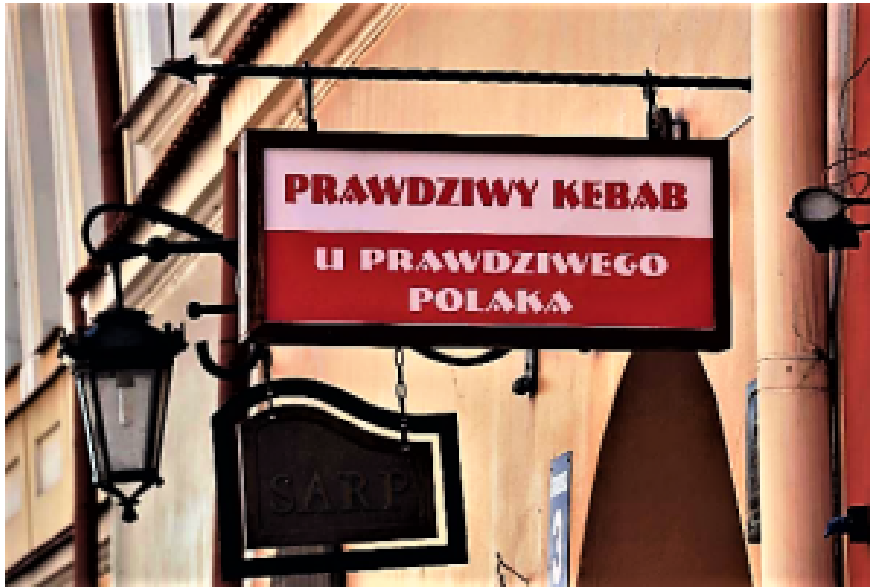
„Echter Kebab beim echten Polen“ in Lublin.

Pizza mit Wurst, dünnen Kartoffelscheiben und saurer Gurke, Pizza mit bigos belegt, Pizza mit Gehacktem, Zwiebeln und Speck sind mir noch gut in Erinnerung, nicht selten mit Dill, Kümmel oder Majoran bestreut. Sie schmeckten nicht schlecht aber vor allem sehr vertraut und darum geht es ja vor allem.