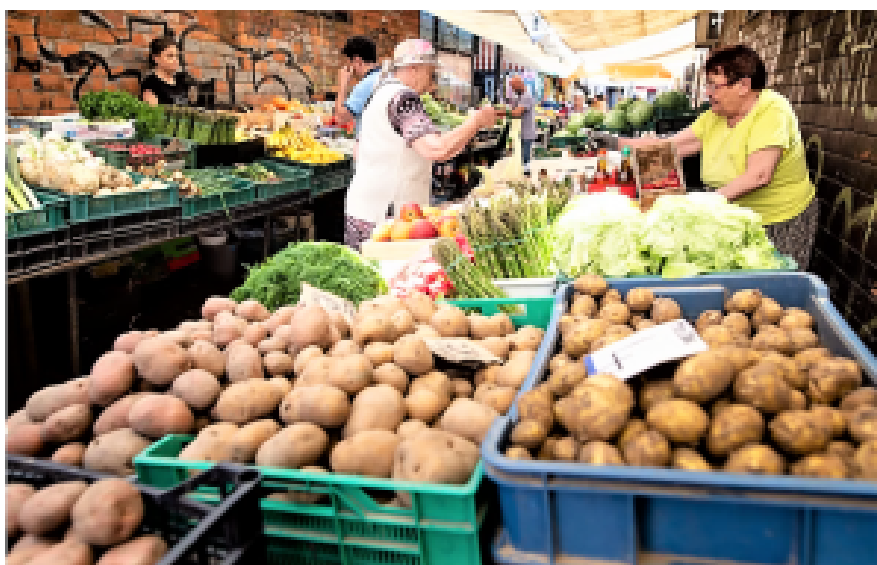
Kartoffeln, die mit Abstand beliebteste Beilage.

Unbedingt. Die Polen verschmähen zwar weder Reis noch Nudeln, aber Kartoffeln und Buchweizengrütze sind bis dato die beliebtesten Beilagen.