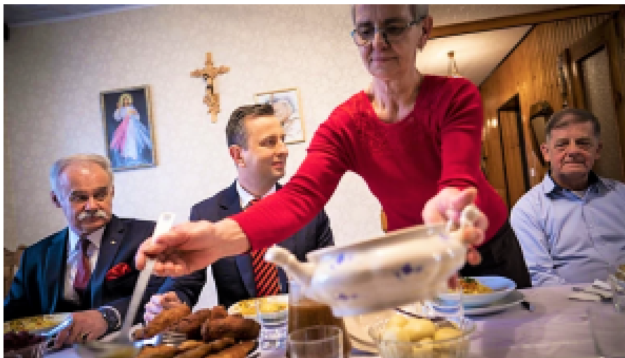
Suppe muss sein, auch im Wahlkampf. Bauernpartei-Chef Władysław Kosiniak-Kamysz (i. d. M.) beim Stimmenfang auf dem Land.

Die polnische Vorliebe für Suppen ist unverwundlich. Ein Pole, ob Kind, Erwachsener oder Greis, löffelt im Jahr (Angaben von 2020) bis zu 110 Liter Suppe aus. Das platziert ihn, neben den Asiaten, an der Weltspitze, so die Ernährungsstatistiker. Die vielen altbewährten, saisonal variierenden, Suppen werden immer noch ganz selbstverständlich, sowohl in den Haushalten als auch in Kantinen und Mensen sowie in der gehobenen Gastronomie, tagtäglich gereicht.