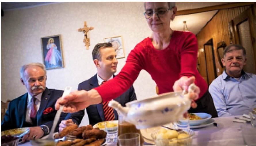
Suppe muss sein, auch im Wahlkampf. Bauernpartei-Chef Władysław Kosiniak-Kamysz (i. d. M.) beim Stimmenfang auf dem Land.

Die polnische Vorliebe für Suppen ist unverwundlich. Ein Pole, ob Kind, Erwachsener oder Greis, löffelt im Jahr (Angaben von 2020) bis zu 110 Liter Suppe aus. Das platziert ihn, neben den Asiaten, an der Weltspitze, so die Ernährungsstatistiker. Die vielen altbewährten, saisonal variierenden, Suppen werden immer noch ganz selbstverständlich, sowohl in den Haushalten als auch in Kantinen und Mensen sowie in der gehobenen Gastronomie, tagtäglich gereicht.