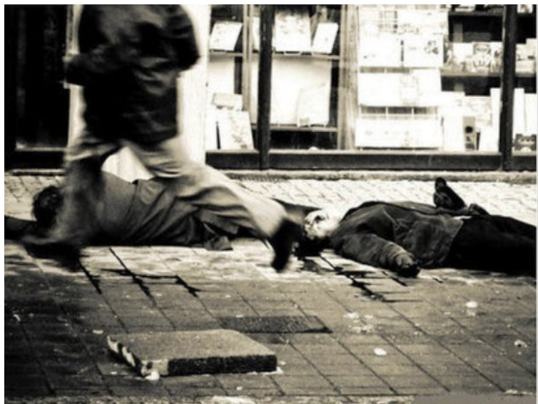
Gdańsk im Dezember 1970. Erschossene Demonstranten.

Am 16. Dezember sendete der lokale Fernsehsender am späten Nachmittag, mit einer Wiederholung am Abend, Kociołeks Rede an die Bevölkerung. Sie war nur in Gdańsk und Umgebung zu empfangen. Kociołek sprach von Aufruhr und Rowdytum, begründete damit das Vorgehen der Ordnungskräfte, denen er Dank für ihren Einsatz zollte, appellierte an die Vernunft, stellte fest (ohne die drastischen Preiserhöhungen beim Namen zu nennen), dass die Forderungen der Protestierenden nicht erfüllbar seien und schloss mit der Aufforderung an die Bevölkerung, die Arbeit wieder aufzunehmen.