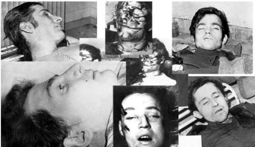
Gdańsk im Dezember 1970. Zivile Opfer der Proteste. Fotos aus den Akten der polnischen Stasi.