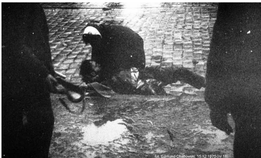
Gdańsk im Dezember 1970. Ein Toter wird geborgen.

Kociołek bat Gomułka nach Gdańsk gehen zu dürfen. Er, der noch vor kurzem dort Parteichef gewesen war, wisse wie man mit den Leuten vor Ort reden müsse, wie man mit politischen Mitteln Herr der Lage werden könne. Als er am Dienstag, dem 15. Dezember eintraf, dauerte der Sturm der Demonstranten auf das Parteihaus, das ebenso wie der Hauptbahnhof und einige weitere Gebäude gerade in Flammen aufging, bereits einige Zeit an. Die ersten sechs Toten waren bereits zu beklagen. Schwere Unruhen wurden auch aus Szczecin/ Stettin und Elbląg/ Elbing gemeldet.