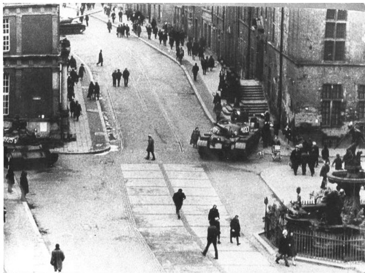
Gdańsk im Dezember 1970. Panzer auf dem Langen Markt und in der Langen Gasse. Rechts der Neptun-Brunnen.

Der junge Parteibonze, daran gewöhnt, dass ihm seine Untergebenen ehrfürchtig zuhören, dass ihm nie widersprochen wird, dass er immer das letzte Wort hat, überschätzte seine Überzeugungskraft, wenn es darauf ankam, sich rhetorisch gegen massiven Widerspruch durchzusetzen. Als es im Frühjahr 1968 zu Studentenprotesten- und Unruhen im ganzen Land kam, fuhr Kociołek, damals noch Danziger Parteichef, in die dortige Technische Hochschule. Hier setzte er zu einer flammenden Rede über den Ruhm des Sozialismus an, und wurde von den Studenten ausgepiffen und ausgelacht, musste wie ein begossener Pudel abziehen. Kurz darauf begann die Miliz den Protest brutal niederzuknüppeln. Eben diese Selbstüberschätzung, sollte ihm nun zum Verhängnis werden.