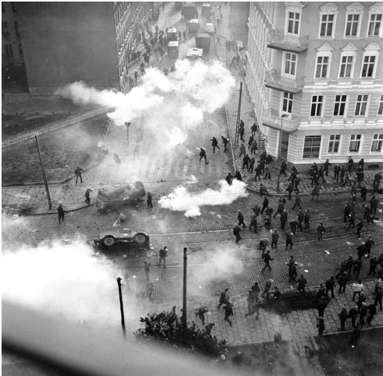
Gdańsk im Dezember 1970. Zusammenstöße zwischen der Miliz und Protestierenden.

durch eine radikale Kürzung der staatlichen Subventionierung der Lebensmittelpreise kurz vor Weihnachten wieder auffüllen.