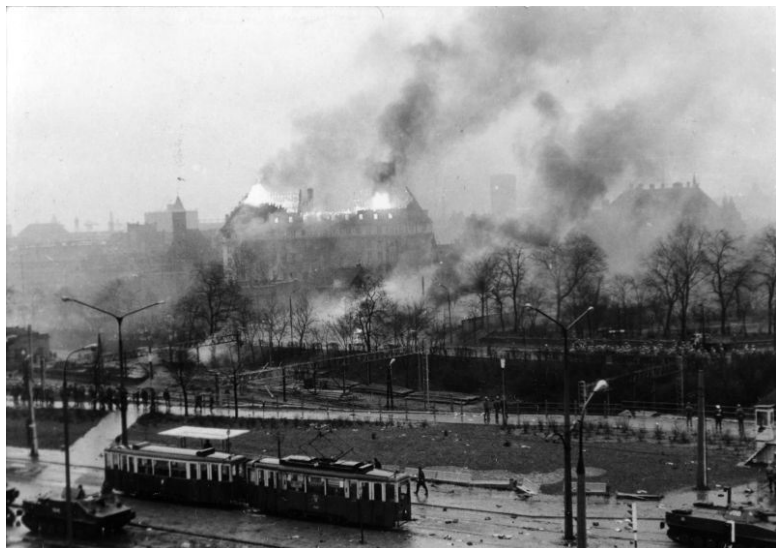
Gdańsk im Dezember 1970. Das Parteigebäude brennt.

Kociołek behauptete bis zu seinem Tod, zum Zeitpunkt seines Aufrufs von Kliszkos Anordnungen nichts gewusst zu haben. Als ihm das drohende Unheil später jedoch bewusst wurde, habe er mitten in der Nacht verfügt Boten zu den Arbeiterwohnheimen zu schicken, mit der Anweisung, am nächsten Morgen doch nicht zur Arbeit zu gehen. Beweise dafür wurden bis heute nicht gefunden.