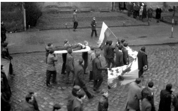
Gdańsk im Dezember 1970. Arbeiter tragen einen toten Kameraden durch die Stadt.

Am Montag, dem 14. Dezember 1970 kam es daraufhin in Gdansk und in dem nahegelegenen Gdynia zu ersten Arbeitsniederlegungen. Arbeiter zogen friedlich vor die Danziger Parteizentrale und forderten Verhandlungen, doch niemand wagte sich zu ihnen heraus. Am Nachmittag kam es dann zu ersten Straßenschlachten mit der Miliz. Die Lawine kam ins Rollen.