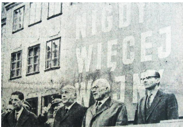
Stanisław Kociołek (rechts im Bild), damals Parteichef von Warschau, mit seinem Förderer, Parteichef Władysław Gomułka (2. v. r.) und Ministerpräsident Józef Cyrankiewicz (3. v. r.) bei einer Kundgebung in der Warschauer Altstadt am 1. September 1964, zum 25. Jahrestag des Kriegsausbruchs.