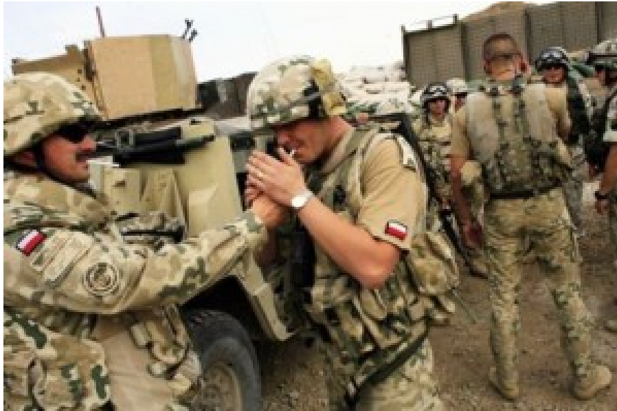
Polnische Truppen im Irak.

Eine Armee so groß und so stark wie die russische werden wir nie haben.