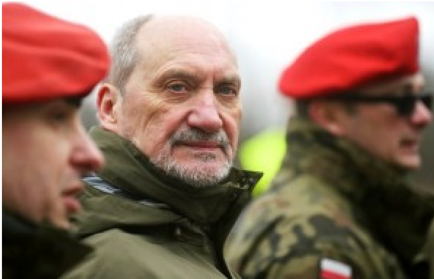
Verteidigungsminister Antoni Macierewicz.

Wir sind heute in einer sehr schwierigen Lage, sowohl was unsere geostategische Situation angeht, wie auch den Zustand der polnischen Streitkräfte. Auf den ersten Umstand haben wir kaum Einfluss, aber auf den zweiten sehr wohl. Allerdings lassen sich die Modernisierung und die Instandsetzung der Armee nicht in wenigen Monaten bewerkstelligen, nicht einmal in einer Legislaturperiode. Da kann man nur mit der Arbeit beginnen. Die Zerstörung, die Auflösung einer Armee hingegen, geht viel einfacher vonstatten. Es genügt das Gros der Soldaten zu entlassen, die Ausrüstung zu entsorgen und die Kasernen zu verkaufen.