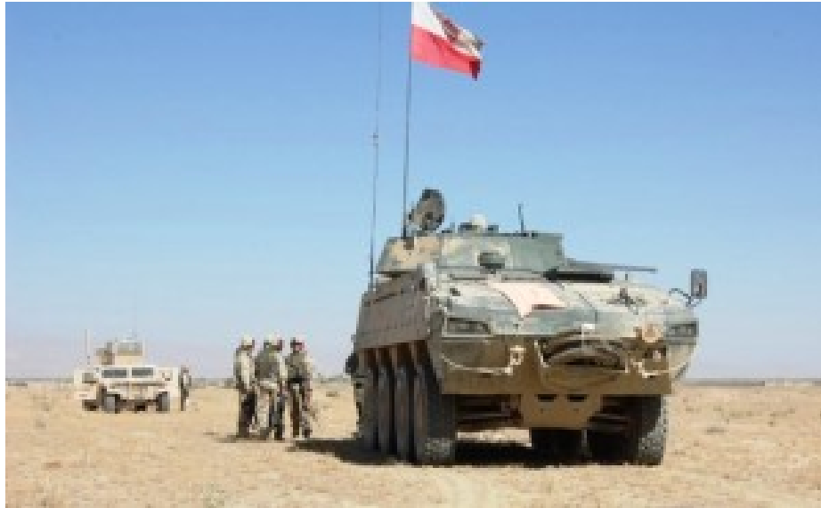
Polnische Truppen in Afghanistan.

So hat man das auch in Deutschland lange Zeit in Bezug auf die Bundeswehr gesehen. Mit heute beklagenswerten Folgen für die dortige Armee.