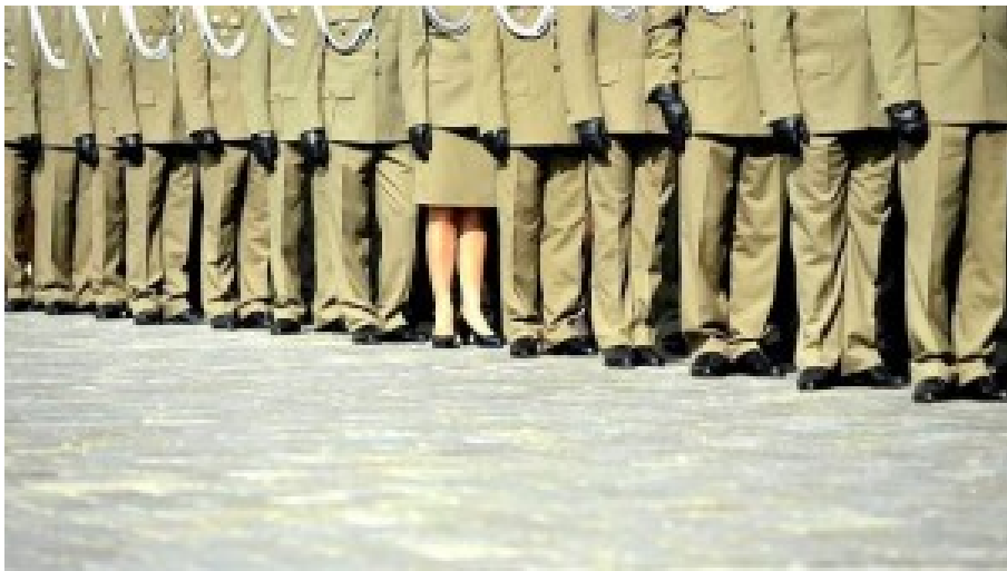
Die Armee wurde so lange verkleinert bis man mit allen Angehörigen der Landstreitkräfte nicht einmal das Warschauer Nationalstadion mit knapp 60.000 Plätzen füllen konnte.

Die Jahresetats für Modernisierung von Bewaffnung und Ausrüstung wurden regelmäßig nicht ausgeschöpft. Dann haben unsere Vorgänger in den letzten Jahren ihres Amtierens ein gewaltiges Modernisierungsprogramm für die Armee im Wert von 300 Milliarden Zloty (ca. 72 Mrd. Euro – Anm. RdP) aufgestellt. In Wirklichkeit standen ihnen jedoch nur 70 Milliarden Zloty zur Verfügung (ca. 17 Mrd. Euro – Anm. RdP). Es endete damit, dass die damalige Regierung begann von allem ein bisschen was zu beschaffen.