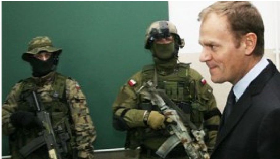
Ehem. Ministerpräsident Donald Tusk brauchte die Armee zum Sparen.

tens um Soldaten und Unteroffiziere im Alter zwischen 32 und 35 Jahren, oft mit sehr großer praktischer Erfahrung, und nicht selten hat ihre Ausbildung viel Geld gekostet. Aber es gab kein Pardon, sie mussten gehen.