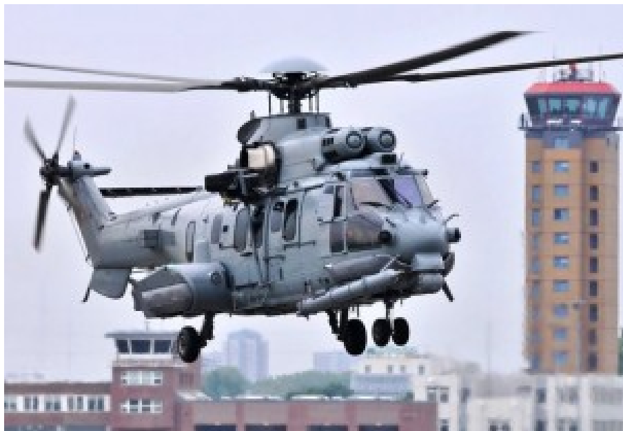
Caracal-Hubschrauber. Kauf storniert.

Satelliten, Aufklärungsflugzeuge, Drohnen – das müssen unsere Prioritäten sein. Außerdem die sehr vernachlässigte Flugabwehr und schließlich die Möglichkeit, dem Gegner einen schweren Schlag auf seinem eigenen Gebiet zuzufügen. Dazu brauchen wir Schiffe und Flugzeuge mit Marschflugkörpern. Wir wollen weder Moskau noch ein anderes Stück von Russland erobern, aber sollten wir angegriffen werden, dann soll sich der Angreifer auf seinem Territorium nicht sicher fühlen.