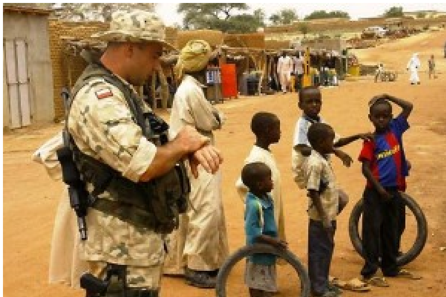
Polnische Truppen in Mali.

Expeditionsarmee: also kaufte man hier ein paar Hubschrauber, da gepanzerte Patrouillenfahrzeuge usw., was man gerade im Irak, in Afghanistan, in Mali so brauchte. Doch wenn es darauf ankommt unser Land zu verteidigen, werden Fähigkeiten und Ausrüstung, die zur Guerillabekämpfung taugen, kaum von Wert sein.