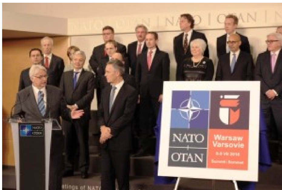
Nato-Gipfel in Warschau Juli 2016.

Zum Glück hat sich das seit den Nato-Gipfeln in Newport (2014) und vor allem in Warschau (2016) grundlegend geändert. US-Truppen sind in Ostmitteleuropa, auch in Polen, stationiert und das bedeutet: ein Angriff auf Polen ist auch ein direkter Angriff auf amerikanische Streitkräfte. Das senkt die russische Risikobereitschaft erheblich.