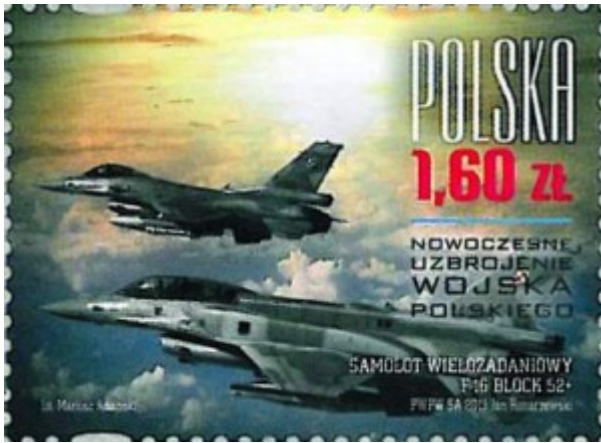
„Moderne Ausrüstung der polnischen Armee“. F-16 US-Mehrzweckkampfflugzeug. Briefmarke der Polnischen Post von 2013.

Wann werden all die Anschaffungen, die sie vorhaben, sich zu einem Ganzen zusammenfügen und einen richtigen qualitativen Sprung in der polnischen Verteidigungsfähigkeit bewirken?