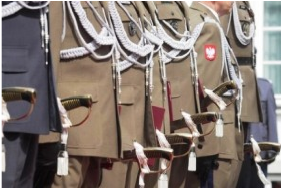
Auf einen Unteroffizier und Offizier entfällt weniger als ein Soldat.

Generell hat unsere Armee viel zu viele „Häuptlinge“, und die Tusk-Regierung hat acht Jahre lang nicht nur nichts dagegen unternommen sondern diesen Zustand noch verstärkt. Ungefähr vierzehntausend Offiziere, ca. zweiunddreißigtausend Unteroffiziere und etwa achtunddreißigtausend Schützen gibt es heute in der polnischen Armee, d. h. auf einen Kommandeur entfallen 0,9 Soldaten. Vor dem Zweiten Weltkrieg war das Verhältnis 1 : 4, in der US-Armee beträgt es heute 1 : 5.