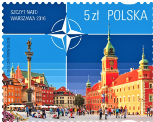
Nato-Gipfel in Warschau. Briefmarke von 2016.

Zum Glück hat sich das seit den Nato-Gipfeln in Newport (2014) und vor allem in Warschau (2016) grundlegend geändert. US-Truppen sind in Ostmitteleuropa, auch in Polen, stationiert und das bedeutet: ein Angriff auf Polen ist auch ein direkter Angriff auf amerikanische Streitkräfte. Das senkt die russische Risikobereitschaft erheblich.