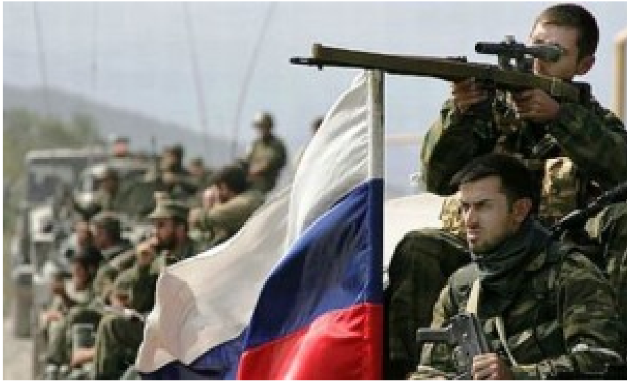
Steht die russische Armee innerhalb von zwei Tagen vor Warschau?

Hinzu kommt, dass es damals auf dem riesigen Nato-Gebiet zwischen Estland und Bulgarien, also in zehn Nato-Frontstaaten, weit und breit keine amerikanischen oder anderen westlichen Nato-Truppen gab, außer einigen Stäben und Ausbildungszentren. Die Nato-Kampfverbände erschienen nur ab und an zu Übungen. Bis etwa 2010 hatte die Nato nicht einmal Verteidigungspläne für den östlichen Teil des Bündnisses. Unsere Nato-Mitgliedschaft war damals eine fast rein politische.