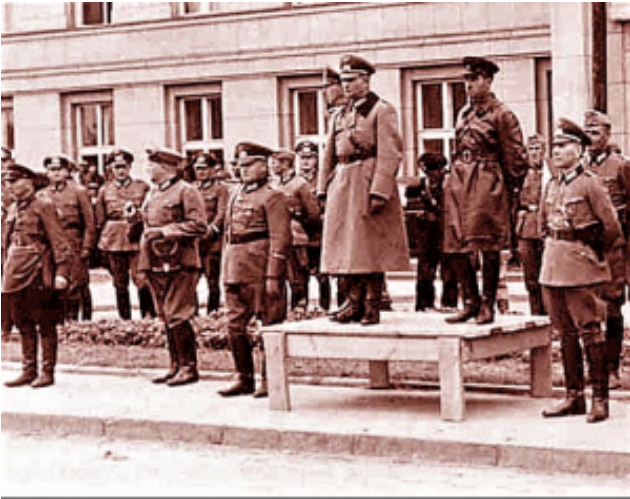
Deutsche und sowjetische Kommandeure nehmen am 29. September 1939 die gemeinsame Siegesparade der Wehrmacht und der Roten Armee im Polnischen Brześć/Brest ab.

Erstens: 1939 gewann die Sowjetunion von Polen die zur Ukraine und zu Weißrussland gehörenden Gebiete zurück. Zweitens: waren zu diesem Zeitpunkt weder Polen noch Großbritannien oder Frankreich bereit, eine große Koalition zur Abwehr der deutschen Aggression einzugehen. Stalin musste angesichts des Scheiterns der Gespräche mit den späteren Verbündeten eine Entscheidung treffen und beschloss, einen Nichtangriffspakt mit Deutschland zu schließen. Er wollte Zeit gewinnen, um sich auf den unvermeidlichen Krieg mit dem Dritten Reich vorbereiten zu können. Ich weiß, dass Polen und die Polen eine andere Sichtweise haben, aber unsere ist die, die ich dargestellt habe.