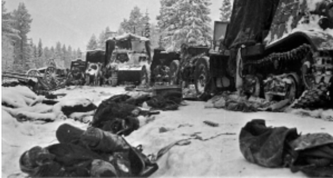
Einmarsch und die verheerenden sowjetischen Verluste in Finnland 1939-1940.

Auch wir haben Erfahrungen mit dem Verhalten der Nato gesammelt, die sich hartnäckig auf Russland zubewegt, ohne ihre früheren Versprechen einzuhalten. Und wir haben eine Anhäufung von historischen Erfahrungen, die zeigen, dass wir immer wieder angegriffen wurden.