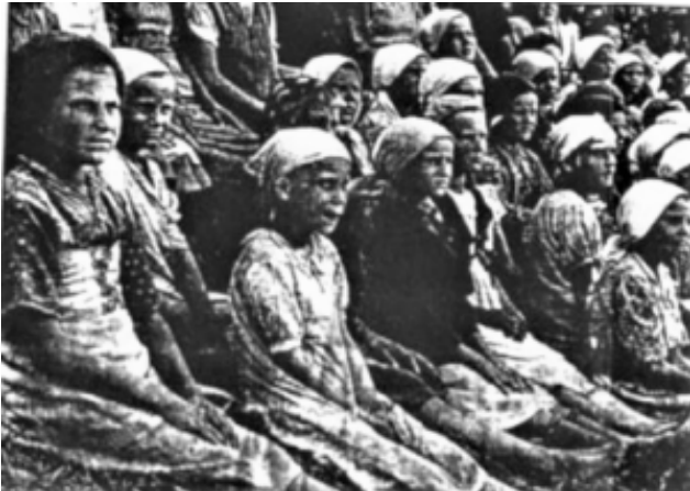
1940 nach Kasachstan zur Zwangsarbeit deportierte polnische Kinder.

Wir haben kürzlich eine Bestandsaufnahme der sowjetischen Soldatenfriedhöfe durchgeführt. Ein Drittel ist stark renovierungsbedürftig, die Hälfte ist sanierungsbedürftig. Gemäß den Vereinbarungen zwischen unseren Ländern, ist Polen für die Pflege der Friedhöfe zuständig, doch kann dies mit Genehmigung der Provinzbehörden auch von russischer Seite geschehen. Da die von den polnischen Behörden bereitgestellten Mittel für größere Renovierungsarbeiten nicht ausreichen, renovieren wir jedes Jahr drei bis vier Friedhöfe. In den Jahren 2020 und 2021 wurde uns die Genehmigung dazu mehrfach verweigert. Wir werden sehen, ob es sich um einen Zufall oder um eine dauerhafte Erscheinung handelt.