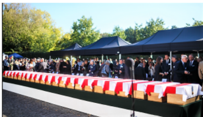
September 2019. Eine der vielen Beerdigungen einst anonym verscharrter, jetzt wiedergefundener, exhumierter und identifizierter Opfer des kommunistischen Terrors in Polen.

Diese Ängste beziehen sich auf Ereignisse, die auch wir aus der eigenen Geschichte kennen. Ja, die Möglichkeit der Auslöschung der biologischen Existenz der Polen und aller anderen Slawen, im Falle eines deutschen Sieges im Zweiten Weltkrieg, war akut gegeben. Der Einmarsch der Sowjets hat sie abgewendet.