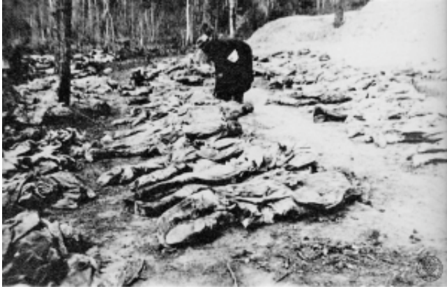
Nach der Öffnung der von den Deutschen 1942 in Katyń bei Smolensk entdeckten Massengräber mit den, von den Sowjets 1940 ermordeten, polnischen Offiziere.

Russland vereinfacht die Geschichte stark in seinem Interesse. Den Polen fällt es schwer, den Molotow-Ribbentrop-Pakt, auch bekannt als Hitler-Stalin-Pakt, zu vergessen. Er öffnete der deutschen Maschinerie den Weg zur Eroberung Europas und spaltete die Nationen. Dann war da noch 1940 die Ermordung Tausender polnischer Offiziere in Katyń. Und in russischen Filmen beginnt alles immer im Juni 1941.