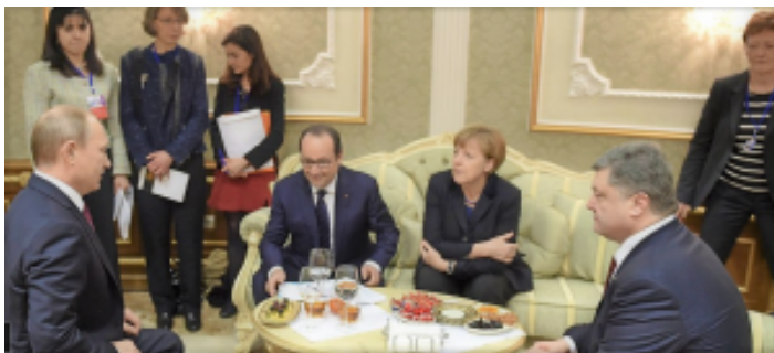
V. l. n. r.: Wladimir Putin (Russland), François Hollande (Frankreich), Angela Merkel (Deutschland) und Petro Poroschenko (Ukraine) verhandeln die Minsker Vereinbarungen im Februar 2015.

Sie lesen ja ukrainische Medien und wissen auch, dass selbst diese von Anfang an gesagt haben, dass die Bedrohung nicht so groß sei, wie sie von den Amerikanern dargestellt wird. Sie wussten, dass diese Panik die ukrainische Wirtschaft schädigen wird. Und genau das ist geschehen.