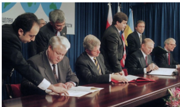
Der russische Präsident Boris Jelzin, der amerikanische Präsident Bill Clinton, der ukrainische Präsident Leonid Kutschma und der britische Premierminister John Major (v.l.n.r.) am 5. Dezember 1994 bei der Unterzeichnung des Budapester Memorandums.

Die Kiewer Behörden haben das alles zwar unterschrieben aber nicht geliefert. In letzter Zeit sagen Präsident Selenskyj und sein Gefolge ganz offen, dass sie die Minsker Vereinbarungen nicht mögen und nicht die Absicht haben, sie umzusetzen. Es wird behauptet, dass Präsident Poroschenko gezwungen wurde, diese Abkommen zu unterzeichnen, und dass ihre Umsetzung zum Auseinanderbrechen des Landes führen wird. Nun, man kann Verschiedenes sagen, aber die Dokumente sind da. Die Ukraine sollte sich daran halten.