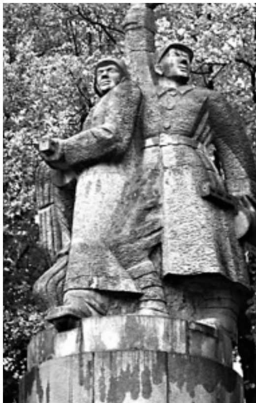
Demontiertes Ruhmesdenkmal in Inowrocław/Hohensalza.

Herr Botschafter, Sie haben die Entfernung von Ruhmesdenkmälern für die Sowjetarmee, die nicht entstanden sind, weil die polnische Gesellschaft sie errichten wollte, erwähnt. Die Öffentlichkeit in Russland lebt jedoch in dem Irrglauben, dass es sich bei den Entfernungen um Friedhöfe handelt. Diese Friedhöfe werden jedoch gut gepflegt und geschützt, wovon man sich in Masowien, z. B. in Warschau oder in der Nähe von Pułtusk, schnell überzeugen kann.