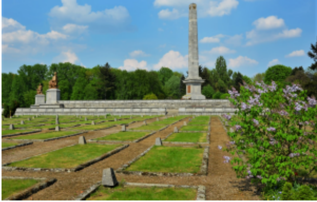
Sowjetischer Soldatenfriedhof in Warschau.

Wir haben kürzlich eine Bestandsaufnahme der sowjetischen Soldatenfriedhöfe durchgeführt. Ein Drittel ist stark renovierungsbedürftig, die Hälfte ist sanierungsbedürftig. Gemäß den Vereinbarungen zwischen unseren Ländern, ist Polen für die Pflege der Friedhöfe zuständig, doch kann dies mit Genehmigung der Provinzbehörden auch von russischer Seite geschehen. Da die von den polnischen Behörden bereitgestellten Mittel für größere Renovierungsarbeiten nicht ausreichen, renovieren wir jedes Jahr drei bis vier Friedhöfe. In den Jahren 2020 und 2021 wurde uns die Genehmigung dazu mehrfach verweigert. Wir werden sehen, ob es sich um einen Zufall oder um eine dauerhafte Erscheinung handelt.