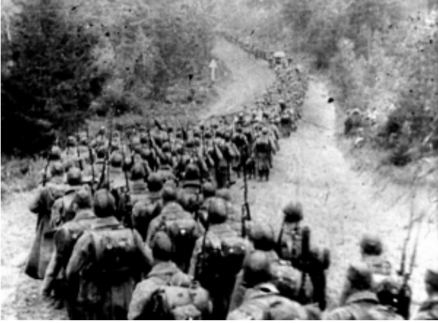
Einmarsch der Sowjets in Polen am 17. September 1939.