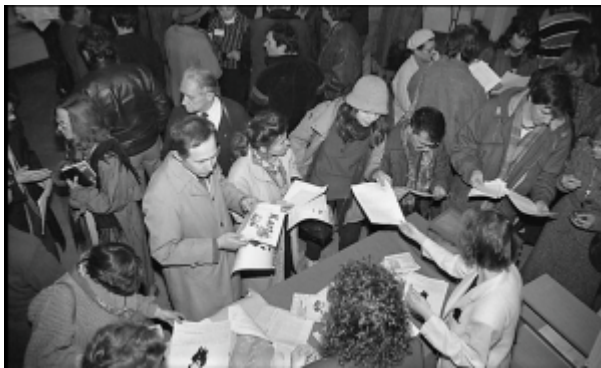
Warschau im April 1992. Tausende Polen kamen zu den Veranstaltungen der zum ersten Mal aus Moskau angereisten Mitarbeiter der russischen Gedenkvereinigung Memorial, auf der Suche nach Informationen über ihre in die sowjetischen Lager in Sibirien und Kasachstan zwischen 1939 und etwa 1947 verschleppten und verschollenen Angehörigen.

Doch, es sieht das, weil wir selbst eine zwiespältige Haltung zu unserer eigenen Geschichte nach 1917 haben. Niemand in unserem Land sagt, dass die Roten nur gut und die Weißen nur schlecht waren. Wir versuchen, unsere Geschichte ausgewogen zu betrachten, um zu verstehen, warum bestimmte Prozesse stattgefunden haben, was sie verursacht hat. In jeder Periode, sowohl in der Zeit vor 1917 als auch in der Sowjetzeit, gab es Gutes und Schlechtes. Man kann nicht sagen, dass alles nur ein Albtraum war, ein „schwarzes Loch“. Dies gilt selbst für die Zeit des Stalinismus.