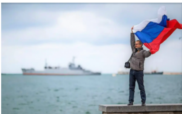
Russischer Nationalstolz auf der besetzten Krim.

Dazu eine allgemeine Bemerkung: Es ist heute klar, dass es ohne langfristige Verträge keine stabile Gasversorgung geben kann. So teure Anlagen wie die Pipelines kann man nicht ohne eine Abnahmegarantie rentabel verlegen und betreiben. Russland hält sich an alle seine Vereinbarungen. Es stimmt nicht, dass wir Energie für politische Erpressung benutzen, denn wir sind von diesen Geschäften genauso abhängig wie die Gasabnehmer.