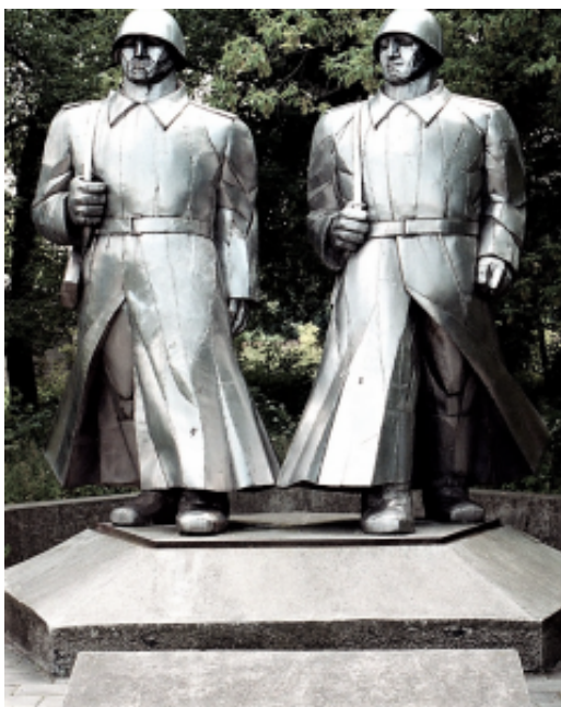
Demontiertes Ruhmesdenkmal in Dąbrowa Górnicza/Dombrowa, Oberschlesien.

Man darf demonstrieren, aber ohne Gewalt und ohne gegen die Gesetze zu verstoßen.