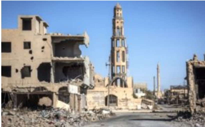
Das zerstörte Karakosch.