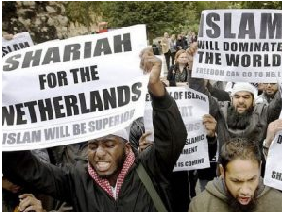
Moslems protestieren in London gegen einen Auftritt des rechten holländischen Politikers Geert Wilders, Oktober 2009.

laufen aufwendige Integrationsprogramme aufgelegt, wie z.B. in Frankreich: kleine Sportzentren, Jugendhäuser, Kultureinrichtungen, Sozialarbeiter. Das alles ist gescheitert.