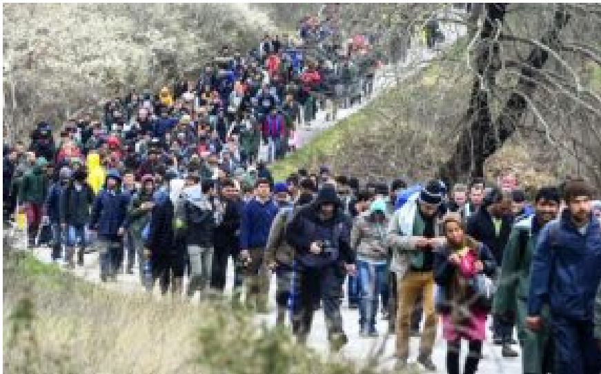
Die Völkerwanderung ist ausgebrochen.

Der Schutzwall Europas wurde immer dünner bis er brach. Gaddafis Regime in Libyen war sein wichtigster Bestandteil. Auch das ägyptische Einfallstor wurde weit aufgerissen. Hinzu kamen die Zerschlagung des Irak und der Zusammenbruch Syriens. Bis dahin war das Durchqueren dieser Staaten schwierig. Die Diktaturen mit ihren funktionierenden Sicherheitskräften blockierten den Weg.