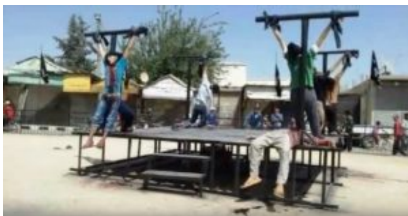
„Du liebst Christus, du wirst sterben wie Christus“. Vom IS ermordete Christen, Syrien August 2015.