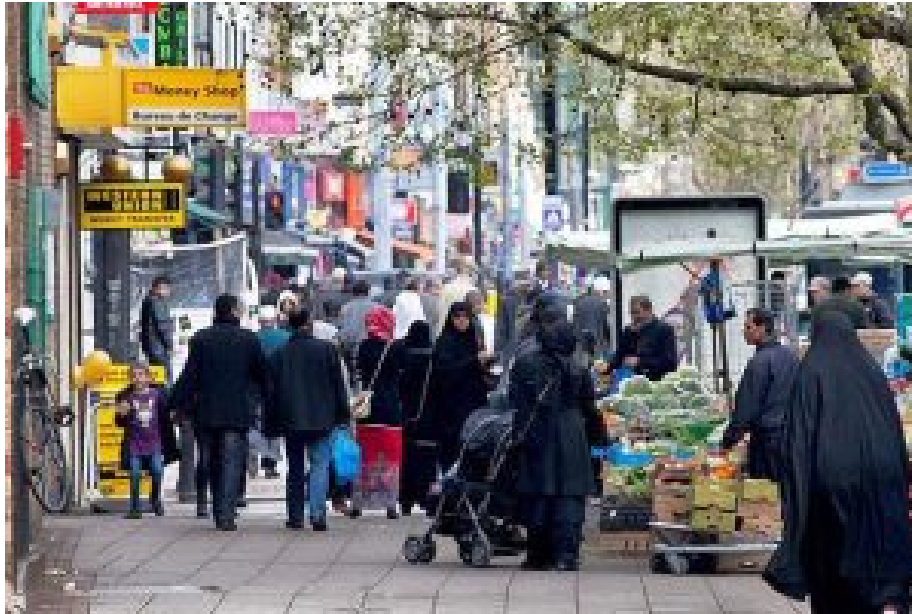
Straßenszene im Londoner Stadtteil Tower Hamlets.

Niemand von diesen Leuten will nach Polen, Ungarn, Slowenien oder Lettland gehen, Polnisch, Ungarisch, Slowenisch oder Lettisch lernen.