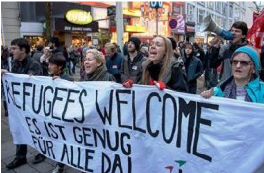
Der anfängliche Willkommens-Enthusiasmus ist vorbei, Demonstration in Wien, November 2016.

Selbstverständlich! Doch das ist vorbei. Meine deutschen Bekannten wohnen auf Sylt. Anfänglich wollten alle dort den Ankömmlingen helfen. Als dann aber zweihundert Leute ankamen, als im November 2015 der erste Mord geschah, als reitende Frauen grob belästigt wurden, bekamen die Menschen Angst. Heute wollen sie niemanden mehr aufnehmen, aber die alte Idylle ist Vergangenheit.