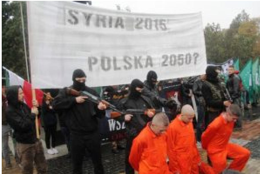
Anti-Migranten-Happening in Lublin, September 2015.

Wesentlich. Die meisten Polen spüren instinktiv, dass hier eine Utopie verwirklicht werden soll, die Multikulti-Gesellschaft.