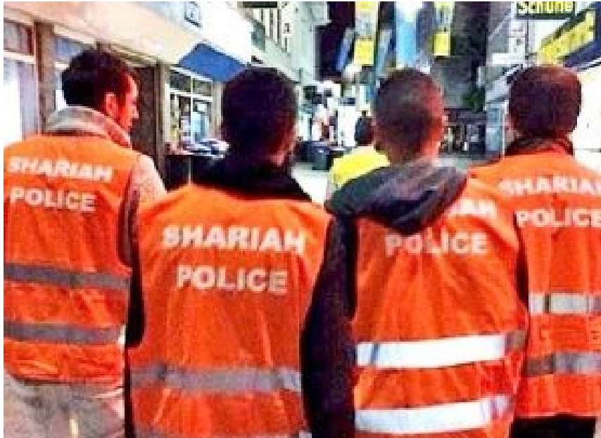
Scharia-Polizei in Wuppertal.

Papst Franziskus ruft ständig dazu auf Migranten aufzunehmen.