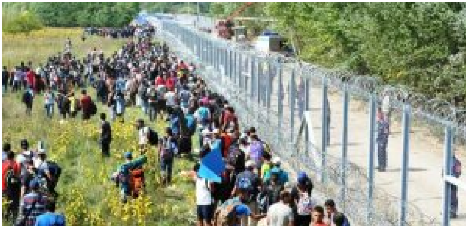
Ungarischer Stacheldrahtzaun an der serbischen Grenze. Orban hat sich viel Ärger eingehandelt.

Viktor Orban hat sich in Ungarn zu entschiedenen Maßnahmen durchgerungen. Er hat einen doppelten Grenzzaun bauen und scharf bewachen lassen.