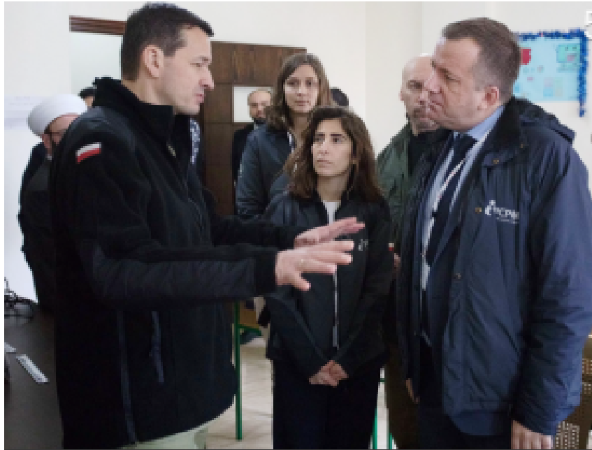
Ministerpräsident Mateusz Morawiecki im Gespräch mit polnischen Helfern in Akkar am 13.02.2018.