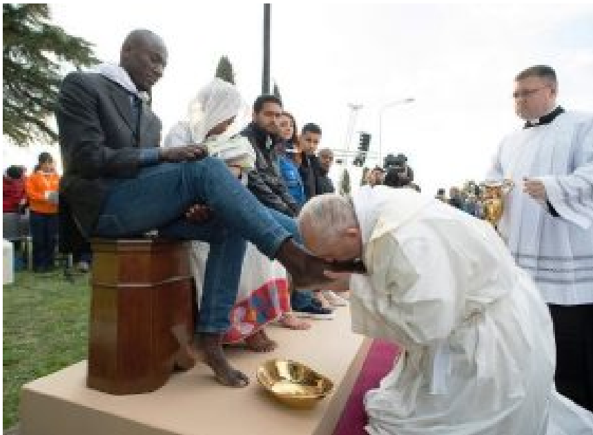
Papst Franziskus wäscht und küsst die Füße von Moslems, April 2016.

Papst Franziskus wusch und küsste die Füße von Moslems in der Gründonnerstagsmesse 2016. Er holte Moslemfamilien von der Insel Lesbos. Das sind eindrucksvolle christliche Gesten. Nur sollten solche Gesten an jene gerichtet sein, die sie im christlichen Sinne verstehen. Das ist genauso wie mit dem Hinhalten der anderen Wange. Halten wir sie einem Dummkopf hin, dann wird er dadurch noch dreister.