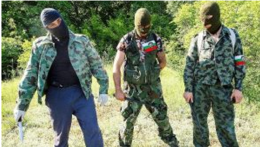
Bulgarische Schlägertruppe auf der Jagd nach Migranten.

Der Westen zaudert, gibt sich weitgehend lustlos und handlungsunfähig. Die Staaten unserer Region, Polen, Ungarn, die Slowakei und sogar das vom Atheismus durch und durch geprägte Tschechien leisten Widerstand.