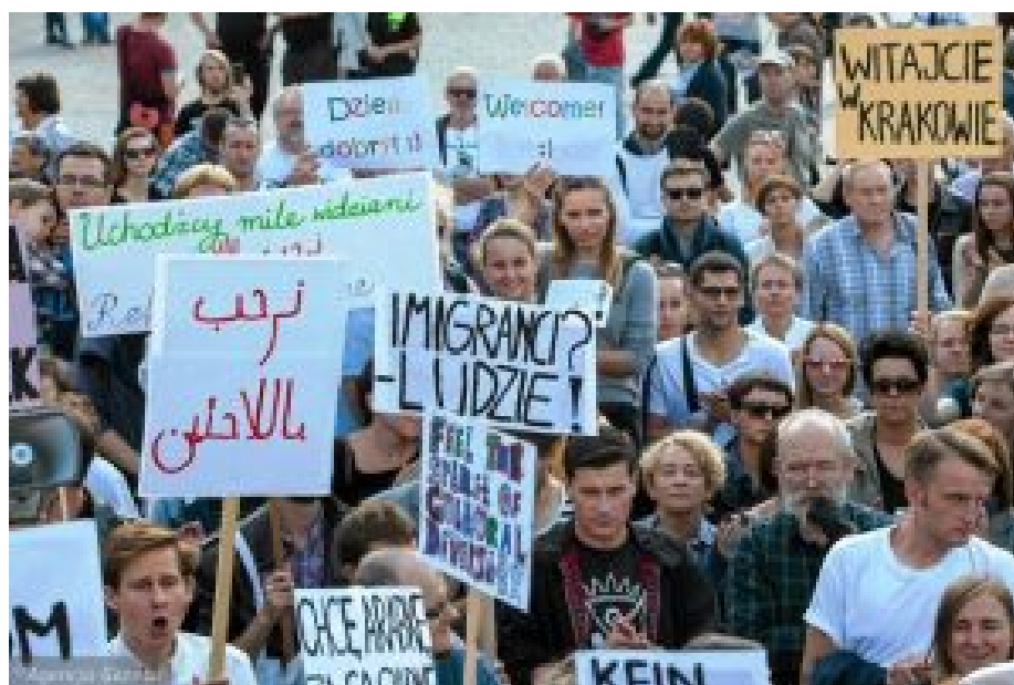
Refugees-Welcome-Kundgebung in Kraków, September 2015.

Großbritannien und Dänemark wurden aus diesem System von vorneherein ausgenommen. Brüssel weiß, dass die Regierungen dieser Länder auf ihre Wähler hören müssen. Es ist an der Zeit Brüssel daran zu gewöhnen, dass die jetzige polnische Regierung das auch tun muss.