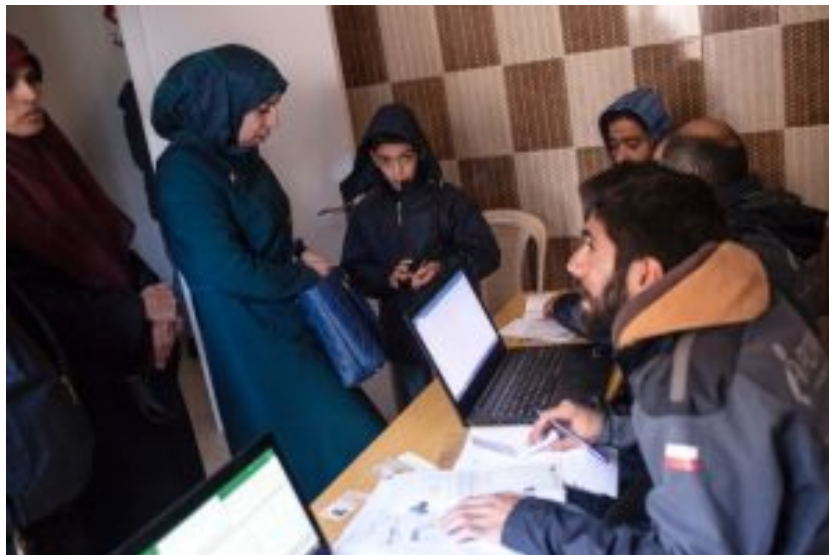
Polnischer Mitarbeiter von PCPM sammelt Anträge auf Winterhilfe von syrischen Flüchtlingen im Libanon.

– PCPM) – Polnisches Zentrum für Internationale Hilfe, ebenfalls eine nichtkirchliche Organisation, ist in den syrischen Flüchtlingslagern im Libanon tätig. Zwischen Oktober und Dezember 2017 zahlte es monatliche Beihilfen von 147 US-Dollar an 1.100 Flüchtlingsfamilien in der Provinz Akkar aus.