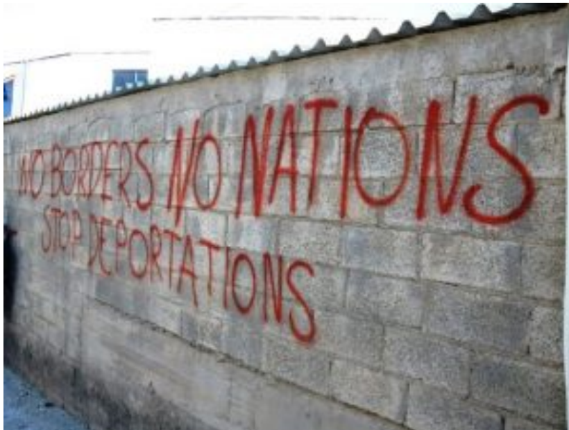
Verfechter der naiven Zuversicht. Parole „No borders, no nations, stop deportations“.

Keine Ausnahmen. Die Verfechter der naiven Zuversicht sind nicht so naiv um nicht zu wissen, dass Völker mit einem starken nationalen Zusammenhalt ihrer Vorstellung vom Umbau Europas gefährlich werden könnten. Der Patriotismus dieser Völker, den sie mutwillig mit Nationalismus gleichsetzten oder unwissentlich damit verwechseln, könnte das Feuer unter ihrem Schmelztiegel auspusten.