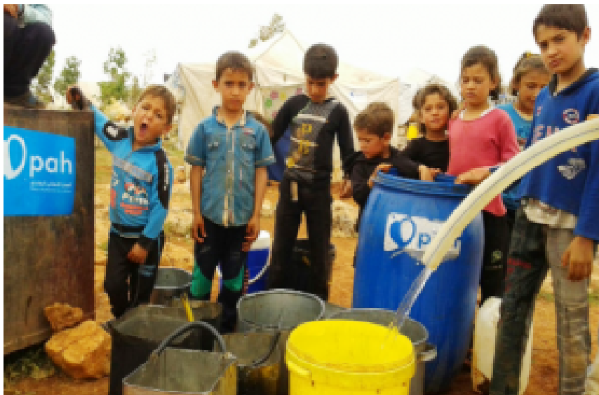
Flüchtlingslager in Syrien. Polska Akcja Humanitarna liefert Trinkwasser.

Polska Akcja Humanitarna (Polnische Humanitäre Aktion), das größte nichtkirchliche Hilfswerk Polens, ist seit 2012 in Syrien, in den Provinzen Idlib und Aleppo tätig. Die PAH beliefert 53 Flüchtlingslager mit frischem Wasser in Tankwagen, kümmert sich um die Leerung von Fäkaliengruben, besorgt die Müllabfuhr, baut Pumpstationen, Latrinen und dazugehörige Waschstellen. Verteilt Hygieneartikel. Beliefert Backstuben mit Mehl und Hefe. In türkischen Flüchtlingslagern finanziert die PAH Schulbusse, die Kinder zum Unterricht und wieder nach Hause bringen.