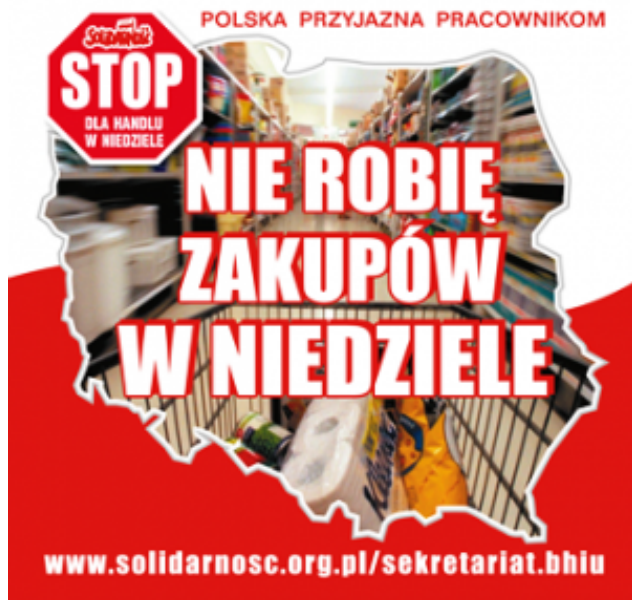
Solidarność-Plakat. „Ich kaufe nicht am Sonntag ein.“

Erst 2007 gelang es der ersten Regierung Jarosław Kaczyńskis, trotz Sturmfeuer der liberalen Medien und unzähliger Herolde der freien Marktwirtschaft, den Art. 151 §1 ins Arbeitsgesetzbuch zu bringen: „Die Arbeit an gesetzlichen Feiertagen im Handel ist nicht erlaubt“. Der politische Kampf um die zehn Worte war sehr heftig und Vorhersagen genauso düster, wie vor der Einführung des Verkaufsverbots an Sonntagen.