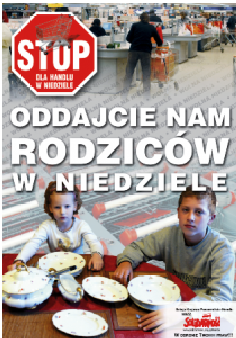
Solidarność-Plakat. „Gebt uns die Eltern am Sonntag zurück.“

Mit von der Partie waren auch die Verbände und Lobbyisten des Discounthandels mit ihren düstersten Vorhersagen. Bis zu 80.000 Angestellte im Handel würden arbeitslos, umgerechnet bis zu einer Milliarde Euro Steuereinnahmen könnten wegfallen, wenn die Läden nur noch an sechs Tagen geöffnet sein würden.