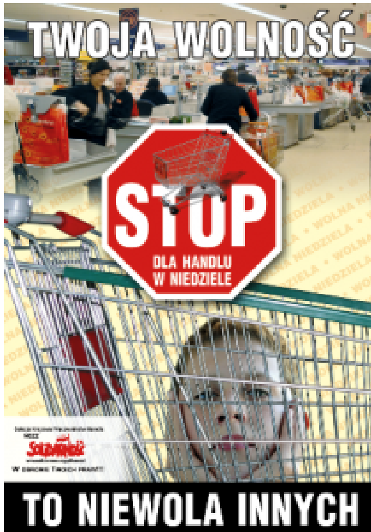
Solidarność-Plakat. „Deine Freiheit ist die Unfreiheit der anderen.“

Nach den Wahlen von 2015 versuchte die neue Regierungspartei die Umsetzung dieses Wahlversprechens erst einmal auf die lange Bank zu schieben. Sie befürchtete heftigen Widerstand, geschürt von der Opposition und deren Medien. Dabei hatte sie doch bereits den hitzigen Konflikt um die Justizreform am Hals. Hinzu kam die zornige Auseinandersetzung um einen besseren Schutz des ungeborenen Lebens, genauer, das Verbot kranke Kinder im Schoß der Mutter zu töten.