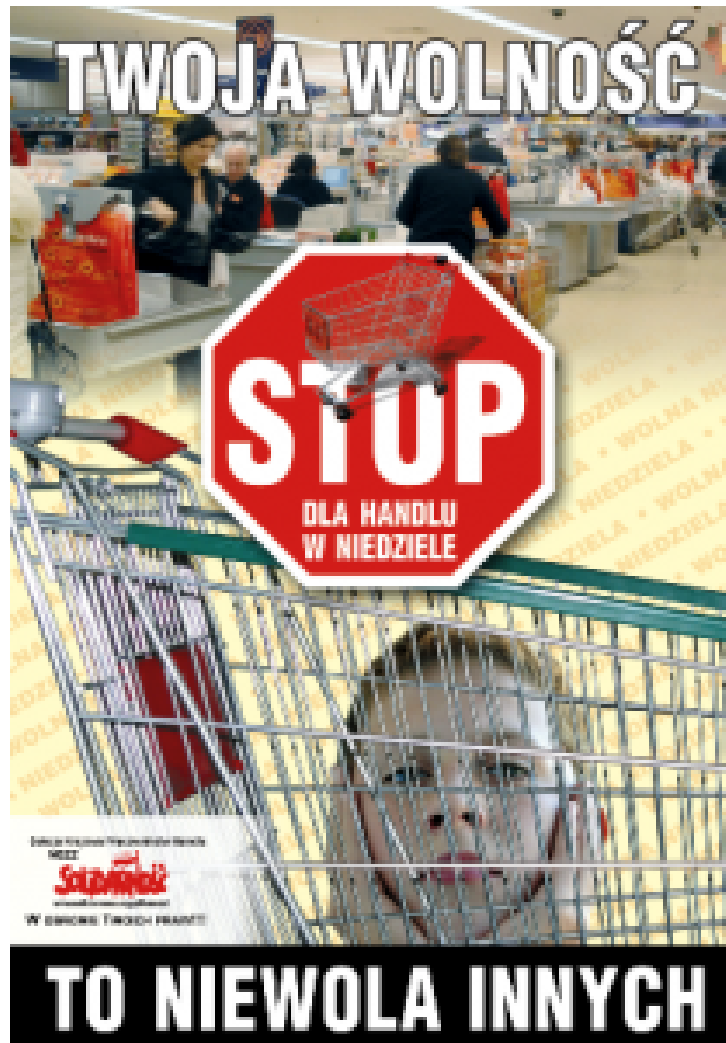
Solidarność-Plakat. „Deine Freiheit ist die Unfreiheit der anderen.“

Nach den Wahlen von 2015 versuchte die neue Regierungspartei die Umsetzung dieses Wahlversprechens erst einmal auf die lange Bank zu schieben. Sie befürchtete heftigen Widerstand, geschürt von der Opposition und deren Medien. Dabei hatte sie doch bereits den hitzigen Konflikt um die Justizreform am Hals. Hinzu kam die zornige Auseinandersetzung um einen besseren Schutz des ungeborenen Lebens, genauer, das Verbot kranke Kinder im Schoß der Mutter zu töten.