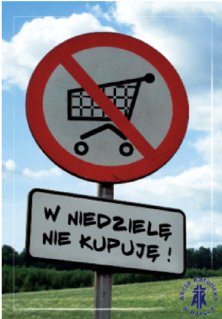
Solidarność-Plakat. „Am Sonntag kaufe ich nicht ein.“

Der damalige, wie es hieß, linke Staatspräsident, der Postkommunist Aleksander Kwaśniewski legte jedoch dagegen sein Veto ein, und das Wahlbündnis Solidarność besaß nicht die erforderliche 3/5 Mehrheit, um dieses Veto im Sejm niederzustimmen. Aldi, Lidl, Netto, die portugiesische Discounterkette Biedronka (Maikäfer), Praktiker, Rossmann u.a. konnten aufatmen.