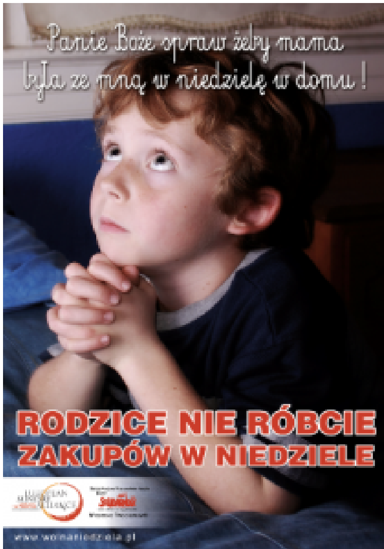
Solidarność-Plakat. Oben: „Herrgott, bitte mach, dass Mutti am Sonntag mit mir zu Hause sein kann.“ Unten: „Eltern, kauft nicht am Sonntag ein.“

Woher die Angaben, auf denen diese Behauptungen fußen eigentlich stammten, blieb ungeklärt. Auch die Methodik der Umfragen lag im Dunkeln. Wer sich genauer einlas, stieß immer wieder auf das Wort „schätzungsweise“. Erste Angaben des Statistischen Hauptamtes, Anfang März veröffentlicht, sprachen da eine ganz andere Sprache.