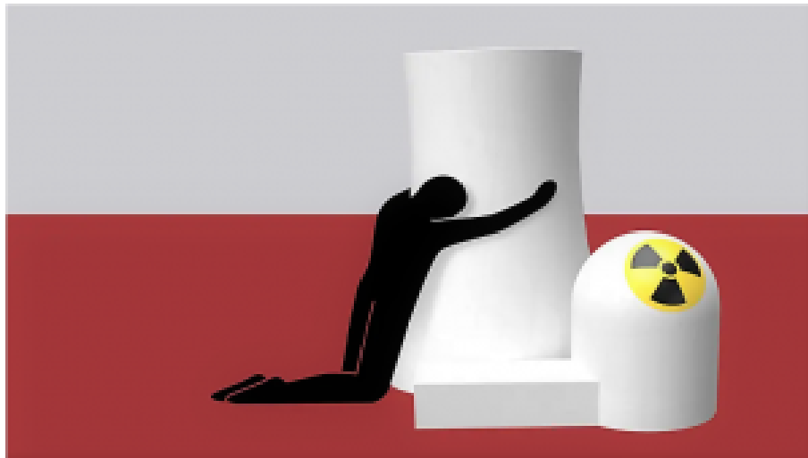
Polnische AKW-Pläne. Deutsche Darstellung

Doch nicht nur in Choczewo fährt Deutschland die geballte Kraft seiner Möglichkeiten gegen polnische Modernisierungsvorhaben auf. Die heute noch bescheidene „Ostsee-SOS“, die deutscherseits aufgepäppelt werden soll, ist eng mit der Initiative „Rettet die Oder“ verbunden. Letztere arbeitet mit der finanzmächtigen deutschen Umweltorganisation BUND zusammen. Ihre Mitglieder blockieren gemeinsam mit polnischen Umweltaktivisten seit einiger Zeit die Wiederherstellung der Binnenschifffahrt auf der Oder.