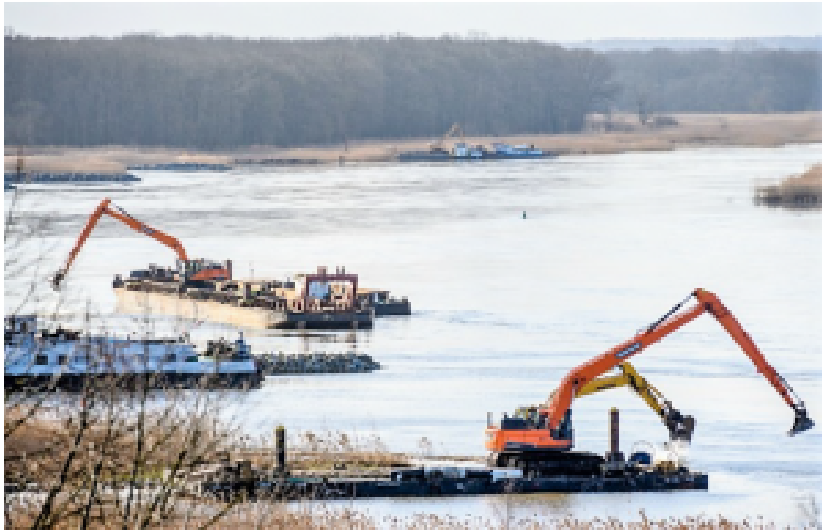
Bauarbeiten an der Oder im Frühjahr 2023

Sterbende Fische und die ökologische Argumentation sollten die bereits laufende Vertiefung der Oder, die die Schifffahrt auf dem Fluss wieder ermöglichen soll, dauerhaft stoppen. Derzeit hat die Oder die niedrige Schifffahrtsklasse II; die Warschauer Behörden wollen sie auf die Klasse III, die Lastkähne mit bis zu 700 Tonnen zulässt, anheben. Deswegen werden auf polnischer Seite die Sporne, seit Jahrzehnten vernachlässigte Uferbefestigungen, modernisiert, um den Fluss schiffbar zu machen, seinen Strom zu kanalisieren und bei dieser Gelegenheit die Hochwassergefahr zu verringern.