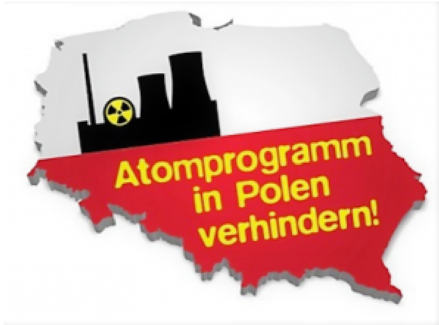
Deutsche Online-Petition gegen polnische AKW

der polnische Tagebau eine Grundwasserverschmutzung und eine zu große Lärmbelästigung verursachen. Deshalb wird Zittau beim EuGH eine Klage gegen das polnische Bergwerk einreichen. Die Braunkohlegruben auf der deutschen Seite der Grenze stören die Zittauer Behörden natürlich nicht so sehr wie die polnische.