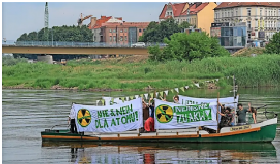
Deutsche Aktivisten gegen polnische AKW. Frankfurt Oder im Juli 2021

Doch nicht nur in Choczewo fährt Deutschland die geballte Kraft seiner Möglichkeiten gegen polnische Modernisierungsvorhaben auf. Die heute noch bescheidene „Ostsee-SOS“, die deutscherseits aufgepäppelt werden soll, ist eng mit der Initiative „Rettet die Oder“ verbunden. Letztere arbeitet mit der finanzmächtigen deutschen Umweltorganisation BUND zusammen. Ihre Mitglieder blockieren gemeinsam mit polnischen Umweltaktivisten seit einiger Zeit die Wiederherstellung der Binnenschifffahrt auf der Oder.