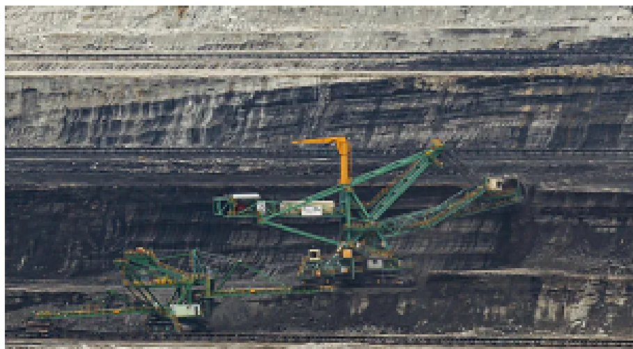
Das Kraftwerk und der Braunkohletagebau in Turów. Von hier kommen knapp 10 Prozent der polnischen Elektrizität

Der Bürgermeister der sächsischen Stadt behauptet, dass der Tagebau in Turów das Bodenniveau um einen Meter senken könnte. Außerdem könnte