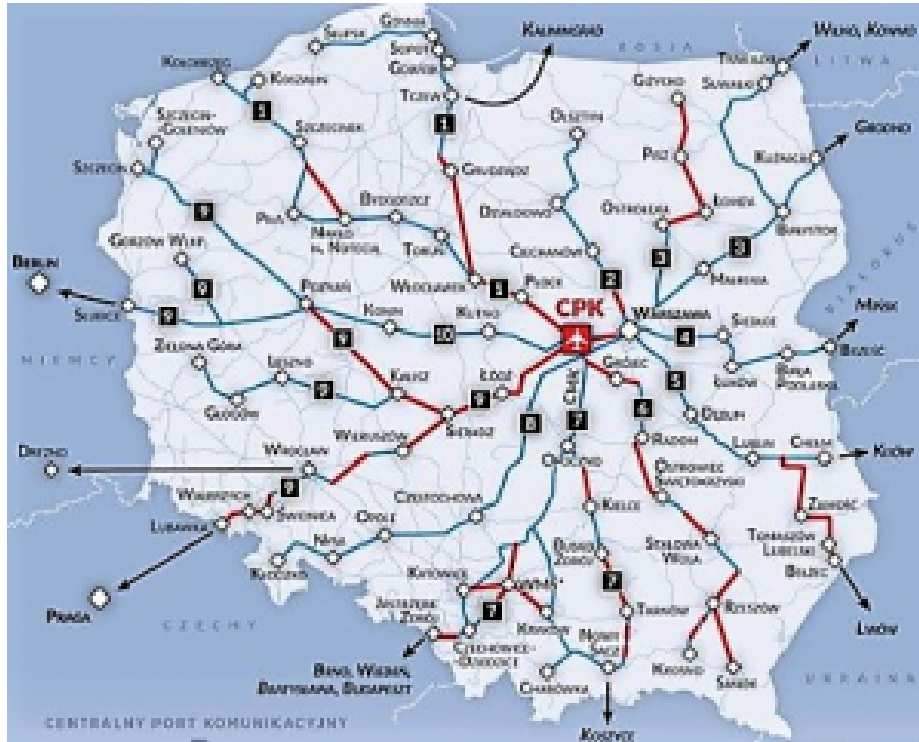
Geplanter Eisenbahnknotenpunkt am künftigen Zentralen Flughafen (CPK) bei Łódź, der bis 2027 fertiggestellt werden soll

nischen Zentralen Flughafen geht. Nicht nur der Personenverkehr und die Konkurrenz zum neuen Flughafen Berlin Brandenburg stehen zur Debatte. Von viel größerer Bedeutung ist das gleichzeitig entstehende Schienennetz, das sich an dem geplanten Flughafen zu einem riesigen Eisenbahnknotenpunkt bündeln soll.