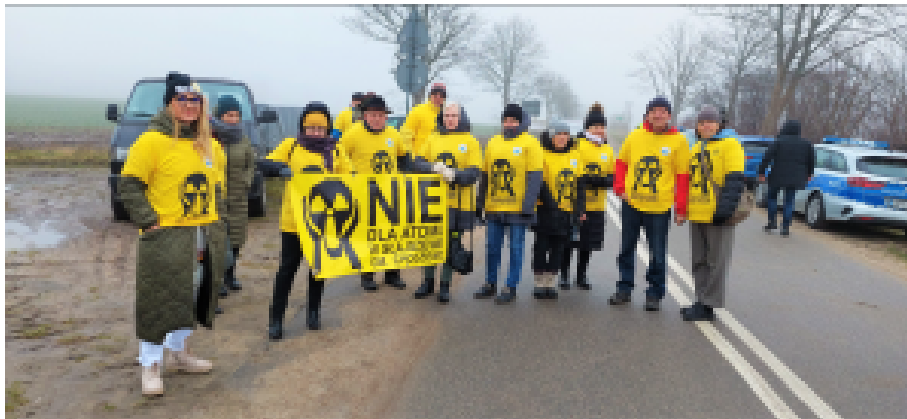
„Ostsee-SOS“-Protest. Ein kleiner Verband, in Deutschland berühmt, in Polen kaum bekannt

funk, die TAZ und etliche andere deutsche Medien berichten in gewohnter Manier von „Angst“, „Protest“, „Befürchtungen“ und dem „Kampf“ der Umweltaktivisten, die sich beim genaueren Hinsehen fast ausnahmslos als die knapp zwei Dutzend Eigentümer von Ferienhäusern und Wohnungen entpuppten. Sie machen sich verständlicherweise Sorgen um ihre Investitionen, während die Kommunalpolitiker und die meisten Einwohner darauf hoffen, dass der AKW-Bau ihnen z.B. die lang ersehnte Kanalisation beschert.