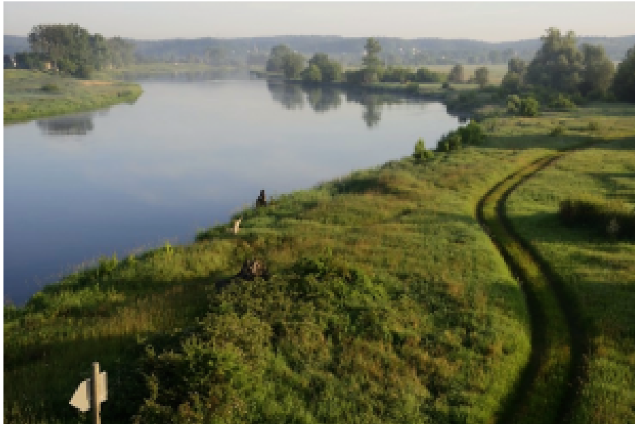
Zwei Wasserwege: der Rhein und die Oder

Es ist die Oder, die genutzt werden könnte, um Güter zwischen Swinemünde und Schlesien sowie Süd- und Osteuropa zu transportieren. Wenn dieser Plan in Erfüllung geht, werden die deutschen Häfen und Logistikzentren nicht nur einen Großteil der polnischen Kunden verlieren, auf die sie bisher angewiesen waren, sondern auch einen großen Teil der Auftraggeber aus Ost-Mitteleuropa.