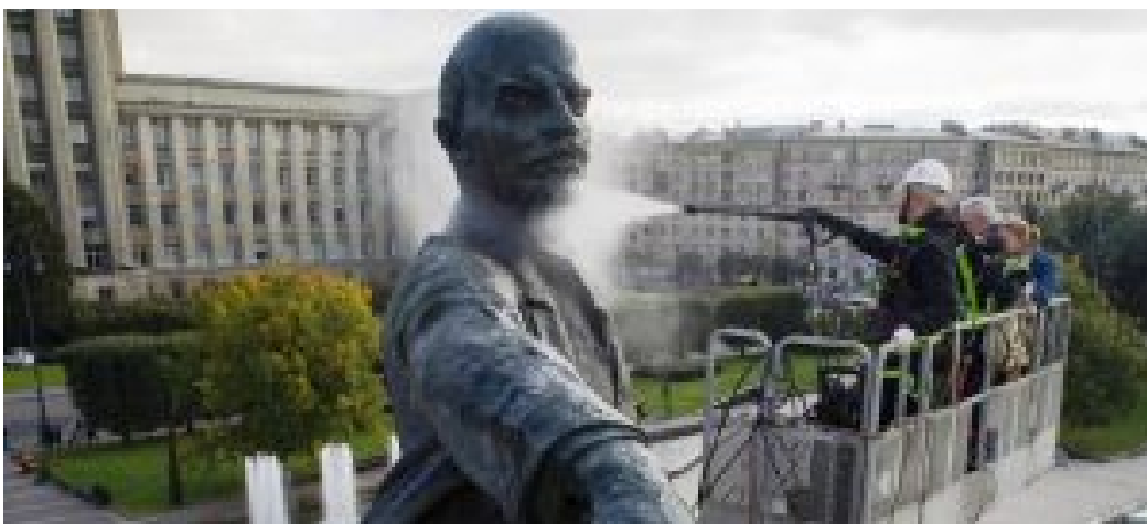
Der Kommunismus funktioniert in dieser Ausstellung gewissermaßen als eine im Ansatz edle und berechtigte Antwort auf den Nationalismus.

Nun schließen sich die Zeit des EU-Beitrittes von Griechenland, Portugal und Spanien, die sich ihrer Diktaturen entledigt haben, die Beitritte Schwedens und Österreichs, die EU-Osterweiterung an.