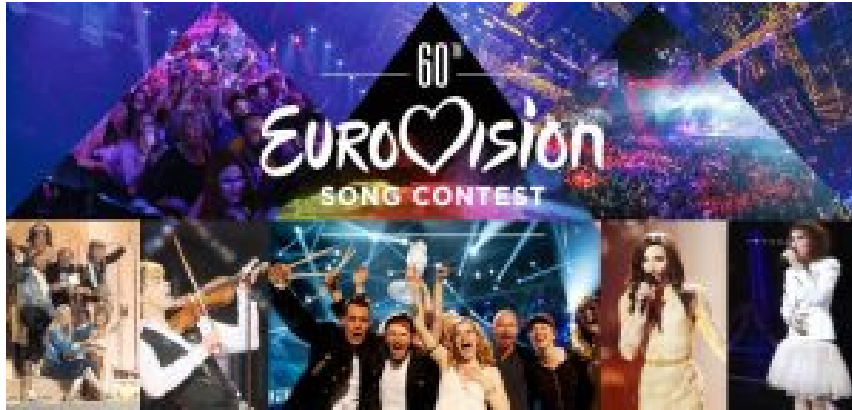
Europa geeint und dennoch vergessen: Radio Luxemburg und der Liederwettbewerb der Eurovision.

Schade, dass die Autoren der Ausstellung die wichtige Rolle der Massenkultur bei der Schaffung eines einheitlichen europäischen Raumes völlig außer Acht gelassen haben. Da ist zum Beispiel Radio Luxemburg, dem, trotz allen Pfeifens und Rauschens im Rundfunkempfänger, in den Sechzigerjahren Millionen osteuropäischer Jugendlicher gelauscht haben, um in Sachen Pop und Beat auf dem Laufenden zu sein.