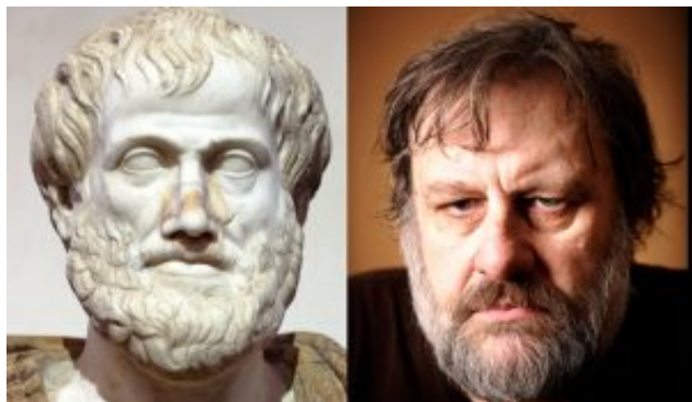
Philosophie in Europa: Aristoteles und Slavoj Žižek. Sonst war da nichts.

Die Philosophie, ja es gab sie in Europa, was man anhand von nur zwei Persönlichkeiten nachvollziehen soll: der von Aristoteles und der von Slavoj Žižek, eines zeitgenössischen slowenischen Neomarxisten und Freudianer. Platon, Augustinus, Thomas von Aquin, ja sogar Hobbes, Locke, Rousseau oder Kant fehlen im europäischen EU-Gedächtnis. Sie wurden aus dem modernen Europa vertrieben, so wie Platon seiner Zeit die Dichter aus seinem Idealstaat verbannte.