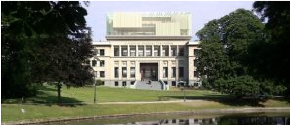
Haus der Europäischen Geschichte in Brüssel.

„Anfang Mai 2017 wurde in Brüssel das Haus der Europäischen Geschichte eröffnet. Das Museum, ein Muster des EU-gewünschten Geschichtsbewusstseins, ist ein offizielles Vorhaben des Europäischen Parlaments und befindet sich in dessen unmittelbarer Nachbarschaft. Leider erinnert die in dem Brüsseler Haus vorgenommene Zusammenfassung der überaus reichhaltigen und vielschichtigen europäischen Geschichte eher an die Schablonen kommunistischer Propaganda aus den Zeiten Josef Stalins: vom Bösen der Zersplitterung und Kleinstaaterei, hin zum Guten der Eintracht; aus der Finsternis der Geschichte empor zum Lichte der EU.