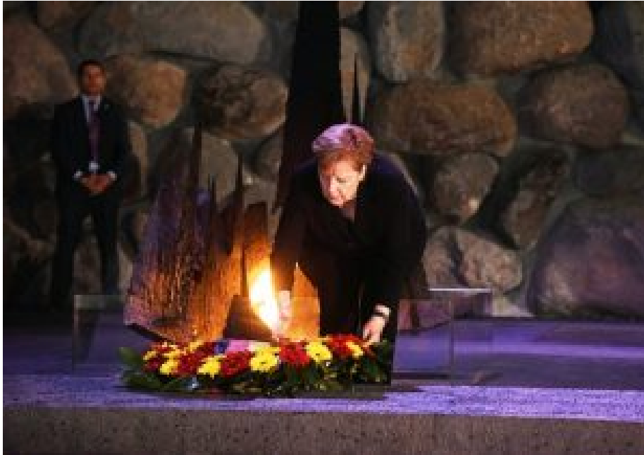
Botschaft des Hauses der Europäischen Geschichte: der vorbildlichen deutschen Aufarbeitung des Holocaust sind die Polen nicht gewachsen. Angela Merkel in der Gedenkstätte Yad Vashem am 4. Oktober 2018.

In der dritten Etage begegnen wir wieder dem Holocaust, der eine Etage tiefer ziemlich verstreut und chaotisch dargestellt wurde. Jetzt geht es um die Erinnerung an den Holocaust als Mahnung und Anklage. An der einen Wand sehen wir die vorbildliche Aufarbeitung des Massenmordes an den Juden in Deutschland und Österreich.