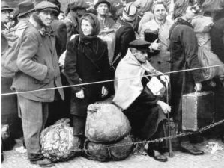
Die klare Botschaft : die Leiden der Zivilbevölkerung im Zweiten Weltkrieg verkörpern an erster Stelle deutsche Vertriebene.

deten Polen, die ein amerikanisches Lager für Displaced Persons (DP) im besetzten Deutschland verlässt. Entspricht die Gewichtung der Bildauswahl exakt der historischen Wahrheit?