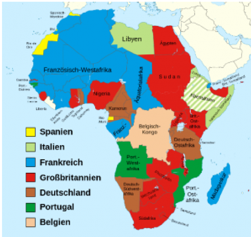
Ganz Europa trägt die Schuld am Kolonialismus? Afrika-Karte von 1914. Die Polen und viele andere europäische Nationen sind nicht dabei.

Zurecht erfahren wir in der Einführung zur Ausstellung einiges über die Verbrechen des europäischen Kolonialismus. Wir erfahren jedoch nicht konkret, welche Staaten diese Verbrechen begangen haben (zur Erinnerung: Belgien, Dänemark, Deutschland, Frankreich, Großbritannien, die Niederlande, Italien, Portugal, Spanien), und welche von ihnen unter dem Kolonialismus litten. Da sind die Balkanländer als Opfer des türkisch-islamischen Kolonialismus sowie die Mittel- und Osteuropäischen Länder, die dem russischen und deutschen Kolonialismus ausgesetzt waren.