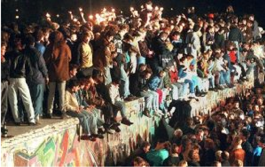
Völkerherbst 1989. Berliner Happy End. Nur das zählt.

Auf dieses Fragment und einige Filmsequenzen über die ersten halbfreien Wahlen in Polen am 4. Juni 1989 folgen noch jeweils einige Sekunden zwecks Erwähnung der „Revolutionen“ und Veränderungen in der Tschechoslowakei, Ungarn, Bulgarien sowie Rumänien. Mehr als fünf Minuten, also siebzig Prozent der Filmerzählung über das historische Jahr 1989 im Osten Europas, sind Deutschland gewidmet. Beginnend mit der Flucht der DDR-Bürger über Ungarn, bis zum Fall der Berliner Mauer. Nur das zählt, und nur dieser Teil der Erzählung ist schlüssig und ergibt einen Sinn.