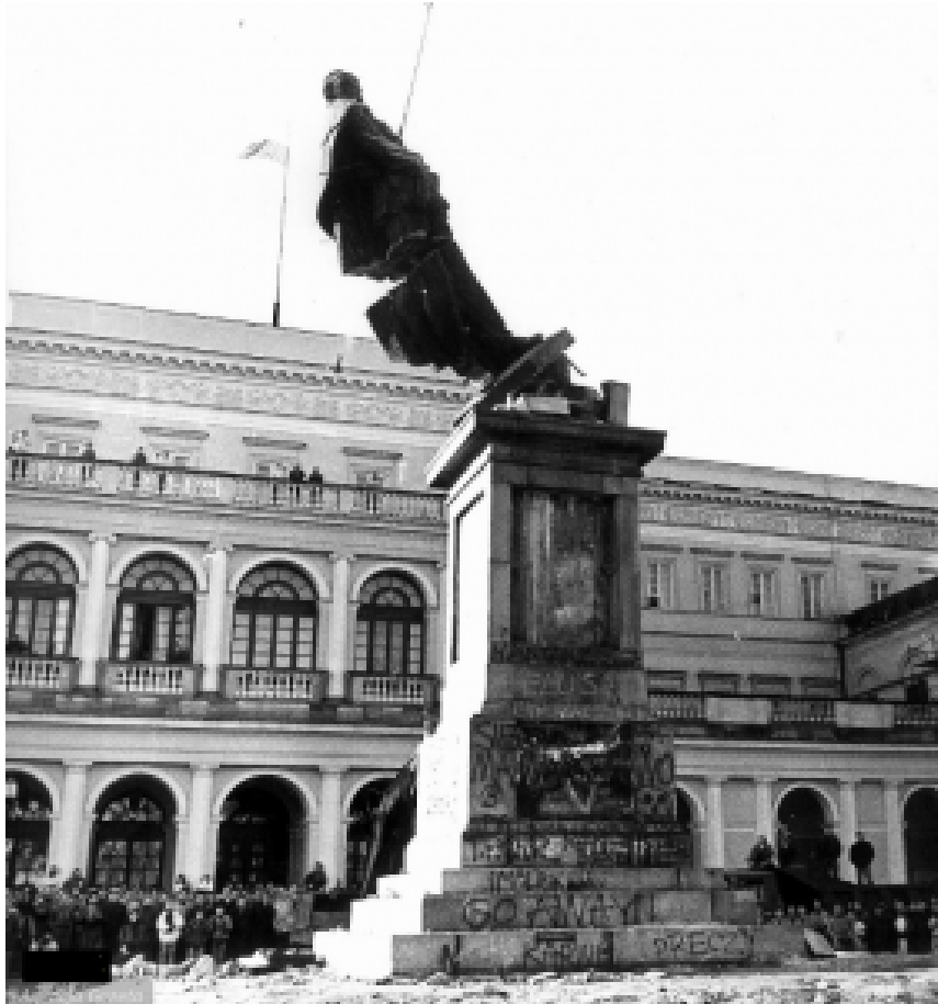
Zerstörung des Dzierżyński-Denkmal in Warschau am 17. November 1989.

Der Kommunismus fungiert in dieser Ausstellung gewissermaßen als eine im Ansatz edle und berechtigte Antwort auf den Nationalismus. Dass der Kommunismus sich, falls erforderlich, hemmungslos des Nationalismus bedient hat, bleibt unerwähnt.