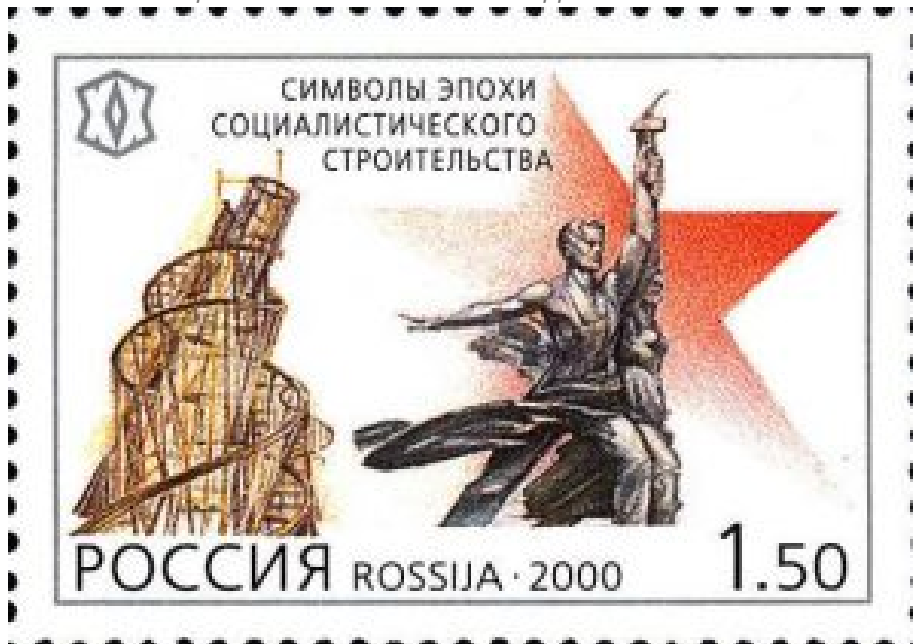
„Symbole der Epoche des sozialistischen Aufbaus“. Russische Briefmarke aus dem Jahr 2000. Links der Entwurf des vierhundert Meter hohen Denkmals für die Dritte Internationale in Moskau.