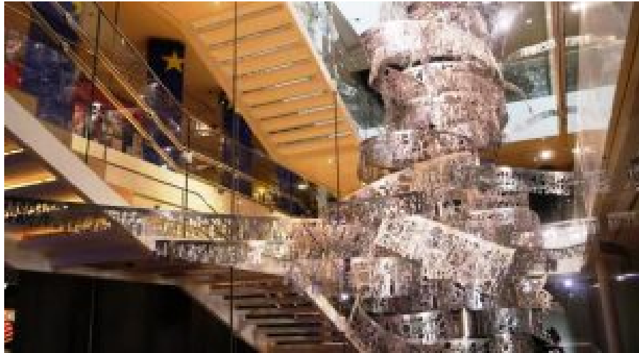
Haus der Europäischen Geschichte. Treppe.