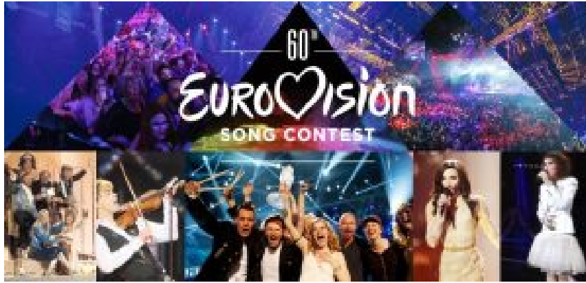
Europa geeint und dennoch vergessen: Radio Luxemburg und der Liederwettbewerb der Eurovision.

Schade, dass die Autoren der Ausstellung die wichtige Rolle der Massenkultur bei der Schaffung eines einheitlichen europäischen Raumes völlig außer Acht gelassen haben. Da ist zum Beispiel Radio Luxemburg, dem, trotz allen Pfeifens und Rauschens im Rundfunkempfänger, in den Sechzigerjahren Millionen osteuropäischer Jugendlicher gelauscht haben, um in Sachen Pop und Beat auf dem Laufenden zu sein.