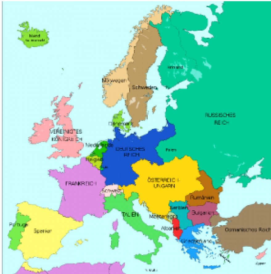
Europa-Karte von 1914. Polen existiert nicht. Es ist damals seit 119 Jahren eine russisch-deutsch-österreichische Kolonie.

Wir hören, dass der Kolonialismus die große Schuld ganz Europas sei, und das ist eindeutig eine historische Fälschung. Die Autoren der Ausstellung unterstreichen, dass Europa (ohne die gerade erwähnten Unterschiede) als solches den Rest der Welt, vor allem im 19. Jahrhundert, ausgebeutet und zugleich seine angebliche technische und kulturelle Überlegenheit zur Schau gestellt hat. Wahrscheinlich aus diesem Grund wird sich so gut wie gar nicht der phänomenalen Entwicklung von Wissenschaft und Technik im Europa jener Zeit gewidmet, und genauso wenig der damals aufblühenden Kunst.