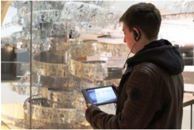
Haus der Europäischen Geschichte. Ohne Tablet erfährt man nichts.

Auf der untersten Ebene befindet sich der kleinste Teil der Ausstellung; über den Mythos Europas, der Prinzessin aus Phönizien, bis hin zum 19. Jahrhundert. Der Elan der einführenden Präsentation kann sich mit der kulturgeschichtlichen Einführung für ein Heimatmuseums messen, mit dem Unterschied, dass hier die Kultur gänzlich fehlt. Zu sehen sind einige Glasvittrinen mit Informationen über das Christentum, Philosophie, Nationen, den Kommunismus und deren Bedeutung für die Geschichte Europas. All diesen Erscheinungen werden jeweils etwa zwei Minuten im Tablet-Führer gewidmet.