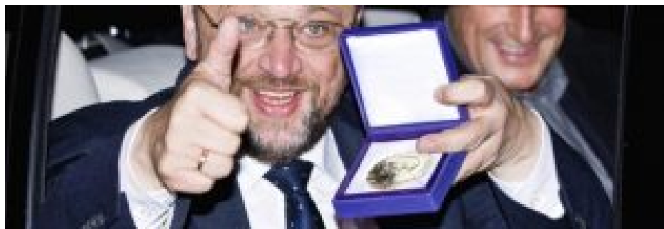
EU-Parlamentspräsident Martin Schulz mit der Friedensnobel-preis-Medaille für die EU in Oslo am 10. Dezember 2012.

Irgendwo im Hintergrund soll es einige kritische Akzente geben: Plaketten etwa, die zum Brexit auffordern. Doch nach der Besichtigung der Ausstellung wissen wir sehr gut, was wir davon zu halten haben.