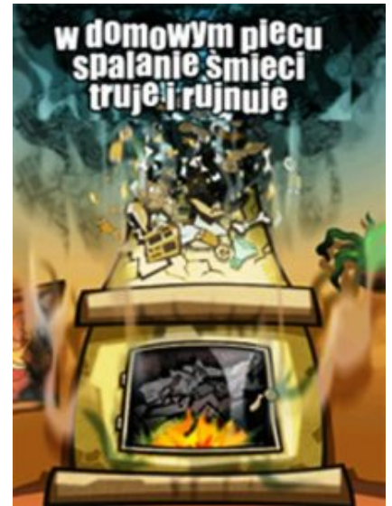
Plakat: „Müllverbrennen im häuslichen Ofen vergiftet und ruiniert“.

Heizöl spielt in Polen bei der Beheizung von Privathaushalten eine geringe Rolle, weil es die teuerste Variante von allen ist, beginnend mit dem Kauf und Einbau der Anlage. Ein Liter Heizöl kostete im Februar 2018 um die 3,30 Zloty pro Liter (ca. 0,80 Euro) und war um etwa 0,20 Euro teuer als in Deutschland.