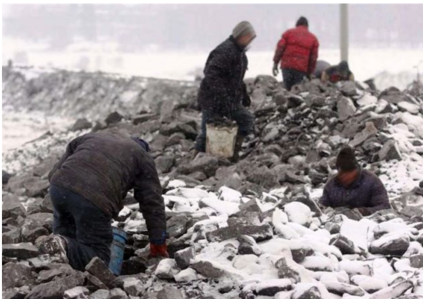
Arbeitslose suchen nach Kohle auf einer Abraumhalde im ober-schlesischen Piekary Śląskie. Winter 2015.

deutlich geringer als bei normaler Kohle. Es ist ein Brennstoff für die Ärmsten, die ihre Öfen und Kessel nicht so schnell austauschen werden, und die sich Erdgas, das in Polen dreimal so teuer ist, nicht leisten können. Es ist zwar nicht erlaubt, dennoch verfeuern Zehntausende bei uns Müll und Kohleschlamm, weil sogar Kohle für sie unerschwinglich ist. Es wäre am besten, wenn die blaue Kohle, genauso wie bleifreies Benzin, subventioniert werden könnte.