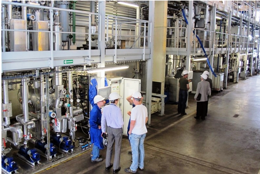
Forschungsanlagen des Instituts für Chemische Kohleverarbeitung (IChPW) im oberschlesischen Zabrze.

Lohnt es sich heute Steinkohle in Polen zu vergasen?