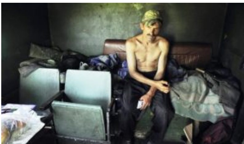
Armut in Polen. Selber schuld?

Die Millionenschar der Verlierer rücksichtsloser Abwicklungen und zwielichtiger Privatisierungen verschwand dabei fast völlig im Dunklen. Ganz im Geiste des damals salonfähig gewordenen „Lumpenliberalismus“, hieß es, da kann man nichts tun. Diese Menschen seien selbst schuld an ihrem Schicksal, weil zu unbeholfen, zu faul, trunksüchtig, nicht anpassungsfähig, kinderreich, zu provinziell um ins Ausland auf Arbeitssuche zu gehen usw., usf.