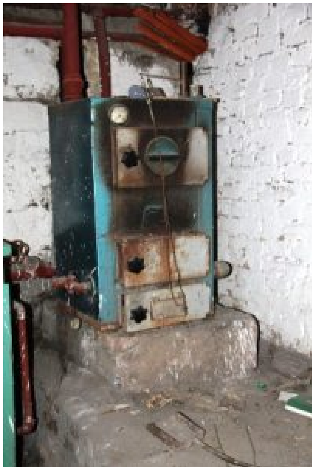
Ein typischer „kopciuch“, „Stinker“.

Seit Januar 2016 dürfen Woiwodschaftsparlamente in den einzelnen Provinzen Einschränkungen bei der Verbrennung von Heizmaterial verhängen. In Kleinpolen (Krakau), Oberschlesien und in der Woiwodschaft Opole (Oppeln) wurden solche Beschränkungen inzwischen eingeführt. Sie sehen vor allem die Beseitigung aller „Stinker“ bis 2022 vor.