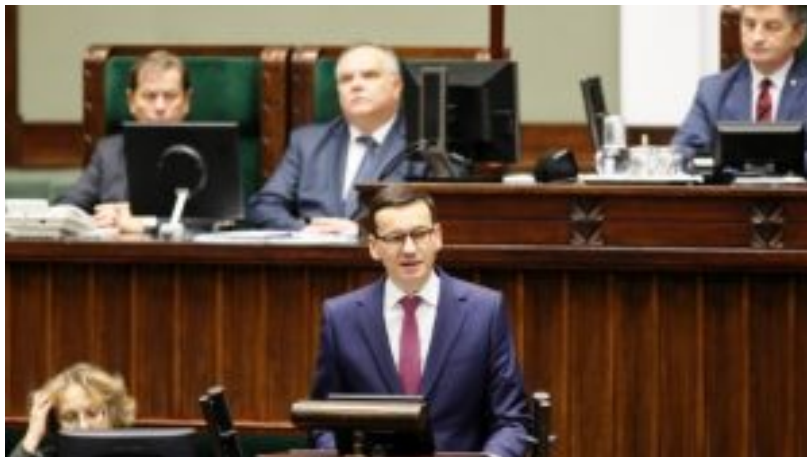
Ministerpräsident Mateusz Morawiecki verliest seine Regierungserklärung im Sejm am 12. Dezember 2017.

beißenden Nebel gehüllt waren und Kinder, die auf dem Rückweg von der Schule einen Mundschutz trugen. Saubere Luft ist eine zivilisatorische Herausforderung und das Maß dessen, ob Polen tatsächlich ein entwickeltes Land ist.