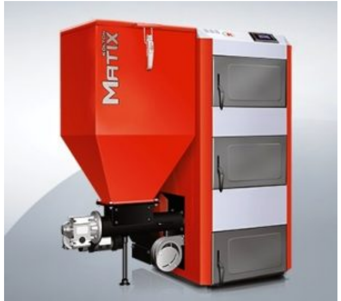
Muss alle „Stinker“ ersetzen. Ein moderner, emissionsarmer Kohleofen der sogenannten fünften Generation.

Gleichzeitig läuft das staatliche Umstellungsprogramm auf moderne Öfen „Kawka“ („Dohle“). In zwei Jahren (2016 und 2017) verschwanden in sechzig Städten für knapp 700 Millionen Zloty nicht ganz 35.000 „Stinker“.