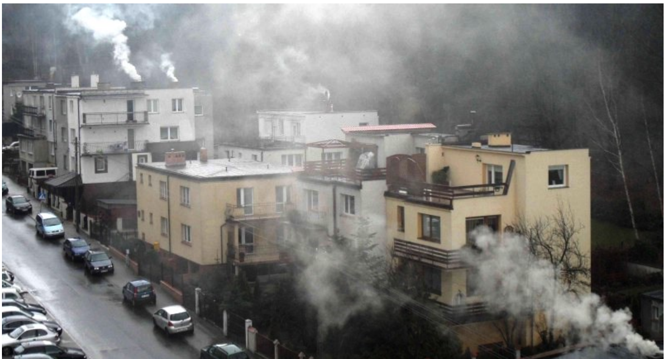
Wintermorgen in einer südpolnischen Stadt.

Kohleverfeuerung in veralteten und schlecht genutzten Anlagen verunreinigt die Luft, besonders im Süden Polens. Doch wir müssen nicht auf Kohle verzichten, wenn wir in der Lage sind die schädlichen Emissionen einzuschränken. Die traditionelle Kohle sollte durch einen neuen, ausstoßarmen Brennstoff ersetzt werden, die sogenannte blaue Kohle.