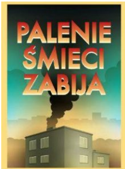
Plakat: „Müllverbrennen tötet“.

Holzpellets bis zu 1.000 Zloty pro Tonne (ca. 250 Euro). Mit ihnen heizen 4 Prozent der Haushalte ohne Fernwärme.