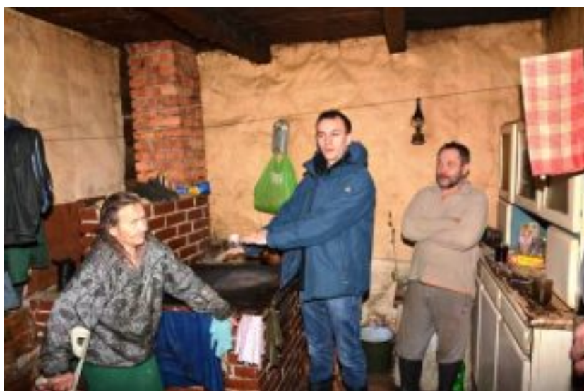
Energiearmut in Polen. Kein Warmwasser, kein Licht, keine Waschmaschine,

Menschen, oft drastisch ihren Energieverbrauch einschränken oder ganz und gar auf ihn verzichten. Ihre monatlichen Energieausgaben überstiegen oft bei Weitem 13 Prozent ihres Einkommens und damit die international geltende Grenze zur Energiearmut.