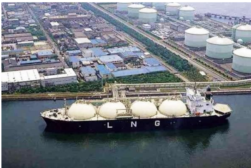
Der neue Flüssiggashafen in Świnoujście/Swinemünde.

Auf der ganzen Welt arbeiten zur Zeit um die dreihundert industrielle Kohlevergasungsreaktoren, davon mehr als zweihundert in China. Europa wendet sich derweil von der Steinkohle ab, setzt auf Erdgas aus dem Osten. Die Deutschen bauen Nord Stream 2, von Russland aus, die zweite Erdgaspipeline durch die Ostsee. Dabei stellt sich die Frage, ob die wachsende Energieabhängigkeit der EU von Russland in unserem Interesse ist, und wie sich der Preis für russisches Erdgas auf lange Zeit entwickeln wird.