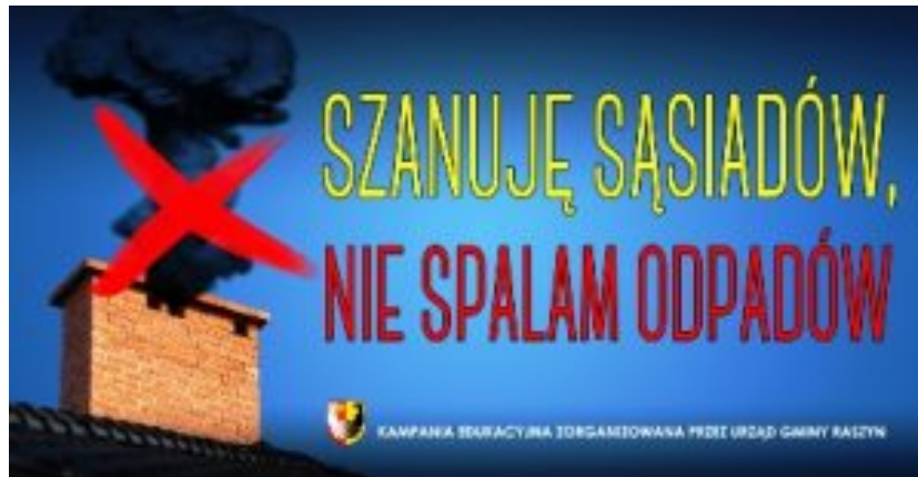
Plakat: „Ich achte meine Nachbarn. Ich verbrenne keine Abfälle“.