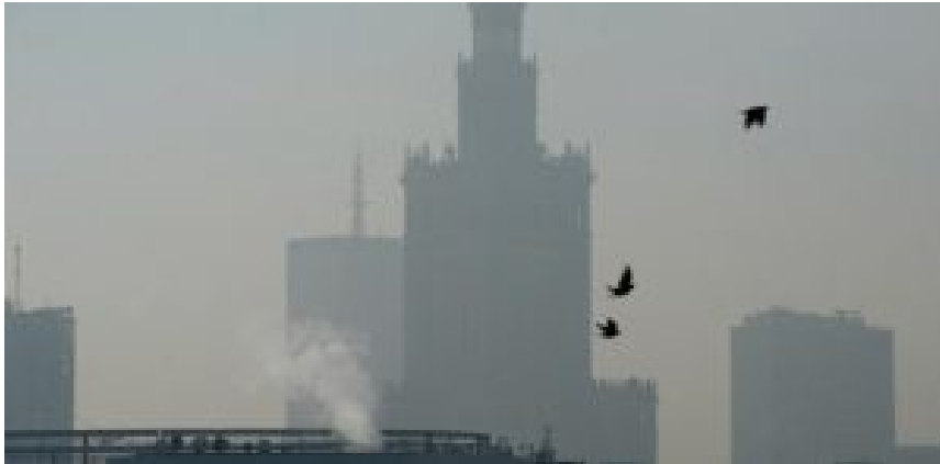
Smog in Warschau.

Eine Durchschrift des Urteils hätte der EuGH direkt an den amtierenden EU-Ratsvorsitzenden schicken sollen. Schließlich war Donald Tusk genau in der Zeit polnischer Ministerpräsident. Luftverschmutzung und Energiearmut waren zu seiner Zeit kein oder kaum ein Thema. Den Karren aus dem Dreck ziehen, und das sehr schnell, müssen seine Nachfolger.