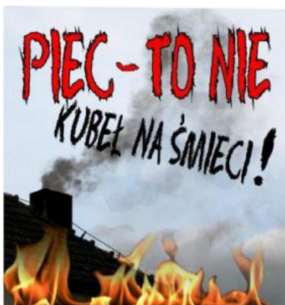
Plakat: „Der Ofen ist kein Mülleimer“.

Heizöl spielt in Polen bei der Beheizung von Privathaushalten eine geringe Rolle, weil es die teuerste Variante von allen ist, beginnend mit dem Kauf und Einbau der Anlage. Ein Liter Heizöl kostete im Februar 2018 um die 3,30 Zloty pro Liter (ca. 0,80 Euro) und war um etwa 0,20 Euro teuer als in Deutschland.