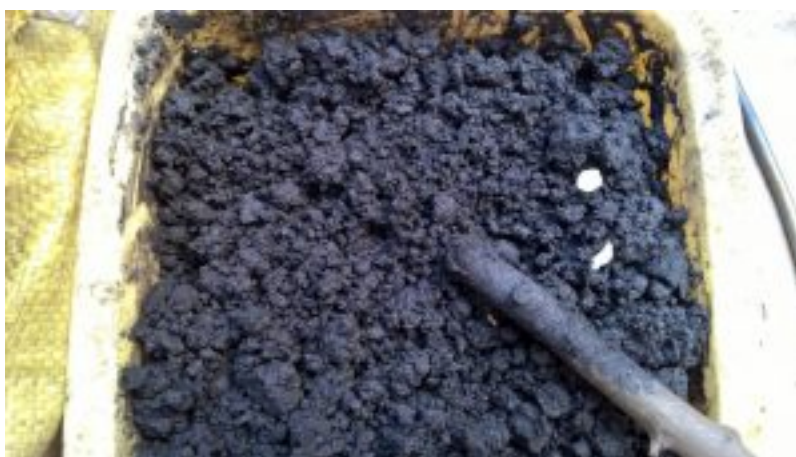
Mit Kohleschlamm wird nicht mehr geheizt.

Außerdem gilt ab dem 1. September 2017 ein Verkaufs- und Verbrennungsverbot für Kohleschlamm und Ballastkohle, schwefelhaltige Abfall- bzw. Nebenprodukte der Steinkohleförderung. Weil sich weite Transportwege nicht lohnten, wurden sie nur in der Bergbauregion Oberschlesien für billiges Geld (100 bis 300 Zloty pro Tonne, ca. 25 bis 75 Euro) verkauft und verpesteten die dortige Luft ungemein.