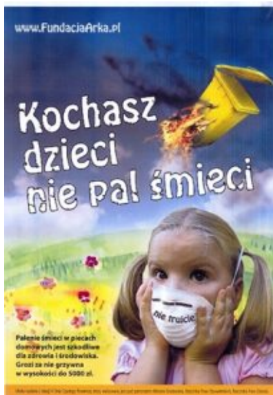
Plakat: „Verbrenne keinen Müll, wenn du Kinder liebst“.

Nur knapp 2 Prozent der Haushalte ohne Fernwärme heizen elektrisch. Auch hier sind die Kosten hoch. Um sie zu senken und die Abnehmer zu einem Umstieg auf Elektrowärme zu ermuntern, haben, auf Geheiß der Regierung, polnische Stromanbieter im Winter 2017 auf 2018 den Antismog-Tarif eingeführt. Zwischen 22 und 6 Uhr ist der Strom für diese Kunden um bis zu 90 Prozent billiger.