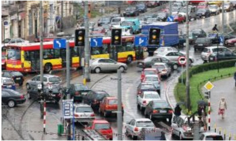
Autoverkehr in Warschau.

Smogverursacher in Warschau sind Auspuffabgase. Sie hängen über der Stadt, weil die Verwaltung der seit 2006 regierenden Stadtpräsidentin, und bis vor kurzem noch stellvertretenden Vorsitzenden der Tusk-Partei Bürgerplattform, Hanna Gronkiewicz-Waltz, massenweise Baugenehmigungen vergeben hat für Gebiete, die zuvor als Durchlüftungsschneisen dienten. Früher brachten Winde durch diese Schneisen frische Luft in die Stadt, jetzt prallen sie an der Hochhausbebauung ab.