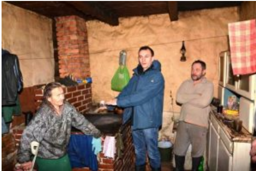
Energiearmut in Polen. Kein Warmwasser, kein Licht, keine Waschmaschine,

Menschen, oft drastisch ihren Energieverbrauch einschränken oder ganz und gar auf ihn verzichten. Ihre monatlichen Energieausgaben überstiegen oft bei Weitem 13 Prozent ihres Einkommens und damit die international geltende Grenze zur Energiearmut.