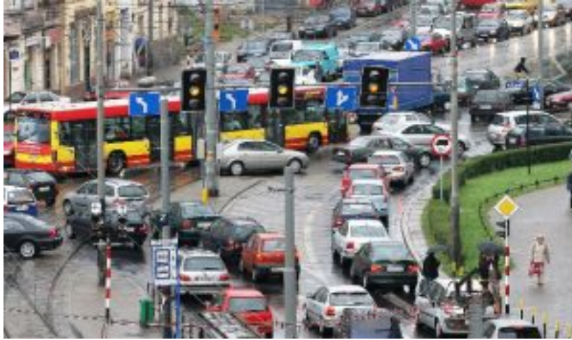
Autoverkehr in Warschau.

Smogverursacher in Warschau sind Auspuffabgase. Sie hängen über der Stadt, weil die Verwaltung der seit 2006 regierenden Stadtpräsidentin, und bis vor kurzem noch stellvertretenden Vorsitzenden der Tusk-Partei Bürgerplattform, Hanna Gronkiewicz-Waltz, massenweise Baugenehmigungen vergeben hat für Gebiete, die zuvor als Durchlüftungsschneisen dienten. Früher brachten Winde durch diese Schneisen frische Luft in die Stadt, jetzt prallen sie an der Hochhausbebauung ab.