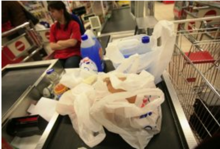
Das Antismog-Projekt soll überwiegend aus der Plastiktütenabgabe finanziert werden.

Allein für 2018 und 2019 sind hierfür 1,5 Milliarden Zloty (ca. 370 Mlo. Euro) vorgesehen. Finanzieren will Morawiecki das Antismog-Projekt überwiegend aus der Plastiktütenabgabe. Ab dem 1. Januar 2018 zahlen Kunden in Polen für Tüten, die sie im Supermarkt an der Kasse oder im Geschäft an der Theke bekommen, mindestens 0,2, maximal 1 Zloty, wovon der Staat 0,2 Zloty (ca. 0,04 Euro) an sogenannter Recyclingabgabe kassiert.