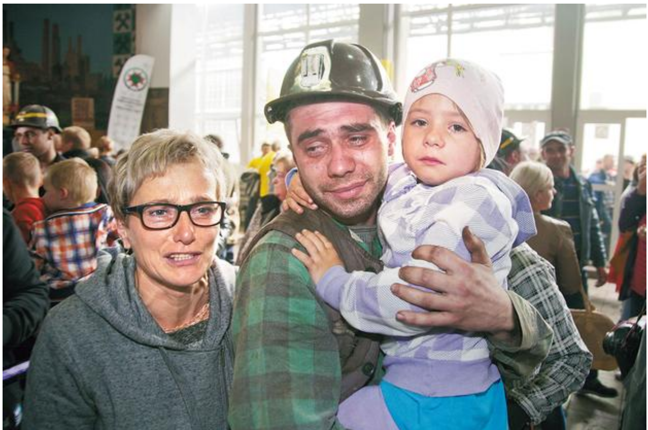
Bergarbeiterprotest in der Grube „Kazimierz Juliusz“ in Sosnowiec im Dombrowaer Kohlebecken, das im Norden an Oberschlesien grenzt. September 2014.

Was spricht aus der Sicht des Umweltschutzes für die Kohlevergasung?