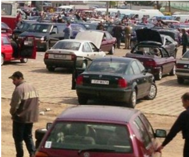
Alte Autos überwiegen. Neuere sind den meisten Polen zu teuer.

Smogverursacher in Warschau sind Auspuffabgase. Sie hängen über der Stadt, weil die Verwaltung der seit 2006 regierenden Stadtpräsidentin, und bis vor kurzem noch stellvertretenden Vorsitzenden der Tusk-Partei Bürgerplattform, Hanna Gronkiewicz-Waltz, massenweise Baugenehmigungen vergeben hat für Gebiete, die zuvor als Durchlüftungsschneisen dienten. Früher brachten Winde durch diese Schneisen frische Luft in die Stadt, jetzt prallen sie an der Hochhausbebauung ab.