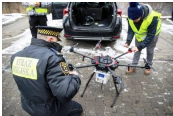
„Riechdrohne“ im Einsatz. Katowice im Winter 2017/2018.

„inhaliert“ sie den Rauch aus dem Schornstein und übermittelt die Daten an einen im Polizeiauto installierten Computer. Die Beamten verhängen umgehend Bußgelder.