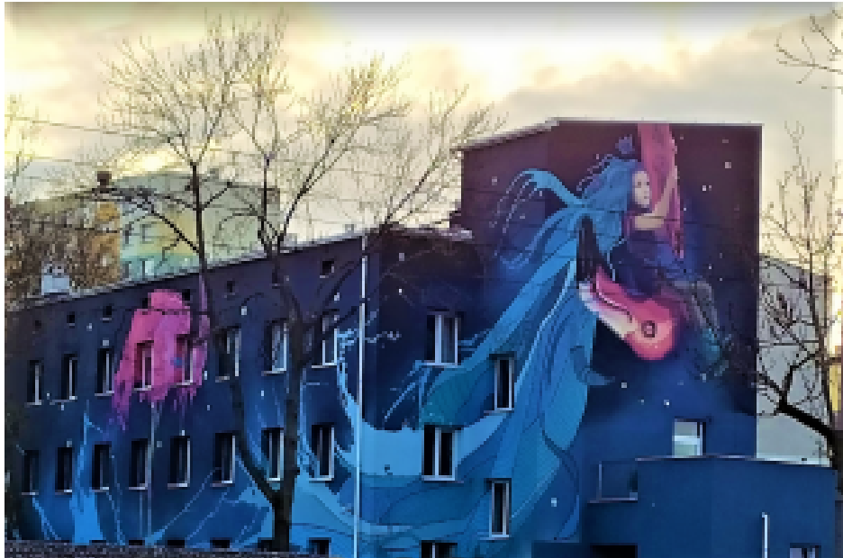
Haus der Gajusz-Stiftung in Łódź.

Wann beginnt die Hilfe des pränatalen Hospizes?