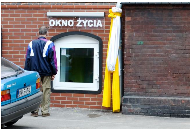
Fenster des Lebens in Wrocław.