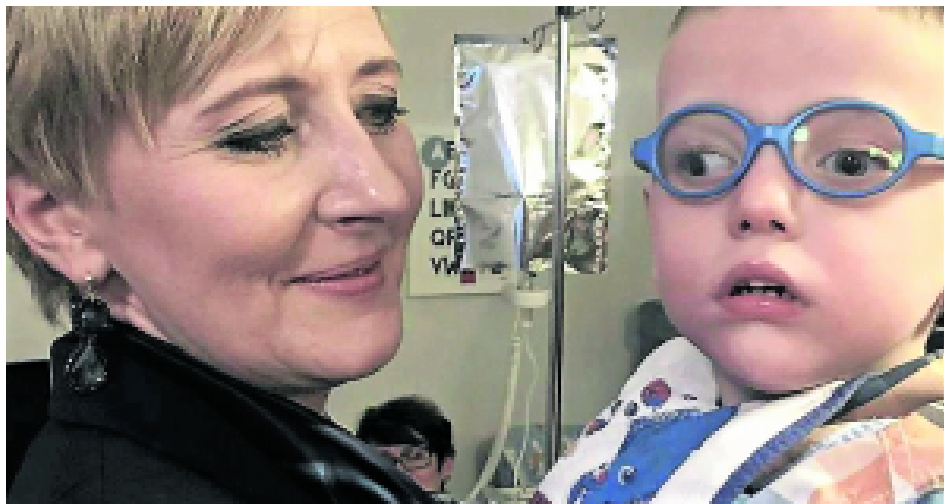
Polens First Lady Agata Kornhauser-Duda besuchte die Gajusz-Stiftung im November 2015.

Einmal haben wir Zwillinge in unserer Obhut gehabt. Der Junge kam gesund und kräftig zur Welt, seine Schwester ohne ein Händchen und ohne Nieren. Die Eltern wollten sie würdig verabschieden, und so ist es geschehen. Das Mädchen lebte acht Stunden lang. Als es starb, weinte der Bruder eine Stunde lang so heftig, dass man ihn auf keine Weise beruhigen konnte.