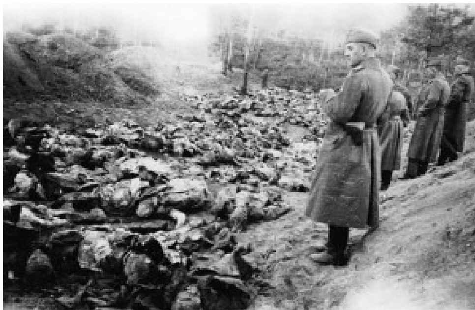
Deutsche an den geöffneten Massengräbern in Katyn 1943.

Unter dem Sammelbegriff „Katyn“ verbirgt sich also eine landesweite Mordaktion der Sowjets, durchgeführt gleichzeitig, an fünf verschiedenen Orten.