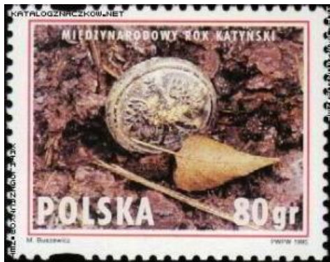
Katyń -Briefmarke der Polnischen Post von 1995.