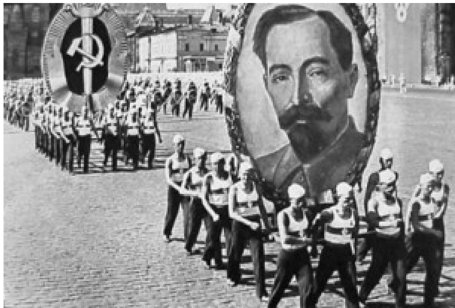
Dserschinski-Kult auf dem Roten Platz in Moskau. Ende der 20er Jahre.

Besonders hervorgehoben in Kunst und Propaganda, wurde die heroische Legende von den tadel- und selbstlosen Beamten der Staatssicherheitsorgane, die seit der Oktoberrevolution an der Heimatfront unermüdlich den „bürgerlichen Unrat“ ausmerzten: imperialistische Spione und Saboteure, samt ihren sowjetischen Helfern, den vom Aussterben geweihten „Überbleibseln“ des Kapitalismus: Banditen, Dieben, Spekulanten, korrupten Beamten.