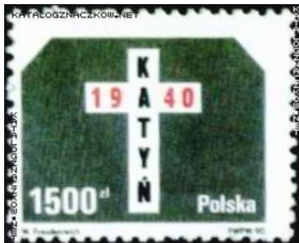
Erste polnische Katyn-Briefmarke von 1990.

Oder der einstige Gefängniswärter Pjotr Klimow. Er schilderte den Ablauf der Hinrichtungen. Der frühere NKWD-Wachsoldat Kiril Bordenkow wiederum, der allein und verwahrlost in einer völlig heruntergekommenen Hütte lebte, hatte den Dokumenten zufolge zu dem Erschießungskommando gehört, was er indes bei der Befragung bestritt. Nichtsdestotrotz erzählte er ausführlich davon und fertigte auch noch einen schriftlichen Bericht dazu an.