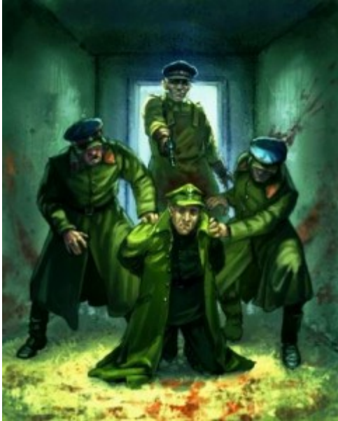
Das ahnungslose Opfer wird in den NKWD-Keller gebracht. Der Mörder wartet schon.

Kurz darauf begann die „Leerung“ der drei Lager. Im April und Mai 1940 wurden jeden Tag, aus jedem Lager, Gruppen von bis zu einhundert Polen in Eisenbahnwaggons für Gefangene abtransportiert, ohne zu wissen wohin und weswegen man sie wegbrachte.