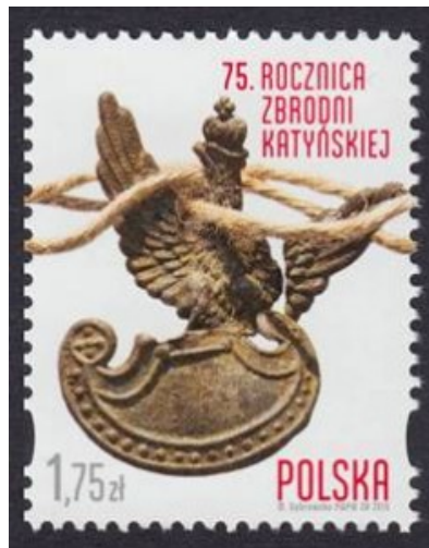
Katyń-Briefmarke der Polnischen Post von 2015.