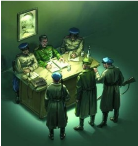
Der Ablauf des Mordens. Letzte Feststellung der Personalien.

September 1939 hatte der deutsche Angriff auf Polen und damit der Zweite Weltkrieg begonnen) nahmen die Sowjets etwa 25.000 polnische Offiziere und Unteroffiziere der Armee, der Polizei, des Grenzschutzes, des Zolls und des Strafvollzugs gefangen. Sie wurden in drei, einige hundert Kilometer voneinander entfernten, Kriegsgefangenenlagern untergebracht: Koselsk, Ostaschkow, Starobelsk.