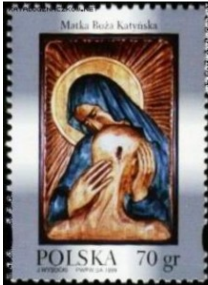
Katyń-Briefmarke der Polnischen Post von 1999.

Wirklichkeit ein gnadenloser, zehntausenfacher Massenmörder und Erfinder des sowjetischen Lagersystems, nach dem geschätzt gut sechstausend Städte, Dörfer, Straßen, Plätze, Industriebetriebe, LPGs, Schulen, Armeeeinheiten und Handelsschiffe in der Sowjetunion und später im ganzen Ostblock benannt wurden.