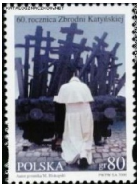
Katyń-Briefmarken der Polnischen Post von 2000.