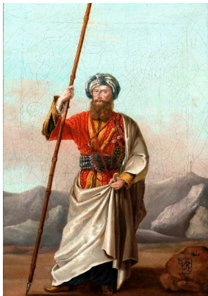
Graf Wacław Seweryn Rzewuski (1784-1831), in Arabien wie in Polen zu Hause, gründete 1817 das Gestüt in Janów Podlaski.

Der Zweite Weltkrieg vernichtete dann geradezu barbarisch mehr als einhundert Jahre harter Arbeit. Am 7. September 1939 begann die chaotische Evakuierung des Gestüts vor den herannahenden deutschen Truppen gen Osten. Zehn Tage später überfiel die Sowjetunion Polen. Auf überfüllten Straßen, unter dem Beschuss der Tiefflieger, ging es zurück nach Janów, um den Sowjets zu entkommen. Viele Pferde verendeten, rissen aus, wurden gestohlen, doch ein Teil des Bestandes konnte gerettet werden.