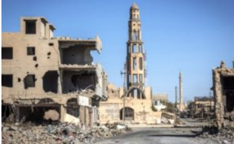
Das zerstörte Karakosch.