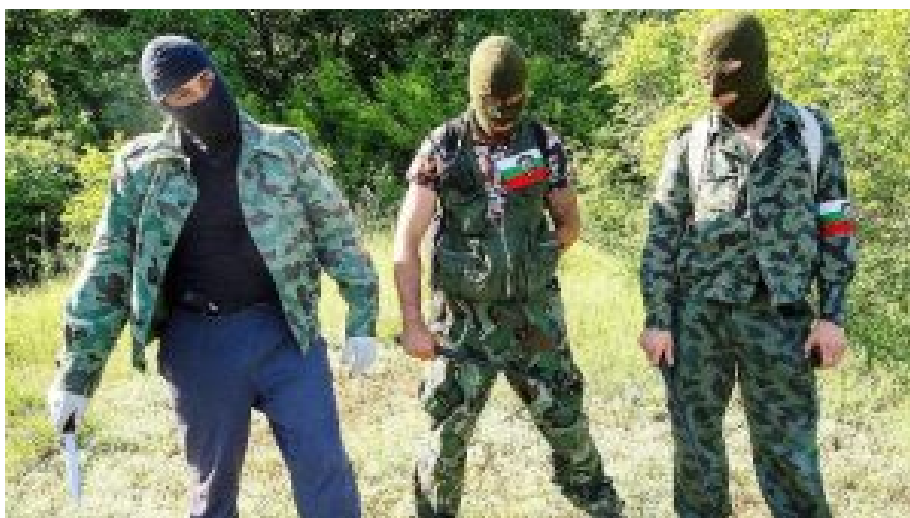
Bulgarische Schlägertrupps auf der Jagd nach Migranten.

Und die Bulgaren gucken weg, wenn Mafia-Banden an der Grenze Jagd auf Migranten machen. Die Kunde hat sich schnell verbreitet, dass man Bulgarien unbedingt meiden sollte. Komischerweise hat der Westen hier, bis auf einige Medienberichte, weggeschaut. Orban hingegen hat zu legalen, administrativen Maßnahmen gegriffen und handelte sich dadurch viel Ärger ein.