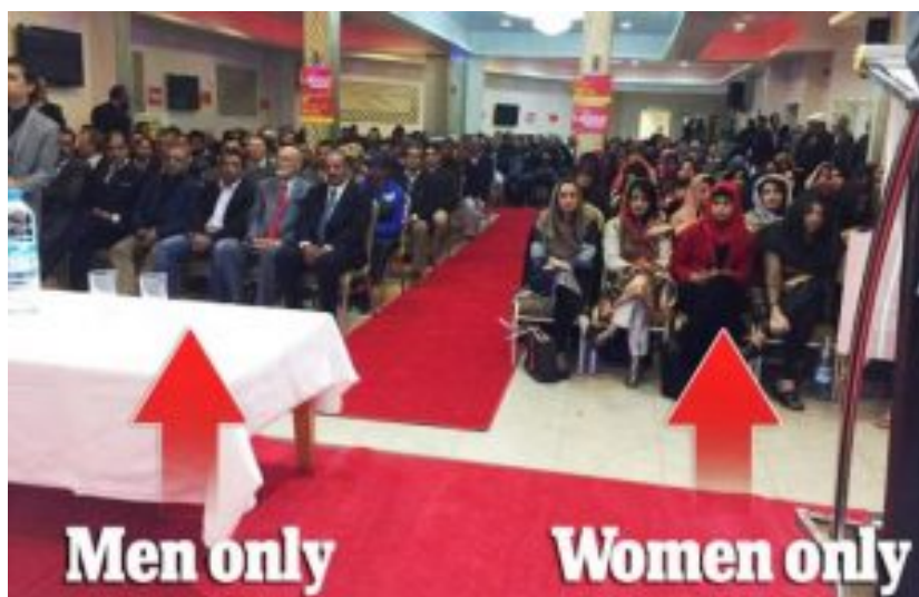
Labour-Wahlveranstaltung in Birmingham 2015.

Spöttelnd könnte man sagen, das Kalifat Malmö gibt es bereits. Man braucht ja nur die dort wohnenden Schweden zu fragen. Der Bürgermeister von London ist ein Moslem, der zwar unaufhörlich seinen Liberalismus zur Schau stellt, was man als eine Zwischenetappe betrachten kann.