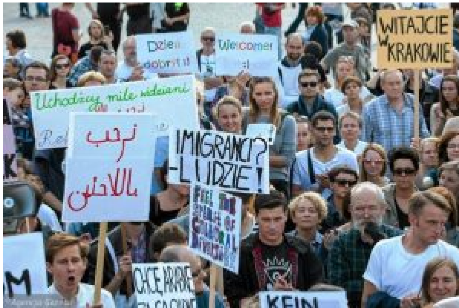
Refugees-Welcome-Kundgebung in Kraków, September 2015.

Großbritannien und Dänemark wurden aus diesem System von vorneherein ausgenommen. Brüssel weiß, dass die Regierungen dieser Länder auf ihre Wähler hören müssen. Es ist an der Zeit Brüssel daran zu gewöhnen, dass die jetzige polnische Regierung das auch tun muss.