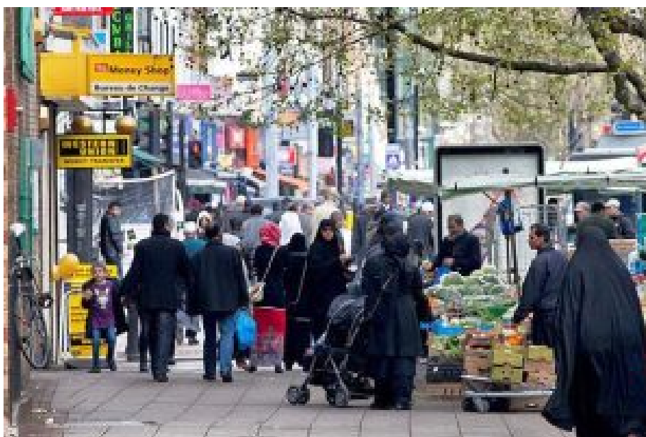
Straßenszene im Londoner Stadtteil Tower Hamlets.

Dort sind oft schon ihre Verwandten, existieren ganze Netzwerke, die sie auffangen: Moscheen, Koranschulen, Läden, kulturbedingte Dienstleistungen, eigene Stadtbezirke oder Straßenzüge, ausgedehnte Integrationsmaßnahmen, eine einigermaßen anständige Sozialhilfe.