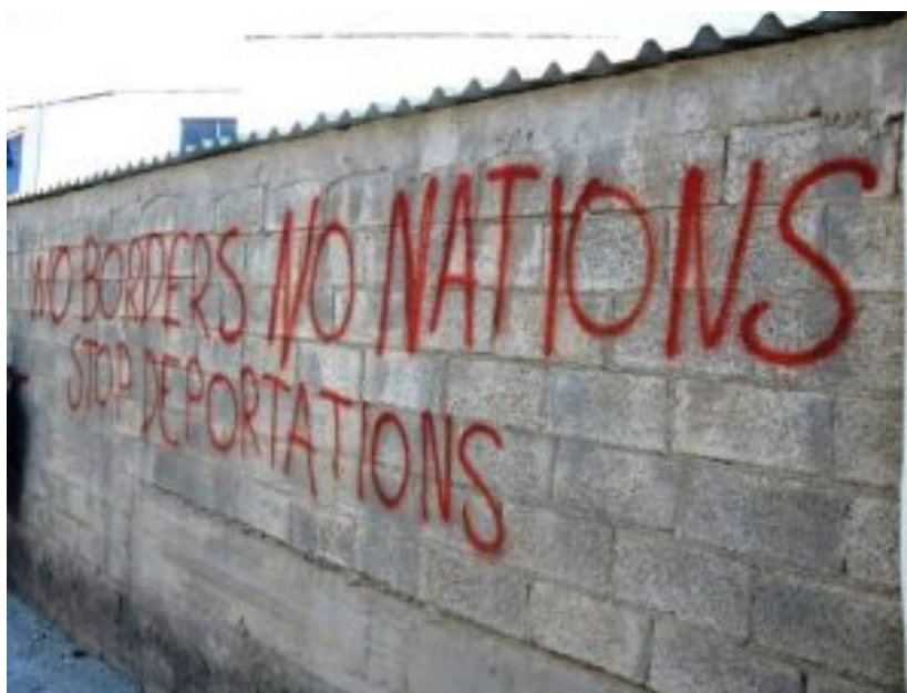
Verfechter der naiven Zuversicht. Parole „No borders, no nations, stop deportations“.

mus gleichsetzten oder unwissentlich damit verwechseln, könnte das Feuer unter ihrem Schmelztiegel auspusten.