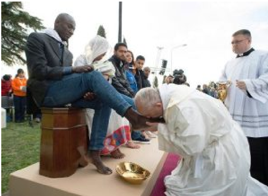
Papst Franziskus wäscht und küsst die Füße von Moslems, April 2016.

Papst Franziskus wusch und küsste die Füße von Moslems in der Gründonnerstagsmesse 2016. Er holte Moslemfamilien von der Insel Lesbos. Das sind eindrucksvolle christliche Gesten. Nur sollten solche Gesten an jene gerichtet sein, die sie im christlichen Sinne verstehen. Das ist genauso wie mit dem Hinhalten der anderen Wange. Halten wir sie einem Dummkopf hin, dann wird er dadurch noch dreister.