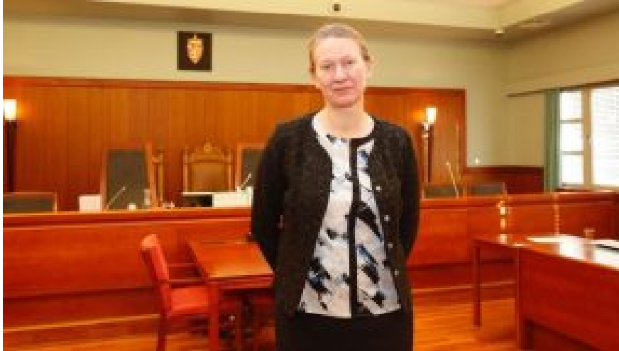
Erschöpft und glücklich. Gewonnen!

Und wie hat die katholische Kirche reagiert?