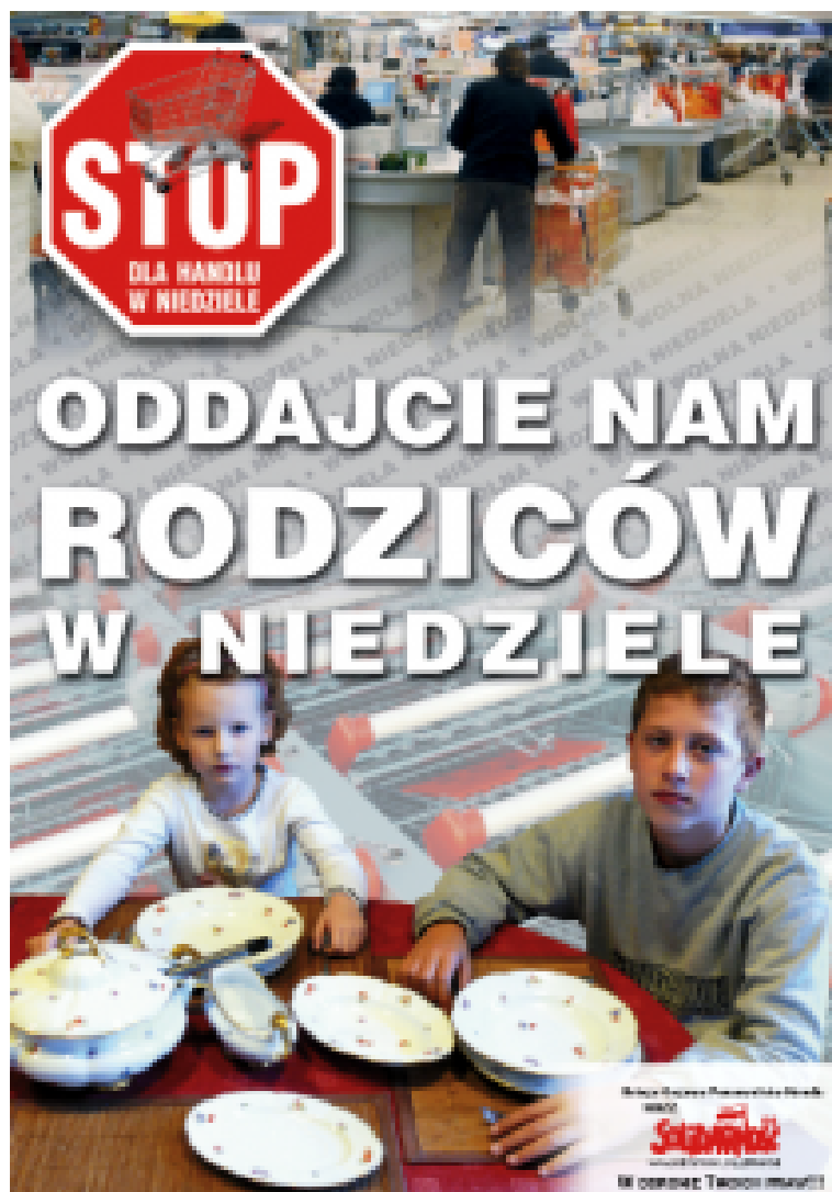
Solidarność-Plakat. „Gebt uns die Eltern am Sonntag zurück.“

Mit von der Partie waren auch die Verbände und Lobbyisten des Discounthandels mit ihren düstersten Vorhersagen. Bis zu 80.000 Angestellte im Handel würden arbeitslos, umgerechnet bis zu einer Milliarde Euro Steuereinnahmen könnten wegfallen, wenn die Läden nur noch an sechs Tagen geöffnet sein würden.