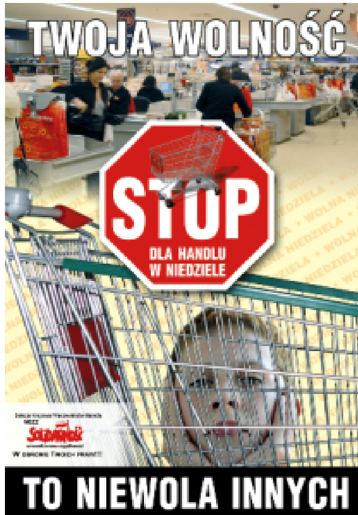
Solidarność-Plakat. „Deine Freiheit ist die Unfreiheit der anderen.“

Nach den Wahlen von 2015 versuchte die neue Regierungspartei die Umsetzung dieses Wahlversprechens erst einmal auf die lange Bank zu schieben. Sie befürchtete heftigen Widerstand, geschürt von der Opposition und deren Medien. Dabei hatte sie doch bereits den hitzigen Konflikt um die Justizreform am Hals. Hinzu kam die zornige Auseinandersetzung um einen besseren Schutz des ungeborenen Lebens, genauer, das Verbot kranke Kinder im Schoß der Mutter zu töten.