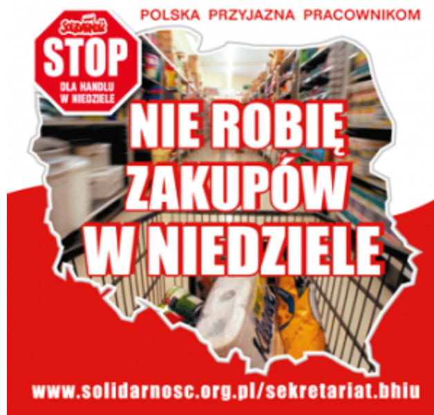
Solidarność-Plakat. „Ich kaufe nicht am Sonntag ein.“

Erst 2007 gelang es der ersten Regierung Jarosław Kaczyńskis, trotz Sturmfeuer der liberalen Medien und unzähliger Herolde der freien Marktwirtschaft, den Art. 151 §1 ins Arbeitsgesetzbuch zu bringen: „Die Arbeit an gesetzlichen Feiertagen im Handel ist nicht erlaubt“. Der politische Kampf um die zehn Worte war sehr heftig und Vorhersagen genauso düster, wie vor der Einführung des Verkaufsverbots an Sonntagen.