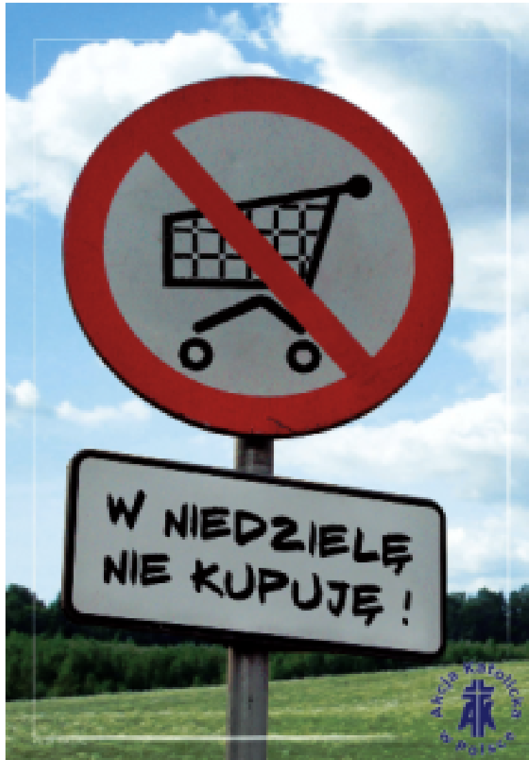
Solidarność-Plakat. „Am Sonntag kaufe ich nicht ein.“

Der damalige, wie es hieß, linke Staatspräsident, der Postkommunist Aleksander Kwaśniewski legte jedoch dagegen sein Veto ein, und das Wahlbündnis Solidarność besaß nicht die erforderliche 3/5 Mehrheit, um dieses Veto im Sejm niederzustimmen. Aldi, Lidl, Netto, die portugiesische Discounterkette Biedronka (Maikäfer), Praktiker, Rossmann u.a. konnten aufatmen.