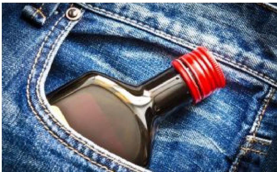
Äffchen. Leicht zu verstauen, fix getrunken.

Die Forscher haben knapp zweihundert Verkäufer befragt und mehr als zehntausend Kassenquittungen eingesehen. Ergebnis: drei viertel der Kunden kauften nur das Äffchen, beziehungsweise sie nehmen noch ein Getränk zum „Nachspülen“ und/oder eine Kleinigkeit (Schokoriegel, verpacktes Würstchen u. ä.) als Zubiss dazu.