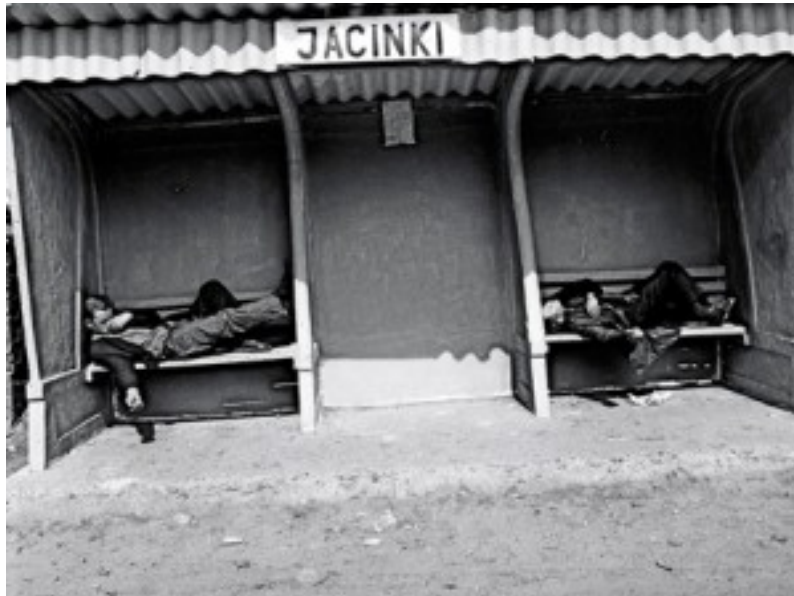
Kommunistische Tristesse der 70er Jahre. Man trank gegen die Melancholie, die Misslichkeiten des Alltags. „Wodkaleichen“ an der Haltestelle.

jedoch gilt in beiden klassischen Wodka-Ländern: Trinke nie ohne Zubiss, polnisch: zakąska (phonetisch: sakonska), russisch: sakuska. Dass in Warschau, wie im Westen, bereits „einfach so“ getrunken werden soll, erregt in Olszowo ungläubiges Kopfschütteln und echtes Mitgefühl. Hering und Aal schwimmen im polnischen Wodka besonders gern.