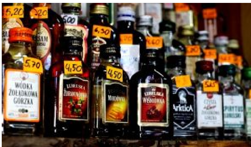
Äffchen. Eine Milliarde von ihnen pro Jahr werden in Polen getrunken.

So nennt der Volksmund die kleinen gläsernen Flachmänner mit 0,1 cl Füllvolumen. Wie in Russland, so heißt diese Menge Wodka auch in Polen seit eh und je „sto gram“ – „hundert Gramm“.