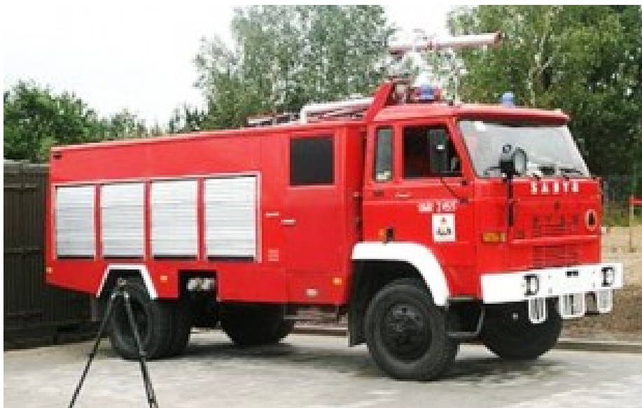
Vom Durstlöschen bezahlt. Löschfahrzeug der einheimischen Marke Star, Baujahr 1999.

Sofort, wie von Geisterhand, wird nachgefüllt. Alles sprudelt: der Alkohol, die Reden, die Großzügigkeit. Anrührende, ländliche Gastfreundschaft als Heimsuchung, keine Chance, den Fünfziggrammelch des Leidens bis zur bitteren Neige zu leeren. Noch ist der grausame Morgen danach weit.