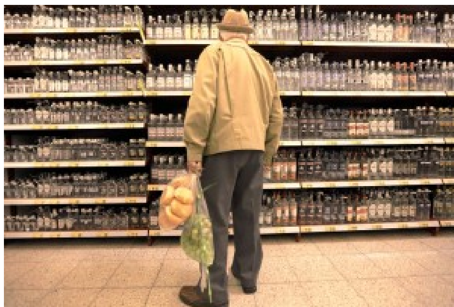
Viele Polen wenig Flaschen, viele Flaschen wenig Polen oder der Triumph der Marktwirtschaft.

Dutzende neuer Wodka-Marken füllen die Regale, verkauft wird in den Geschäften rund um die Uhr, aber gekauft wird weniger. Dreißig Halbliterflaschen im Jahr trinkt ein erwachsener Pole weg. Bier und Wein sind im Kommen. Von den gut zwölf Litern reinen Alkohols, die durchschnittlich im Jahr jeder mündige Einwohner des Landes verzehrt, entfallen 54 Prozent auf Bier, 39 Prozent auf Wodka und 7 Prozent auf Wein.