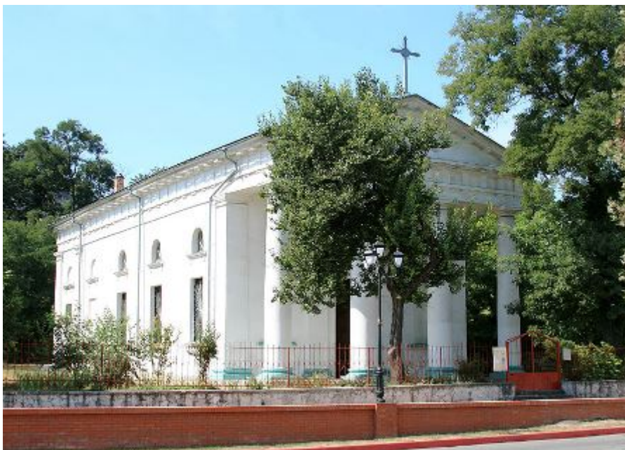
Wiederaufgebaute Kirche in Kertsch.

So gesehen sind wir hier Pioniere und Missionare im wahrsten Sinne des Wortes. Die ersten Priester kamen Anfang der 90er Jahre hierher und begaben sich auf die Suche nach den letzten Gläubigen. Die Anfänge sahen so aus, dass ein Pfarrer eine Kirchenruine vorfand und eine alte Frau, die letzte Katholikin weit und breit. Sie war es, die die Kirche vor der Einebnung gerettet hatte, als irgendwann in der Sowjetzeit die Bulldozer anrückten. Sie blieb so lange vor den Mauerresten stehen, bis das Abrisskommando sich sagte, das lohnt nicht und abzog. So geschehen in der Stadt Kertsch auf der Krim.