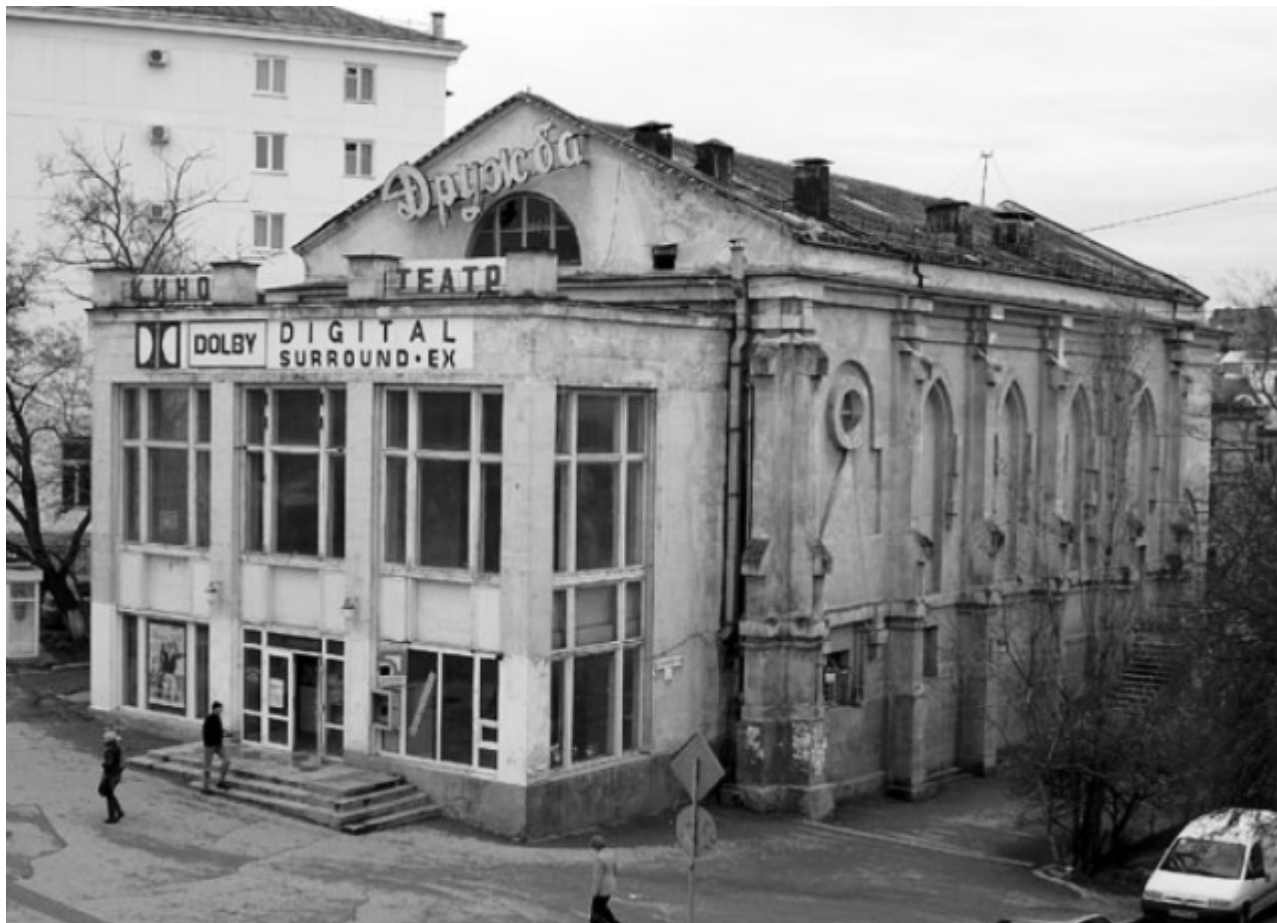
Ehemalige katholische Kirche in Sewastopol (auf der heute russisch besetzten Krim) zum Kino „Druschba“ – „Freundschaft“ umfunktioniert. Seit 2008 geschlossen. Rückgabe wird dennoch verweigert.

Es gibt in unserem Bistum sehr viele ehemalige katholische Kirchen. Vom Ende des 18. bis Anfang des 20. Jahrhunderts, also vor der Oktoberrevolution 1917, hatten die zaristischen Behörden in der Gegend sehr viele Polen und Deutsche angesiedelt. Odessa wurde Ende 1794 von den russischen Behörden gegründet. Bereits im Juli 1795 kamen die ersten etwa einhundert polnischen Familien dort an. Um 1914 lebten in Odessa immerhin bis zu 30.000 Polen. Sie bauten in der Stadt katholische Kapellen und Kirchen. Die schöne Kathedrale in Odessa haben die Sowjets in eine Sporthalle umgewandelt. Erst 1991 wurde sie zurückgegeben und wieder hergerichtet. Die St. Klemens Kirche war das größte Gotteshaus östlich von Polen, es hatte zweitausend Sitzplätze. Den dortigen Probst, Pfarrer Józef Szejner haben die Sowjets bereits im Mai 1922 ermordet, das Gebäude 1933 in die Luft gesprengt. Viele Kirchengebäude haben als Ruinen überdauert. Sie zurückzubekommen und wiederaufzubauen ist eine Aufgabe für Generationen.