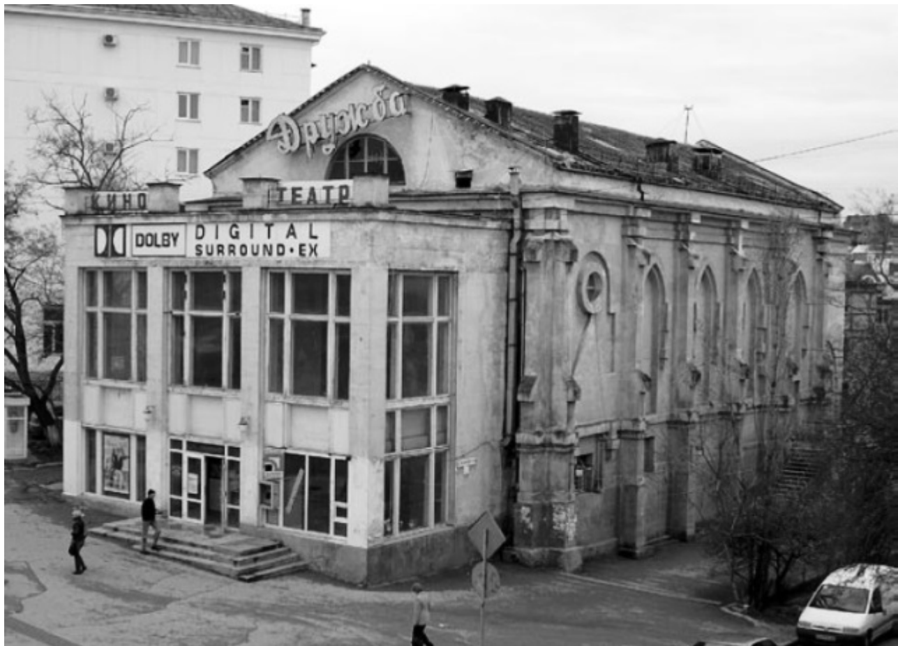
Ehemalige katholische Kirche in Sewastopol (auf der heute russisch besetzten Krim) zum Kino „Druschba“ – „Freundschaft“ umfunktioniert. Seit 2008 geschlossen. Rückgabe wird dennoch verweigert.

Es gibt in unserem Bistum sehr viele ehemalige katholische Kirchen. Vom Ende des 18. bis Anfang des 20. Jahrhunderts, also vor der Oktoberrevolution 1917, hatten die zaristischen Behörden in der Gegend sehr viele Polen und Deutsche angesiedelt. Odessa wurde Ende 1794 von den russischen Behörden gegründet. Bereits im Juli 1795 kamen die ersten etwa einhundert polnischen Familien dort an. Um 1914 lebten in Odessa immerhin bis zu 30.000 Polen. Sie bauten in der Stadt katholische Kapellen und Kirchen. Die schöne Kathedrale in Odessa haben die Sowjets in eine Sporthalle umgewandelt. Erst 1991 wurde sie zurückgegeben und wieder hergerichtet. Die St. Klemens Kirche war das größte Gotteshaus östlich von Polen, es hatte zweitausend Sitzplätze. Den dortigen Probst, Pfarrer Józef Szejner haben die Sowjets bereits im Mai 1922 ermordet, das Gebäude 1933 in die Luft gesprengt. Viele Kirchengebäude haben als Ruinen überdauert. Sie zurückzubekommen und wiederaufzubauen ist eine Aufgabe für Generationen.