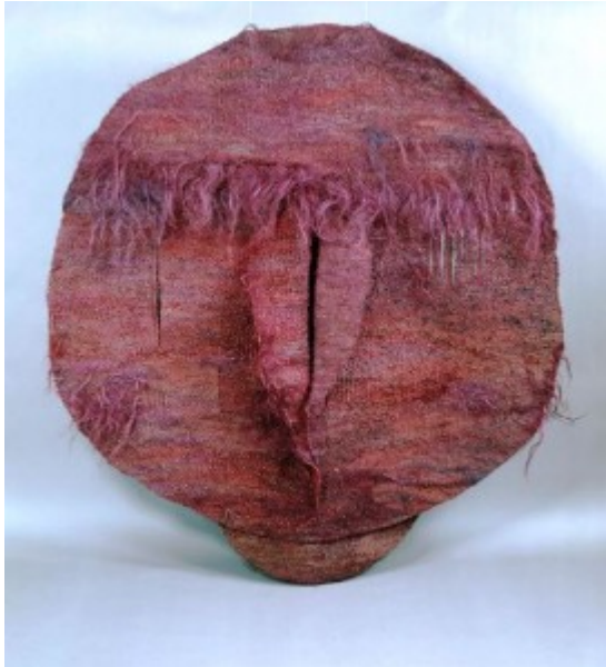
Abakan violett 1969.

„Abakane“ waren 1962 die Sensation der Internationalen Biennale der Tapiserie in Lausanne und 1965 der Biennale in Sao Paulo. Das war Magdalena Abakanowicz's Durchbruch in die Weltliga der bildenden Kunst. Ebenfalls 1965 wurde sie Professorin an der Kunsthochschule in Poznań und lehrte dort bis 1990.