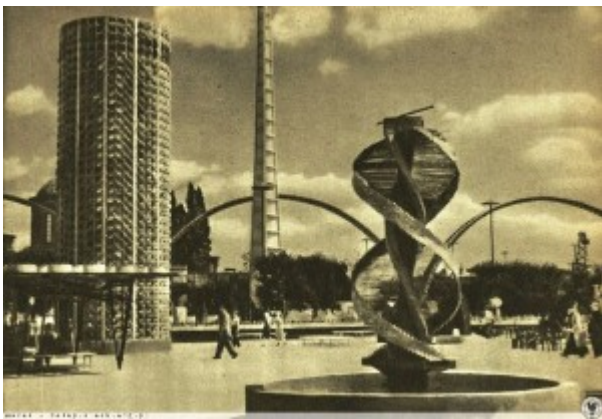
Avantgardistische Installationen auf der „Ausstellung der Wiedergewonnenen Gebiete“, Wrocław/Breslau 1948.

Im Jahr 1948 führte sie ein Schulausflug nach Wrocław/Breslau, zur „Ausstellung der Wiedergewonnenen Gebiete“, wie die ehemaligen deutschen Ostgebiete nun genannt wurden.