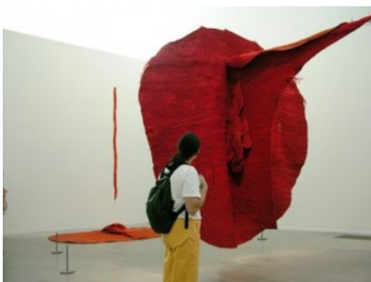
Abakan rot 1972.

Warschau und Poznań blieben die Hauptorte ihres Schaffens. Ihre herausragende Position in der internationalen Kunstszene behauptete sie allerdings, indem sie 1980 den polnischen Pavillon auf der Biennale in Venedig gestaltete und 1984 eine Gastprofessur an der University of California in Los Angeles antrat.