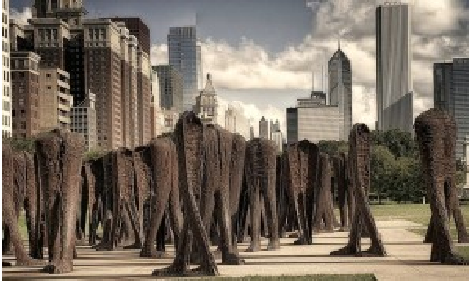
Magdalena Abakanowicz 106 „Kopflöse“ am Grant Park in Chicago 2001.

terialien wechselte, so treu blieb sie ihrer Suche nach der Individualität in der Masse. „Die Masse ist an und für sich unselbständig, aber sie ist bereit auf Kommando zu treten, zu zerstören oder zu verehren. Die Masse ist eine kopflose Kreatur, die mich immer aufs Neue inspiriert“, so begründete sie ihre Fixierung auf Figurengruppen.