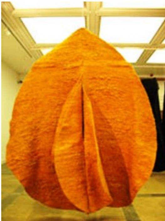
Abakan orange 1971.

roshima: Ihre Werke sind an vielen Orten der Welt zu finden. Eine ihrer größten textilen Arbeiten misst rund zweihundert Quadratmeter, der »Bois le Duc«, geschaffen für das Gebäude der Provinzialverwaltung von Nordbrabant in Hertogenbosch in den Niederlanden.