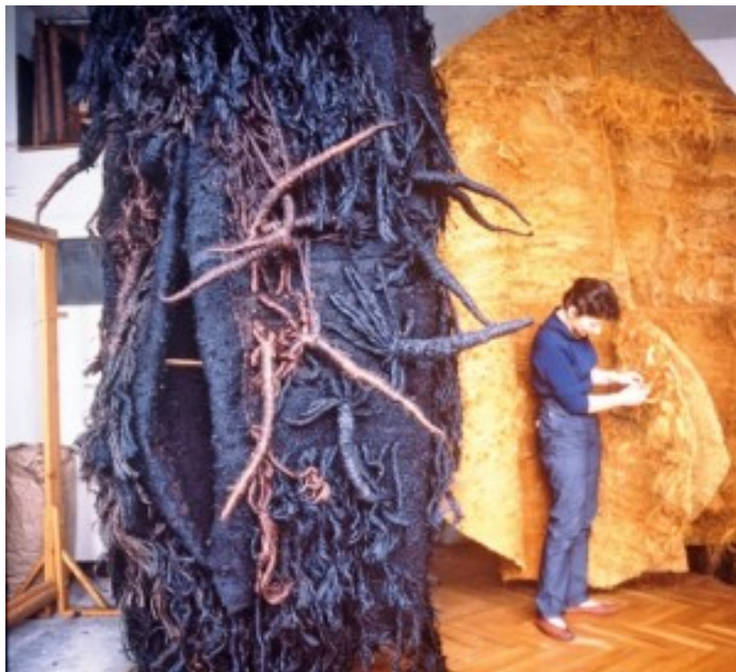
Bei der Arbeit 1971

Wie sollte man diese neue Form in der bildenden Kunst nennen? „Weiche Skulptur“? Das klang unseriös. „Strukturelles Tuch“ in Anlehnung an die „strukturelle Malerei“? Das wiederum klang sehr abgehoben. In der polnischen Presse der 60er Jahre wurde ein Wettbewerb ausgeschrieben. Gewonnen hat die Wortschöpfung „Abakane“, die sich seither weltweit eingebürgert hat.