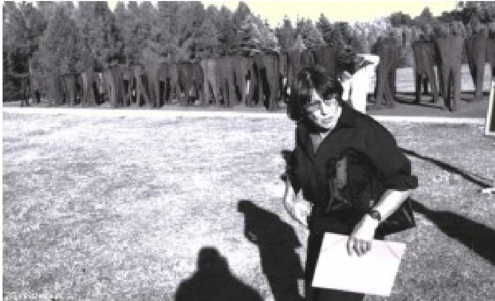
Einer der letzten ganz großen Auftritte. Magdalena Abakanowicz kurz vor der Eröffnung ihrer Ausstellung auf dem Gelände der Warschauer Zitadelle im Jahr 2002.

In den 90er Jahren und später wurde ihr Schaffen zunehmend als „klassisch“, ja sogar „traditionell“ angesehen. Andere Kunstrichtungen galten in dieser Zeit als „progressiver“. Ihre Metaphern vom Individuum und von der Menschenmasse passten angeblich nicht mehr in die nachkommunistische Zeit des ausschweifenden Individualismus, der Vereinsamung und Abkapselung vor dem Smartphone oder Computer.