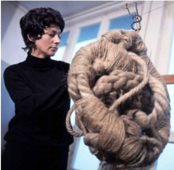
Schnüre, Taue, Stricke verwandeln sich zu Skulpturen. Magdalena Abakanowicz Anfang der 70er Jahre.

Wie sollte man diese neue Form in der bildenden Kunst nennen? „Weiche Skulptur“? Das klang unseriös. „Strukturelles Tuch“ in Anlehnung an die „strukturelle Malerei“? Das wiederum klang sehr abgehoben. In der polnischen Presse der 60er Jahre wurde ein Wettbewerb ausgeschrieben. Gewonnen hat die Wortschöpfung „Abakane“, die sich seither weltweit eingebürgert hat.