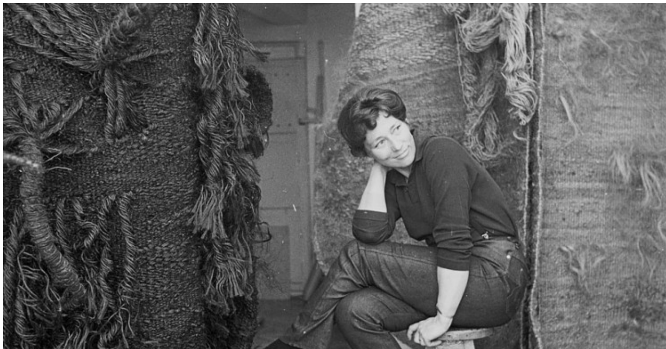
Endlich ein eigenes Atelier. Magdalena Abakanowicz Anfang der 60er Jahre.

Sie malte damals abstrakte Kompositionen mit Fantasieblumen, Fischen, Gewächsen, in leuchtenden Farben, arbeitete mit breiten Pinseln auf großen Papierbögen oder zusammengenähten Leinenlaken, die sie nicht auf Rahmen spannte sondern frei hängen ließ. Mit diesen Gouache--Bildern erfüllte sie sich den lange gehegten Traum moderne Kunst im großen Maßstab zu gestalten.