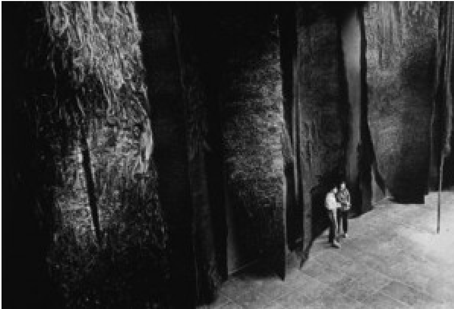
Abakanowiczs größte Textilarbeit »Bois le Duc«, in Hertogenbosch in den Niederlanden.

„Meine Formen sind im Grunde meine nächstfolgenden Häute, die ich ablege um eine weitere Etappe auf meinem künstlerischen Weg zu markieren. Am interessantesten ist es, sich Techniken und Formen zu bedienen, die man noch nicht kennt.“