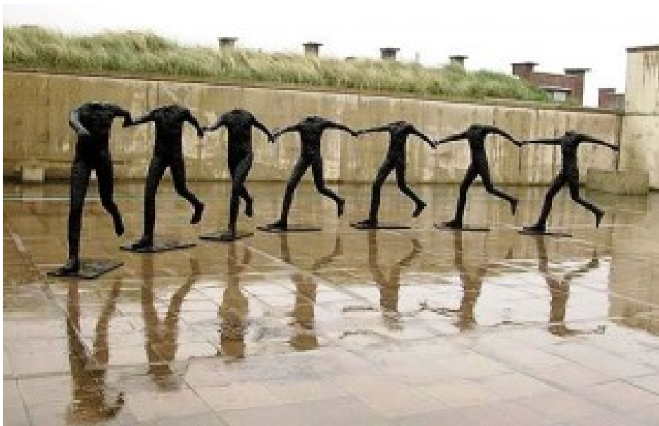
Magdalena Abakanowicz „Tanzende“ 1978.

„Meine Formen sind im Grunde meine nächstfolgenden Häute, die ich ablege um eine weitere Etappe auf meinem künstlerischen Weg zu markieren. Am interessantesten ist es, sich Techniken und Formen zu bedienen, die man noch nicht kennt.“