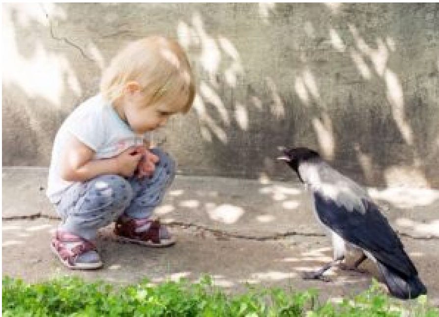
Die Ornithologen sagen: abwarten.