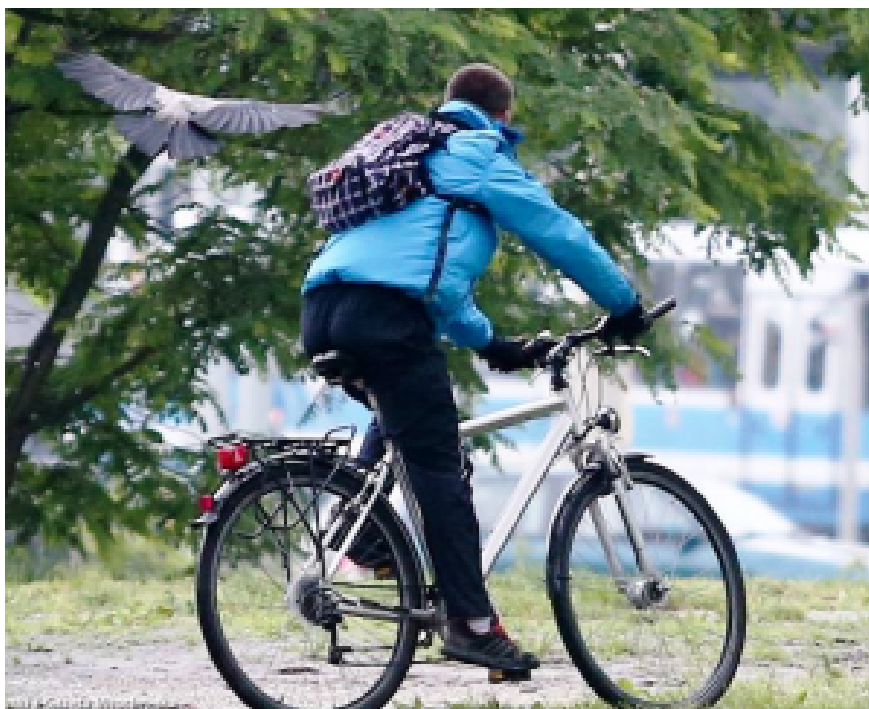
Krähen-Attacke in Wrocław.

Krähen vertilgen die Nestlinge anderer Vögel. Um das zu belegen, bauen die Ornithologen künstliche Nester, in die sie Wachteleier legen und ein Ei aus Plastilin. An ihm kann man ablesen, wer der Räuber war: ein Steinmarder, eine Katze oder ein Rabenvogel. Nicht selten greifen Eltern und Krähen die Nester anderer Vögel an, ausschließlich um sie zu verwüsten. Die Nestlinge werden tot gepickt und nach draußen geworfen, die Nester unbrauchbar gemacht.