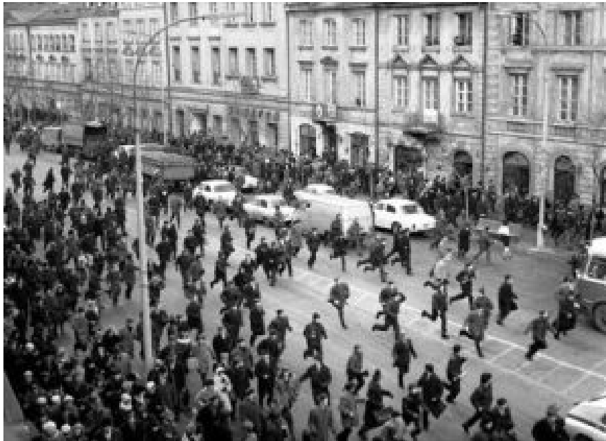
Studentenunruhen in Warschau im März 1968.

dem, was ihr als Sozialismus vorschwebt, diktatorischer Maßnahmen bedient? Dies waren in jener Zeit sehr heikle Fragen.