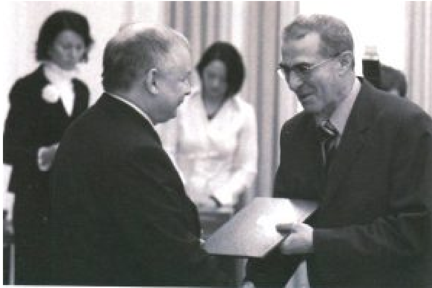
Prof. Karol Modzelewski nimmt 2006 eine hohe Geldprämie und ein Diplom in staatlicher Anerkennung seiner wissenschaftlichen Leistungen vom damaligen Ministerpräsidenten Jarosław Kaczyński entgegen.

Jedenfalls war jeder Versuch, Stasi-Zuträger und ihre Untaten offenzulegen, in seinen Augen ein Attentat auf den politischen Anstand, die Menschenrechte und die Toleranz. Die Herabsetzung der hohen Renten der Stasibeamten (gut 25 Jahre nach dem Ende des Kommunismus) auf das polnische Normalmaß, auf dem sich seit eh und je die Renten ihrer Opfer befanden, empfand er als schreiendes Unrecht. Genauso bewertete er die Idee, ehemalige Parteifunktionäre im demokratischen Polen politisch zu isolieren, keine gemeinsame Sache mit ihnen zu machen. So etwas konnten nur „polnische Antikommunisten mit bolschewistischen Fratzen“ fordern.