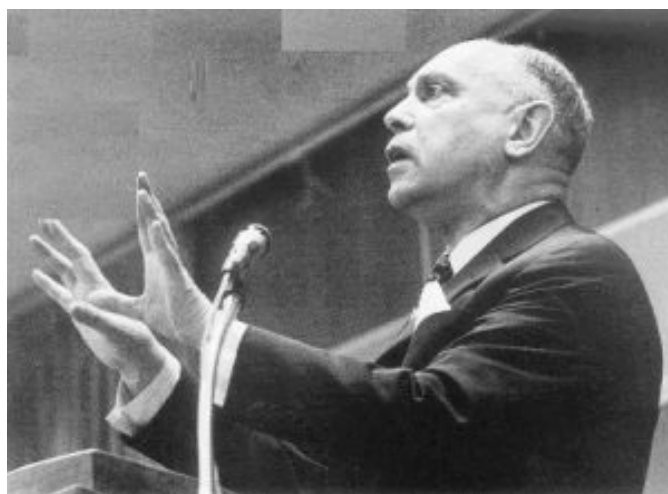
Philosoph Adam Schaff.

Die Philosophen Leszek Kołakowski (1927-2009) und Krzysztof Pomian (geb. 1934) wurden aus der Partei entfernt, weil sie eine Gedenkveranstaltung zum 10. Jahrestag des polnischen Oktober 1956 an der Uni organisierten. Das rief Proteste hervor. Eine heftige Diskussion entfachte das 1965 erschienene Buch „Marxismus und das menschliche Individuum“ des Philosophen Adam Schaff (1913-2006).