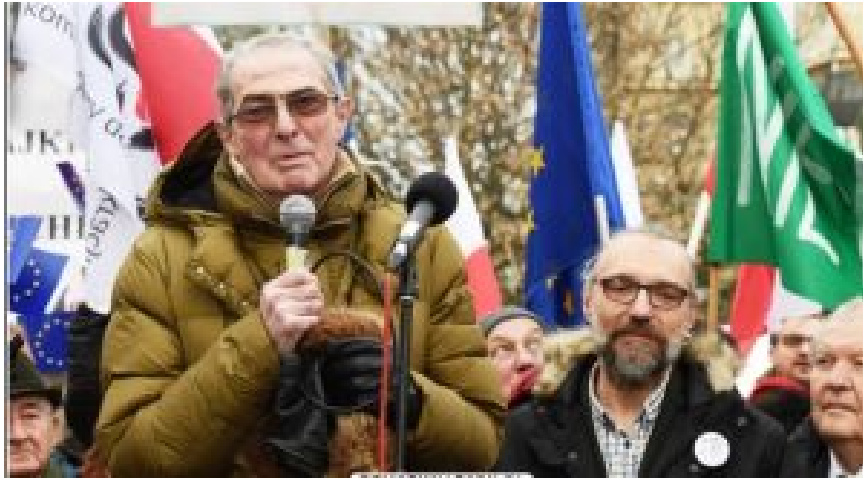
Karol Modzelewski spricht bei einer Demonstration gegen die nationalkonservative Regierung im Frühjahr 2016.

Damit haben sie einen tiefen Graben quer durch die polnische Politik gezogen. Von ihrer Warte aus gesehen sind diejenigen, die solche Kompromisse ablehnen, schlicht Populisten und Feinde der Demokratie.