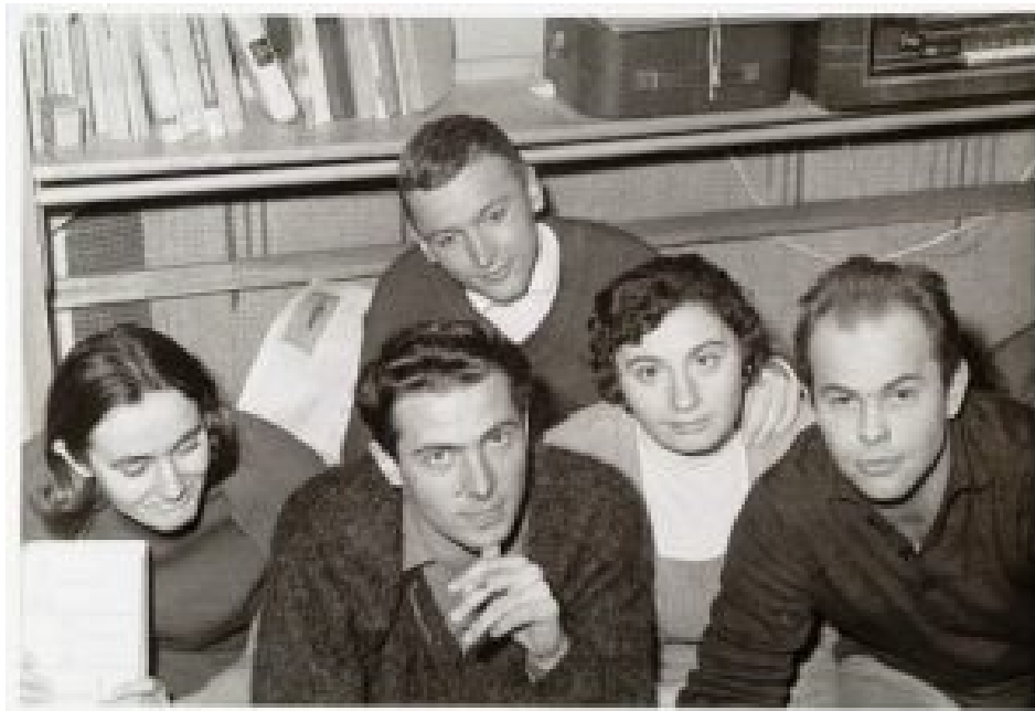
Karol Modzelewski (M.) und Jacek Kuroń (vorne r. im Bild) 1964.

Nach dem Verbot des Politischen Klubs an der Warschauer Universität protestierten Modzelewski und Kuroń in einer „Denkschrift“ dagegen. Sie enthielt zugleich eine Beschreibung der Zustände in Polen, aus der hervorging, dass eine Parteibürokratie das Land regiert und die Arbeit- erklasse ausbeutet. Beide schloss man daraufhin im November 1964 aus der kommunistischen Partei aus. Modzelewski flog zudem von der Universität.