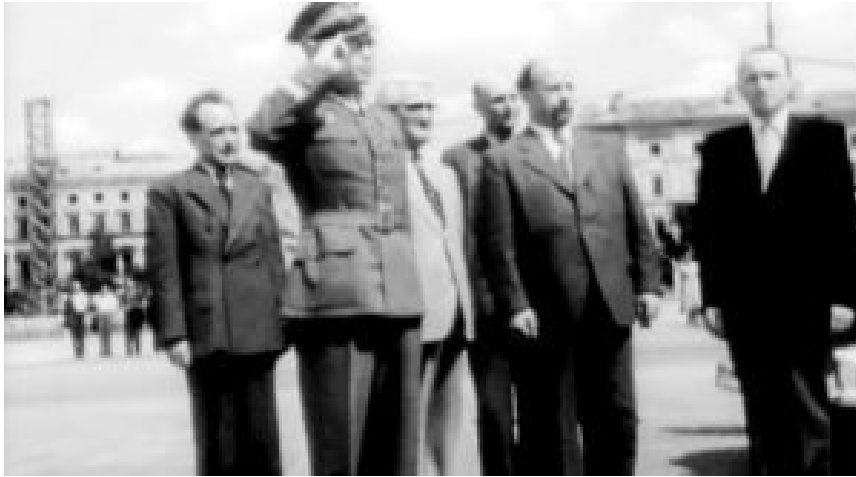
Stiefvater und Außenminister Zygmunt Modzelewski (l.) beim ersten Besuch Walter Ulbrichts in Warschau im Oktober 1948.

Dem „roten Prinzen“ Karol fehlte es an nichts und genau das war ihm peinlich. Der glühende Jungkommunist glaubte an die Idee, doch die stand in einem krassen Widerspruch zu seiner persönlichen Situation.