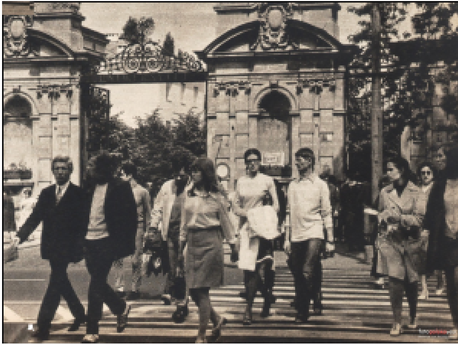
Warschauer Universität in den sechziger Jahren.

Der gut einhundert Seiten umfassende „Brief“, im schwer zugänglichen marxistischen Jargon verfasst, war ihr Protest gegen den Parteiausschluss. Zugleich stellte er eine niederschmetternde Diagnose der Parteiherrschaft und ihrer Folgen dar und beinhaltete ein ganzheitliches Konzept der Errichtung einer Arbeiterdemokratie in Polen.