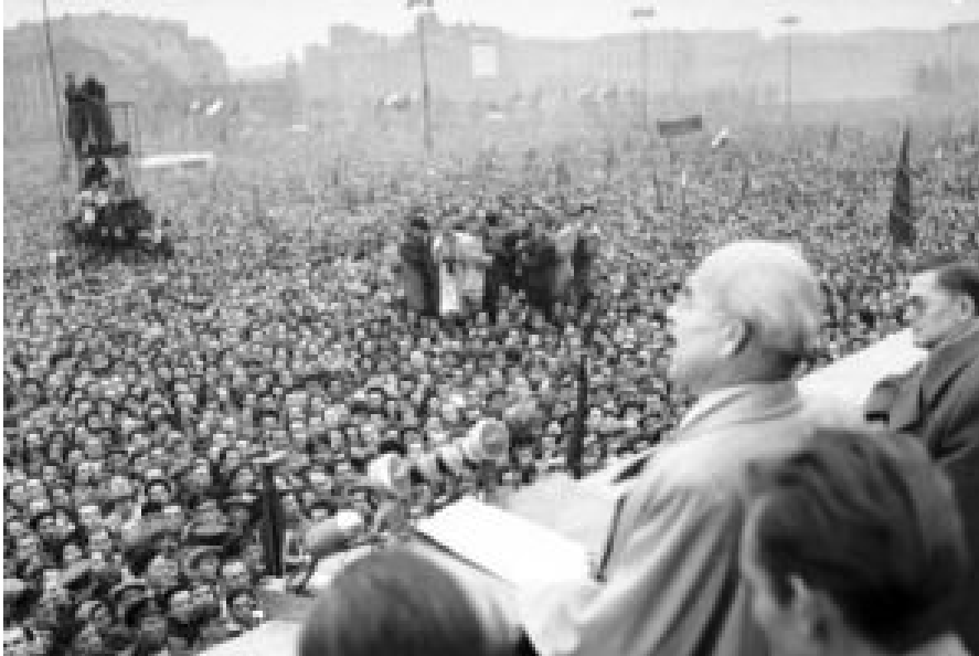
Hoffnungsträger Władysław Gomułka bei der Kundgebung vor dem Warschauer Kulturpalast am 24. Oktober 1956. Polen lag ihm zu Füßen, vierzehn Jahre später jagten ihn Arbeiterproteste davon.

Gerüchte, sowjetische Truppen hätten ihre Stützpunkte in Westpolen verlassen und bewegten sich auf Warschau zu, erwiesen sich als wahr. Während in Budapest bereits der Aufstand gegen die Sowjets in vollem Gange war, schickten sich Teile der Armee und die Warschauer Arbeiterschaft an, die Stadt zu verteidigen. Im letzten Augenblick gelang es Gomułka Chruschtschow umzustimmen. Es sollte kein Blutvergießen geben. Die russischen Panzer kehrten um, Chruschtschow flog nach Hause. Hunderttausende jubelten Gomułka bei einer Kundgebung vor dem Warschauer Kulturpalast zu.