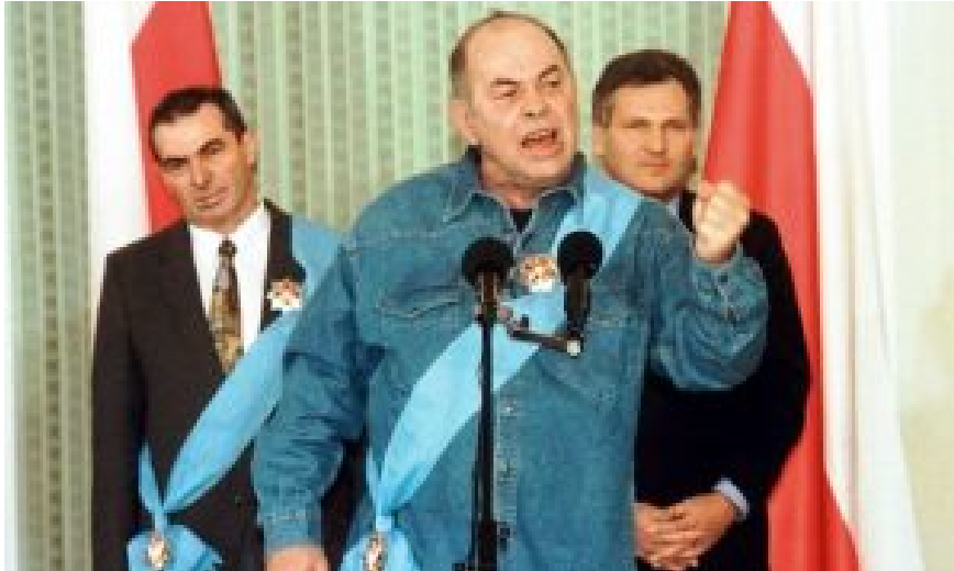
Karol Modzelewski und Jacek Kuroń nach der Auszeichnung mit dem Orden des Weißen Adlers durch den Postkommunistischen Staatspräsidenten Aleksander Kwaśniewski (r.) im März 1998.

war verbittert. „Ich entledge mich meiner Solidarność-Biografie nicht. Wenn ich jedoch das Finale betrachte, das bekanntlich ein Werk krönt, glaube ich Grund zu haben, mich zu schämen“, schrieb er 1993 in seinem viel beachteten Essay „Wohin vom Kommunismus aus?“ (deutsche Ausgabe 1996).