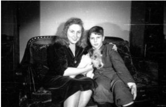
Karol Modzelewski mit seiner Mutter in Moskau 1947.