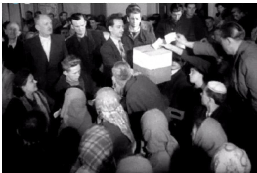
Wahlen zum Arbeiterrat in einer Ziegeleifabrik in Zielonka

Die wichtigste Losung und Hoffnung auf eine Demokratisierung des Systems in jener Zeit lautete „Arbeiterselbstverwaltung“. Wie in dem bis vor Kurzem noch verfemten, abtrünnigen Jugoslawien Titos sollten auch in Polen die Belegschaften den Direktor wählen, über Produktion, Löhne und Investitionen bestimmen.