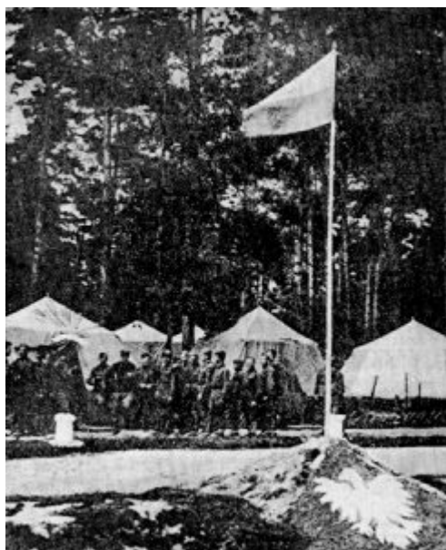
Formierungslager der 1. Polnischen Infanteriedivision in Seltzy 1943.

Seite der Sowjets in Polen einmarschieren sollte. Modzelewski wurde Hauptmann und Politoffizier.