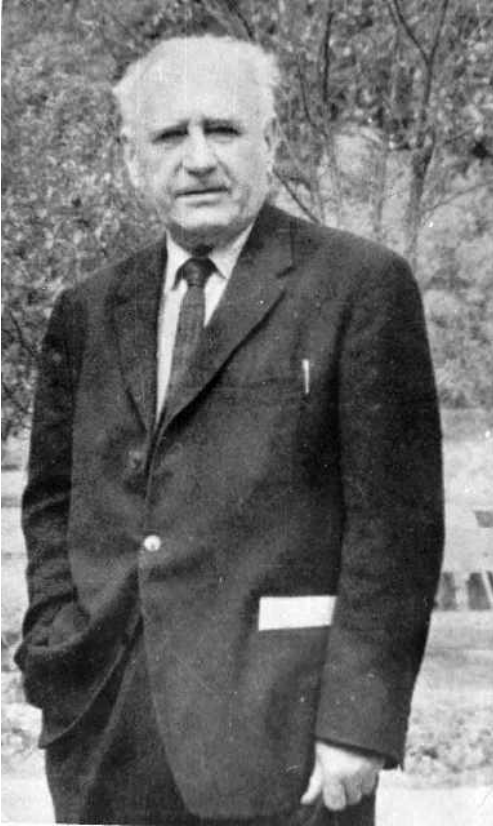
Tymienieckas Vorbild: der herausragende polnische Philosoph Roman Ingarden (1893 – 1970).

Anna Teresa Tymieniecka war eine polnisch-amerikanische Philosophin. Sie entstammte einer vermögenden polnisch-französischen Adelsfamilie, studierte nach 1945 Philosophie an der Jagiellonen-Universität in Kraków. Im Zuge der stalinistischen Gleichschaltung im kommunistischen Polen durfte ab 1948 nur noch marxistische Philosophie unterrichtet werden. Ihr großes Vorbild, der herausragende polnische Philosoph Roman Ingarden bekam, zusammen mit vielen anderen Kollegen, Lehrverbot. Tymieniecka durfte, aufgrund ihrer zweiten französischen Staatsangehörigkeit, das inzwischen streng hinter dem Eisernen Vorhang abgeschottete Polen verlassen, ging zuerst nach Belgien, dann in die Schweiz, schließlich in die USA.