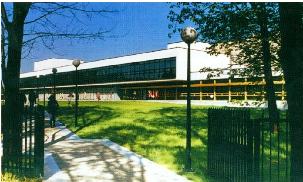
Polnische Nationalbibliothek in Warschau.