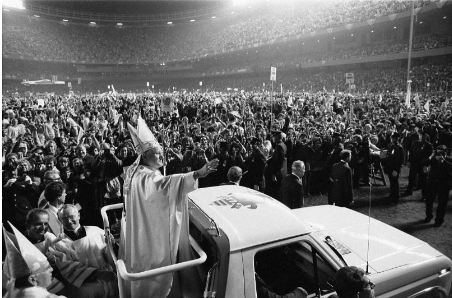
Papstbesuch in New York 1979. Die geschäftstüchtige Philosophin drängte darauf umgehend ihre englische Fassung seines Buches „Person und Tat“ herauszugeben. Das für philosophische Laien schwer zugängliche Werk würde, während der anfänglichen Begeisterung nach der sensationellen Wahl des polnischen Papstes, sicherlich zwar kaum Leser aber auf jeden Fall sehr viele Käufer finden.

genüber dem amerikanischen Journalisten und Papst-Biographen Carl Bernstein tatsächlich zu der Äußerung: „Ich sehe es so, dass das Pontifikat Wojtylas nach meinen Ideen geführt wird“. Der Papst, dem ihr philosophisches Wissen und ihre Redegewandtheit imponierten, wusste ihr jedoch sehr wohl die Grenzen aufzuzeigen.