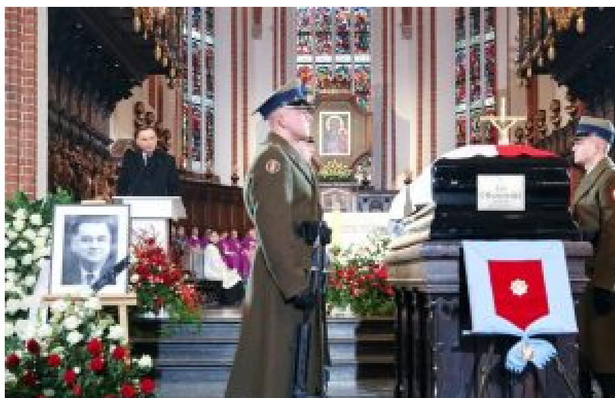
Beisetzungsfeierlichkeiten Jan Olszewskis. Staatspräsident Andrzej Duda hielt die Trauerrede in der Warschauer Kathedrale. Zehntausende gaben Olszewski das letzte Geleit.

Bescheiden, zurückhaltend, aber im Kern unverbrüchlich in seiner Haltung lebte er weitgehend zurückgezogen und in den letzten Lebensjahren, schwer krank, in Warschau. Zehntausende, die seine Auffassung vom Anstand in der Politik teilten, gaben ihm das letzte Geleit.