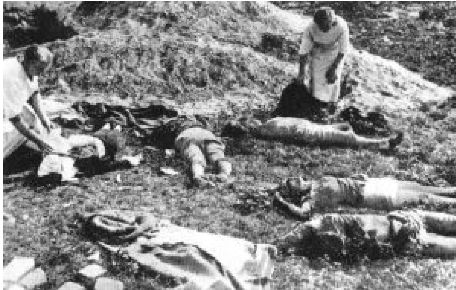
Tote Zivilisten nach einem deutschen Luftangriff auf das belagerte Warschau 1939.

Im vierten Besatzungsjahr, 1942, gelangte der Zwölfjährige durch vertrauliche Verbindungen in die Grauen Reihen (Szare Szeregi). So nannte sich der Polnische Pfadfinderverband im Untergrund. Konspirativ, ohne Uniformen, verknüpfte er die normale Ausbildung mit der sogenannten kleinen Sabotage. Parolenmalen auf Mauern und Zäunen („Deutschland kaputt!“). Nägelstreuungen auf Fahrbahnen (Polen durften in der Besatzungszeit ohnehin keine Autos besitzen). Heimlich Flugblätter verteilen usw.