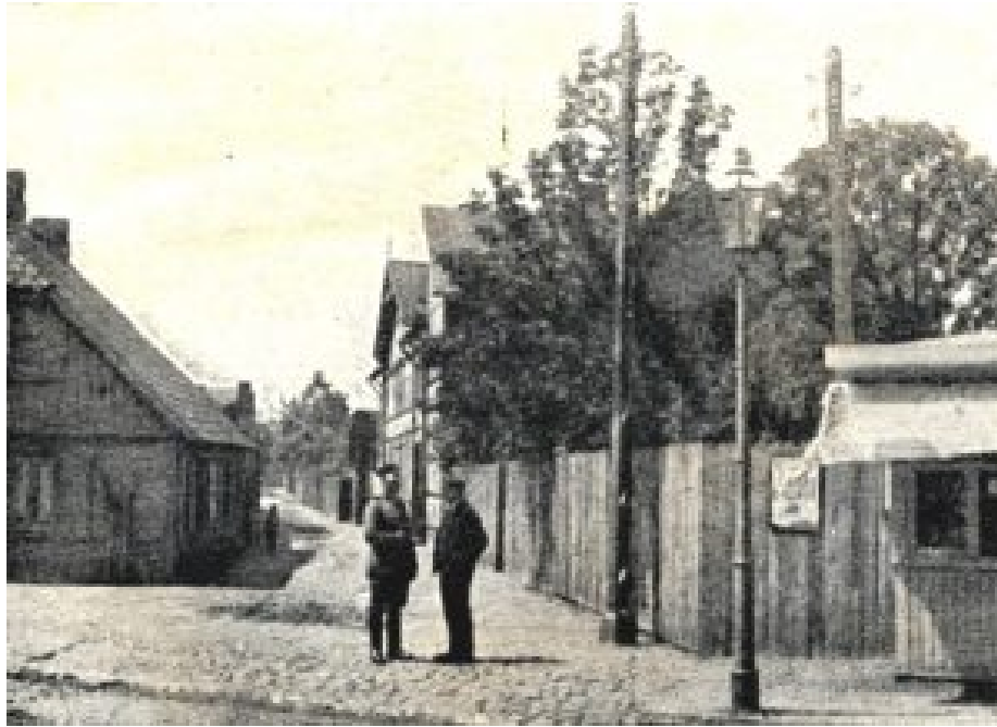
Bródno in Olszewskis Kindheit.

Der Vater, in zweiter Generation Eisenbahner und Sozialist, nahm den kleinen Janek mit zu Versammlungen, Arbeiterfesten, Fortbildungen. Was dort verkündet und vorgelebt wurde, dafür stand der große Jan sein Leben lang ein: soziale Gerechtigkeit, parlamentarische Demokratie, polnischer Patriotismus und polnische Unabhängigkeit, ein schlicht praktizierter katholischer Glaube und die klare Ablehnung des Kommunismus.