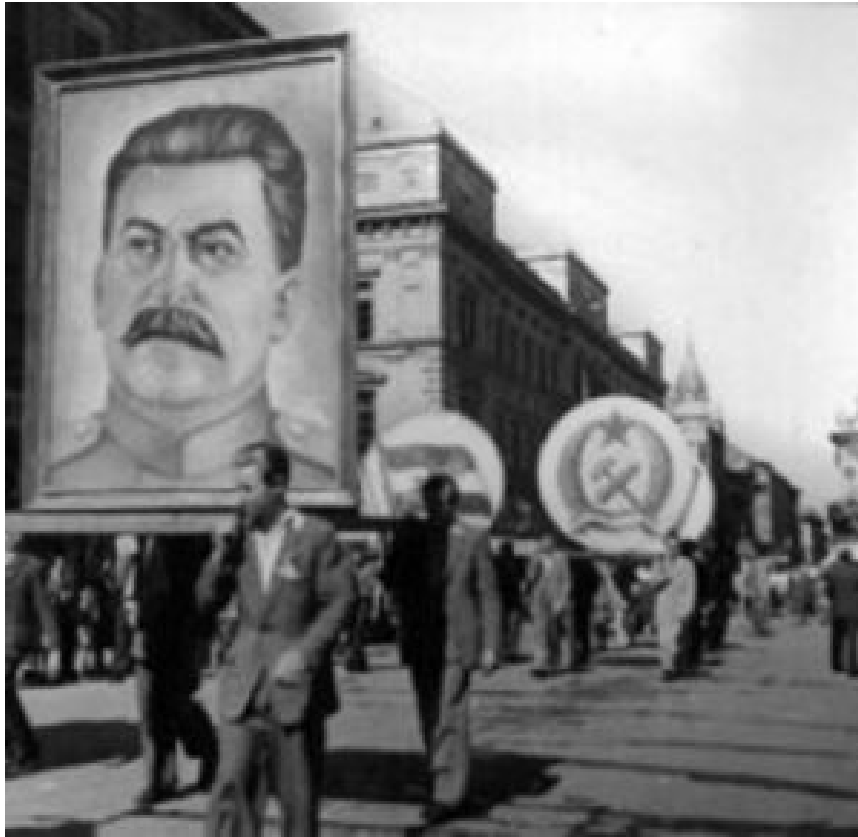
Schauprozesse und Stalinhuldigungen. Stalinismus in Polen.

Die finstere Nacht des Kommunismus, der Schauprozesse, der Stalinhuldigungen, der unentwegten, allgegenwärtigen ideologischen Abrichtung breitete sich auch über Polen aus.