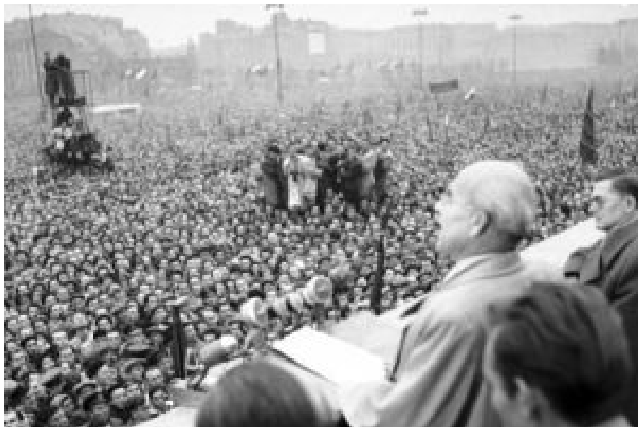
Hoffnungsträger Władysław Gomułka im Oktober 1956. Polen lag ihm zu Füßen.

Diesmal hieß Polens Hoffnungsträger Władysław Gomułka. Der Reformkommunist, Ende der Vierzigerjahre aller Ämter enthoben, verhaftet und nur knapp einem Schauprozess entkommen, sollte nun einen „polengerechten“ Sozialismus schaffen: ohne Kollektivierung der Landwirtschaft, nationalpatriotisch, mit einer ausgeprägten Arbeiterselbstverwaltung, statt wirtschaftlicher Zentralplanung, mit Kunst- und Medienfreiheit.