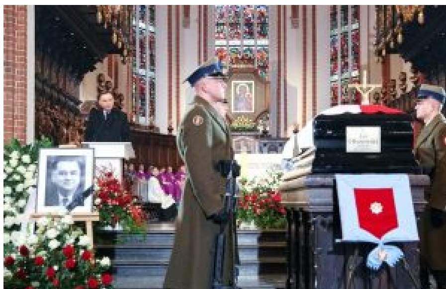
Beisetzungsfeierlichkeiten Jan Olszewskis. Staatspräsident Andrzej Duda hielt die Trauerrede in der Warschauer Kathedrale. Zehntausende gaben Olszewski das letzte Geleit.

Bescheiden, zurückhaltend, aber im Kern unverbrüchlich in seiner Haltung lebte er weitgehend zurückgezogen und in den letzten Lebensjahren, schwer krank, in Warschau. Zehntausende, die seine Auffassung vom Anstand in der Politik teilten, gaben ihm das letzte Geleit.