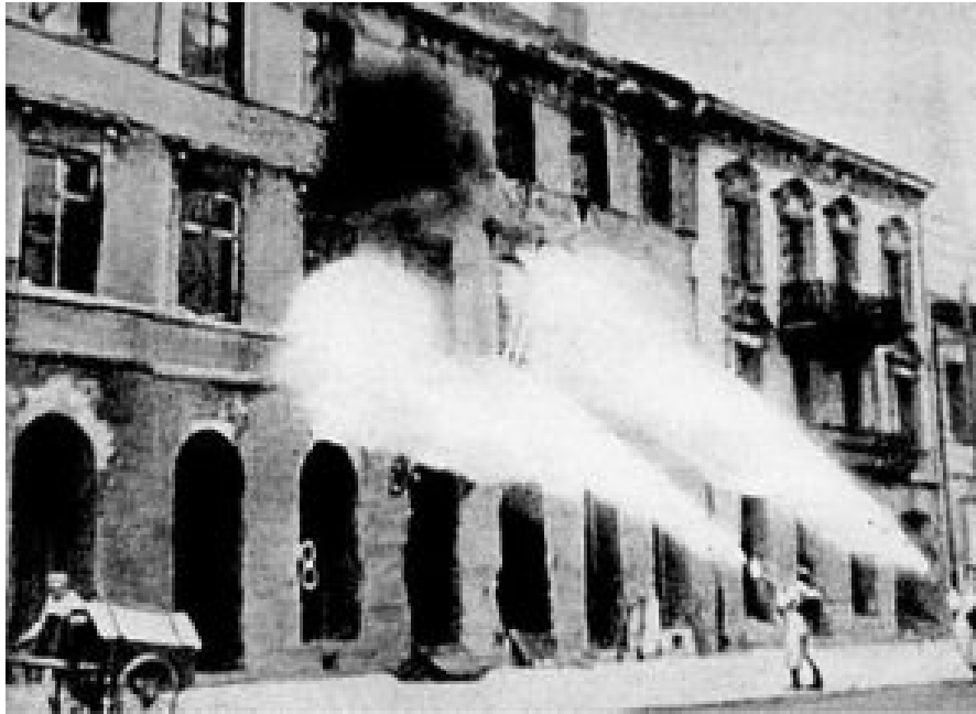
Deutsches Brandkommando. Systematische Zerstörung Warschaus Oktober 1944 bis Mitte Januar 1945.