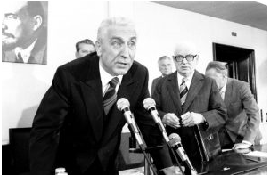
Parteichef und Hoffnungsträger Edward Gierek.

Im Dezember 1970 fegten schwere Arbeiterunruhen in den Küstenstädten Szczecin, Gdynia, Gdańsk und Elbląg den inzwischen greisen, sklerotischen und allgemein verhassten Parteichef Gomułka von seinem Posten. Die Unruhen waren durch eine starke Erhöhung der Lebensmittelpreise ausgelöst worden, die der neue Parteichef und Hoffnungsträger Edward Gierek wieder zurücknahm.