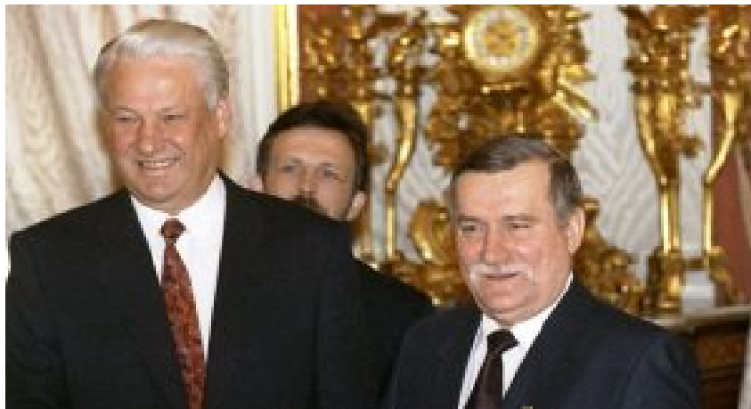
Staatspräsidenten Wałęsa und Jelzin in Moskau. Mai 1992.

Olszewski zögerte nicht, Wałęsa nach Moskau ein chiffriertes Telegramm zu schicken, das dem Staatspräsidenten unmittelbar vor der Unterzeichnung diskret zugestellt wurde. Darin stand, die Regierung entziehe Wałęsa die Unterzeichnungsvollmachten, sollte er den Joint-Venture-Punkt nicht aus dem Vertrag entfernen. Wutschnaubend bat Wałęsa Jelzin um Nachverhandlungen. Die Joint Ventures verschwanden aus dem Text, aber Wałęsa schwor damals Rache.