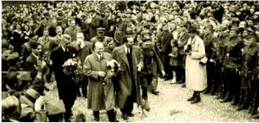
Stanisław Mikołajczyks (i. d. Mitte mit Blumenstrauß) Rückkehr im Juni 1945 versetzte Polen in einen Freudentaumel.

Mikołajczyks Rückkehr im Juni 1945 versetzte Polen in einen Freudentaumel. Sein Auto wurde auf dem Weg vom Flughafen in die Stadt angehalten und von der Menge getragen. Olszewski, der einstige konspirative Pfadfinder der Grauen Reihen, pinselte nachts wieder Parolen an Hauswände, verteilte Flugblätter, diesmal gegen die Kommunisten. Er bewachte mit anderen Freiwilligen die Warschauer Redaktion und Druckerei der „Gazeta Ludowa“ („Volkszeitung“), der einzigen unabhängigen Zeitung im damaligen Polen, um sie vor kommunistischen Übergriffen zu schützen. Im November 1947 wurde sie verboten