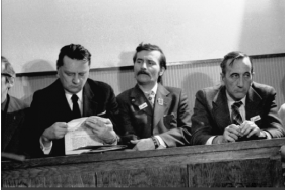
Olszewski bei der Registrierung der Gewerkschaft Solidarność beim Woiwodschaftsgericht in Warschau mit Lech Wałęsa und Solidarność-Berater Tadeusz Mazowiecki.

Nur so sei man stark genug, den Regierenden die Stirn zu bieten. Olszewski entwarf auch die Solidarność-Satzung und stand einer Gruppe von Juristen vor, die die Registrierung der Gewerkschaft beim Woiwodschaftsgericht in Warschau vornahm.