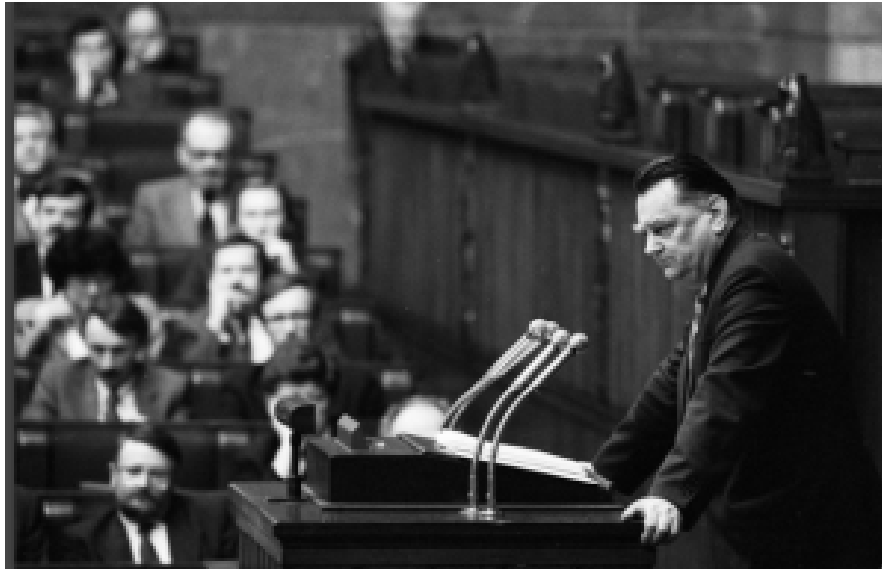
Olszewski verliert seine Regierungserklärung im Sejm am 21. Dezember 1991.

Olszewski brach mit dem hyperliberalen Programm seiner Vorgänger in der Wirtschaftspolitik und beschritt neue Wege in der Innen- und Außenpolitik. Einstellung der raubbauartigen Privatisierung der Industrie. Der Satz aus seiner Regierungserklärung „Die unsichtbare Hand des Marktes ist oft die Hand eines Diebes“ gehört in Polen seither zu den geflügelten Worten.