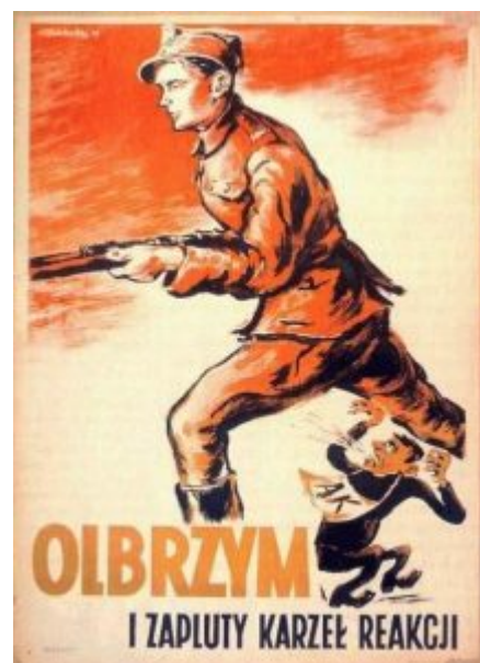
Kommunistisches Plakat von 1945. „Der Riese und (unten) der dreckige Gnom der Reaktion“ .

Volkes“, „Dreckige Gnome der Reaktion“ verunglimpft. Das, so die Autoren, war ein schreiendes Unrecht.