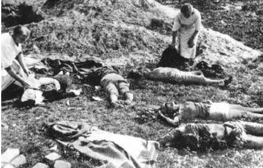
Tote Zivilisten nach einem deutschen Luftangriff auf das belagerte Warschau 1939.

Im vierten Besatzungsjahr, 1942, gelangte der Zwölfjährige durch vertrauliche Verbindungen in die Grauen Reihen (Szare Szeregi). So nannte sich der Polnische Pfadfinderverband im Untergrund. Konspirativ, ohne Uniformen, verknüpfte er die normale Ausbildung mit der sogenannten kleinen Sabotage. Parolenmalen auf Mauern und Zäunen („Deutschland kaputt!“). Nägelstreuen auf Fahrbahnen (Polen durften in der Besatzungszeit ohnehin keine Autos besitzen). Heimlich Flugblätter verteilen usw.