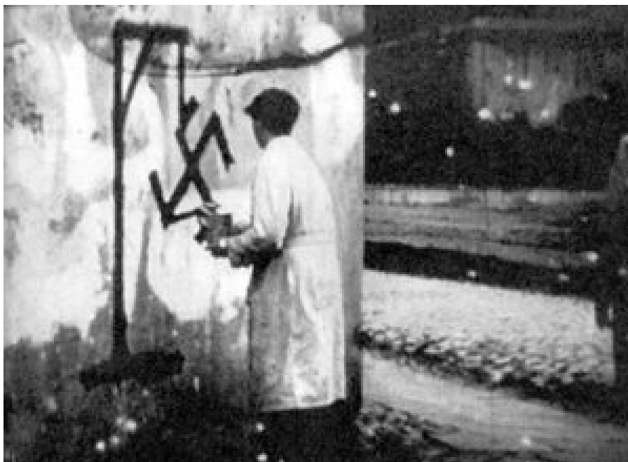
„Kleine Sabotage“ in Warschau unter deutscher Besatzung.

Im vierten Besatzungsjahr, 1942, gelangte der Zwölfjährige durch vertrauliche Verbindungen in die Grauen Reihen (Szare Szeregi). So nannte sich der Polnische Pfadfinderverband im Untergrund. Konspirativ, ohne Uniformen, verknüpfte er die normale Ausbildung mit der sogenannten kleinen Sabotage. Parolenmalen auf Mauern und Zäunen („Deutschland kaputt!“). Nägelstreuungen auf Fahrbahnen (Polen durften in der Besatzungszeit ohnehin keine Autos besitzen). Heimlich Flugblätter verteilen usw.