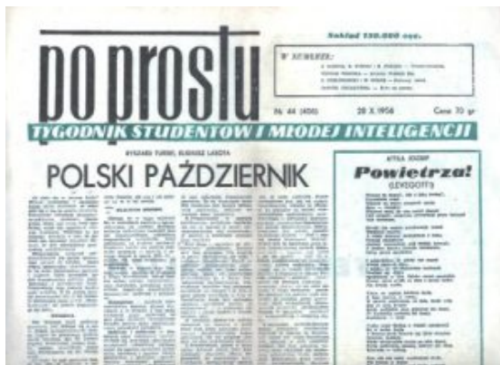
„Po Prostu“. Titelseite.

Der berühmteste Artikel Olszewskis, gemeinsam geschrieben mit weiteren zwei Kollegen, trug den Titel „Den Leuten von der Heimatarmee entgegenkommen“ („Na spotkanie ludziom z AK“) und erschien im März 1956. Zehntausende Untergrundkämpfer der Heimatarmee (Armia Krajowa – AK), die während des 2. Weltkrieges der legalen polnischen Regierung im Londoner Exil unterstanden, hatten für ein freies und demokratisches Polen gekämpft. Nach dem Krieg wurden sie von den Kommunisten verfolgt, eingesperrt, hingerichtet, schikaniert, der Existenzgrundlage beraubt, dazu auf Schritt und Tritt als „Verräter an der Sache des