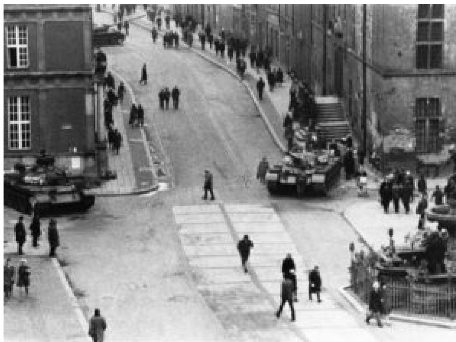
Unruhen im Dezember 1970. Panzer auf dem Langen Markt in Gdańsk.

Ab Mitte 1970 durfte Olszewski wieder die Anwaltsrobe tragen. Sofort übernahm er ein Mandat im großen politischen Prozess der Mitglieder der konspirativen Jugendorganisation Ruch („Bewegung“), die antikommunistische Parolen an Häuserwände malte, Flugblätter herstellte und geplant hatte ein Lenin-Museum in der Nähe von Kraków in Brand zu stecken.