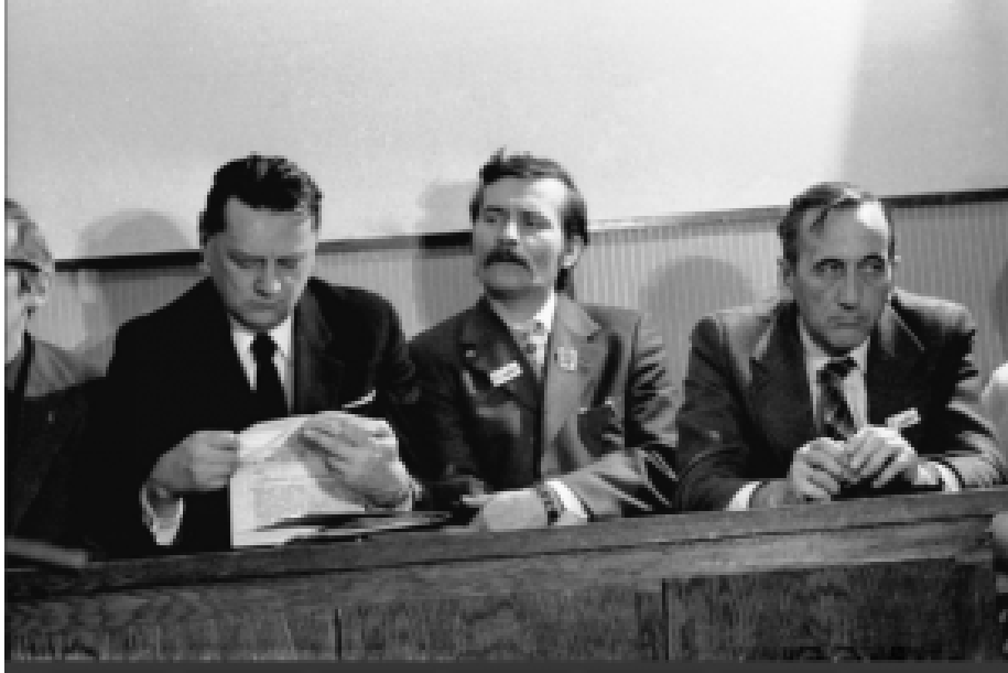
Olszewski bei der Registrierung der Gewerkschaft Solidarność beim Woiwodschaftsgericht in Warschau mit Lech Wałęsa und Solidarność-Berater Tadeusz Mazowiecki.

Nur so sei man stark genug, den Regierenden die Stirn zu bieten. Olszewski entwarf auch die Solidarność-Satzung und stand einer Gruppe von Juristen vor, die die Registrierung der Gewerkschaft beim Woiwodschaftsgericht in Warschau vornahm.