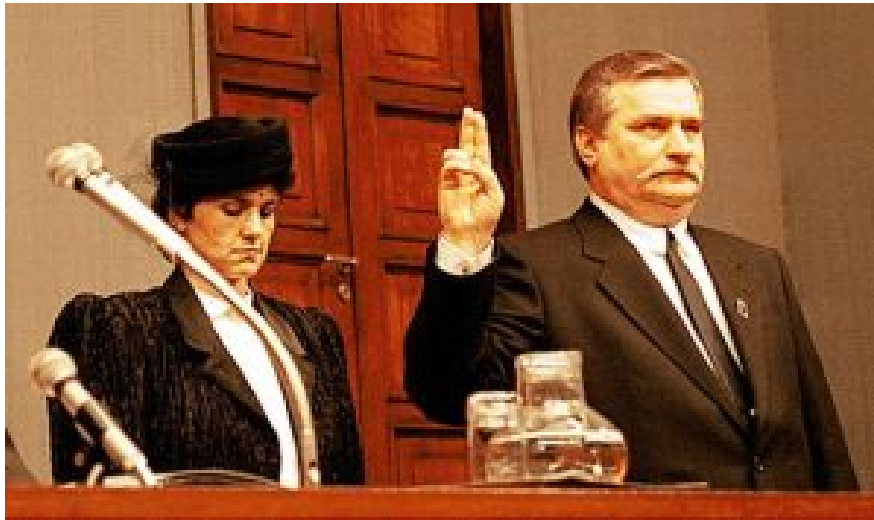
Vereidigung von Staatspräsident Lech Wałęsa vor dem Sejm und Senat am 22. Dezember 1990.

abzusetzen. Diese fanden im Dezember 1990 statt und Wałęsa wurde Staatschef.