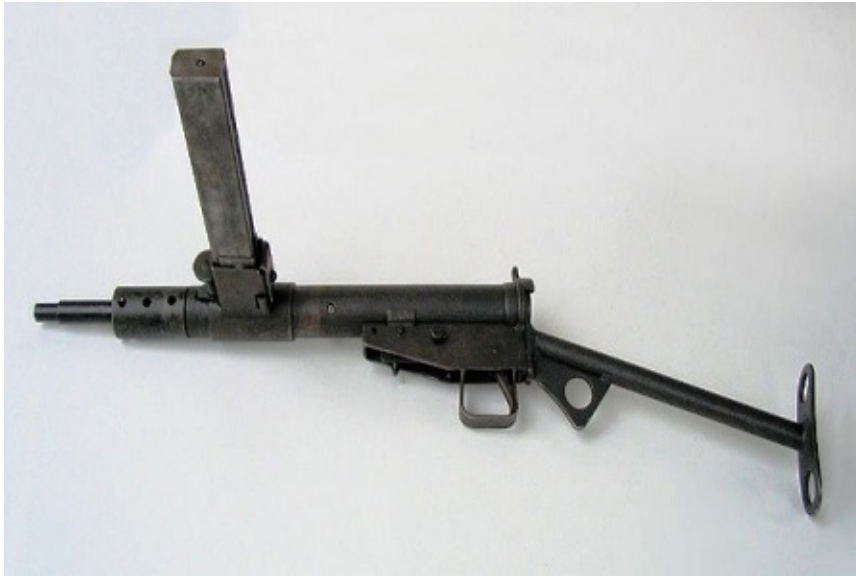
Przyborowskis britische Sten-Maschinenpistole.

Justizminister Zbigniew Ziobro, der seit Anfang 2016, aufgrund der Rückkehr zu der bis 2010 geltenden Regelung, wieder das Amt des Justizministers und das des Generalstaatsanwaltes in Personalunion ausübt und somit die Aufsicht über die Staatsanwaltschaft inne hat, wies die zuständige Anklagebehörde an das Verfahren einzustellen.