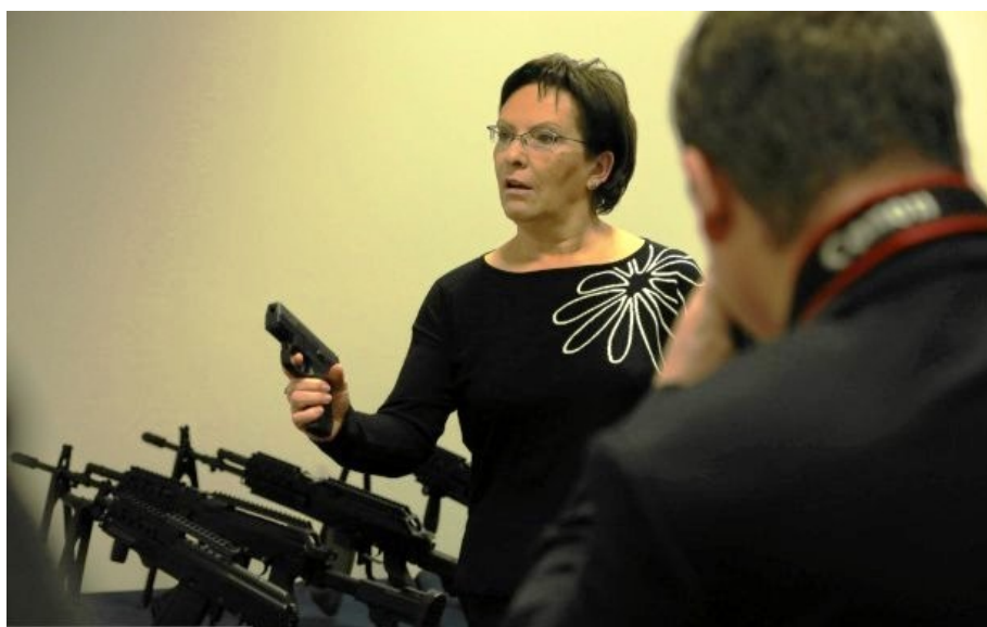
Die Waffen der Frau. Ministerpräsidentin Ewa Kopacz inspiziert die Radom-Waffenfabrik am 15.12.2014.

Zum anderen, zweifeln die Leute offensichtlich ernsthaft daran, ob ein leichter Zugang zu Waffen tatsächlich ihre Sicherheit erhöhen würde. Aktuell gibt es in Polen wenig Verbrechen mit Schusswaffengebrauch. Dagegen steht ein hoher Alkoholkonsum und eine Vielzahl damit verbundener Straftaten. Daher würden mehr Waffen in der Öffentlichkeit das Risiko von Tragödien stark erhöhen. Ein guter Grund, weshalb die Politik in diesem Fall Volkes Stimme uneingeschränkt folgen sollte.“ Was sie, wie man sieht, ja auch tut.