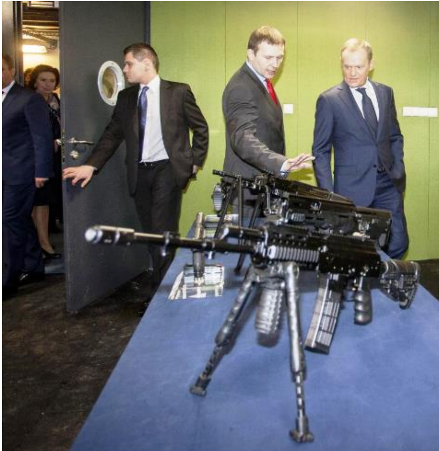
Ministerpräsident Donald Tusk zu Besuch in der Radom-Waffenfabrik am 05.03.2014.

Sein späterer politischer Erzfeind Donald Tusk kolportiert seit 2007, er sei 1991 mit Kaczyński in einem Fahrstuhl gefahren. Kaczyński soll während der Fahrt mit einer Pistole hantiert und gesagt haben: „Dich umzubringen wäre für mich so leicht wie einmal spucken“. Der Betroffene bestreitet den Vorfall. Zeugen gibt es nicht. Weitere Zwischenfälle, die Kaczyński als einen Waffennarren entlarven würden, sind nicht bekannt. Dafür ist seine öffentliche Ablehnung (u. a. in Gdańsk am 15.01.2017) der Lockerung des aktuell in Polen geltenden Waffenrechts eine Tatsache.