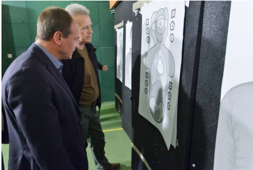
Wollte u. a. der Waffenfabrik in Radom mehr Absatz beschaffen. Paweł Kukiz beim Besuch in Polens größter Waffenschmiede am 11.04.2016.

Knapp 80 Prozent der Befragten in einer Erhebung, die die Zeitung „Rzeczpospolita“ („Die Republik“) Anfang Dezember 2016 in Auftrag gab, sprachen sich gegen die Liberalisierung des Schusswaffengesetzes aus. Der entsprechende Gesetzesvorschlag der Kukiz-Bewegung (der Rock-Musiker Paweł Kukiz war 2015 ihr Begründer und Namensgeber) wurde inzwischen im Parlament auf die lange Bank geschoben, mit wenig Chancen auf Verabschiedung.