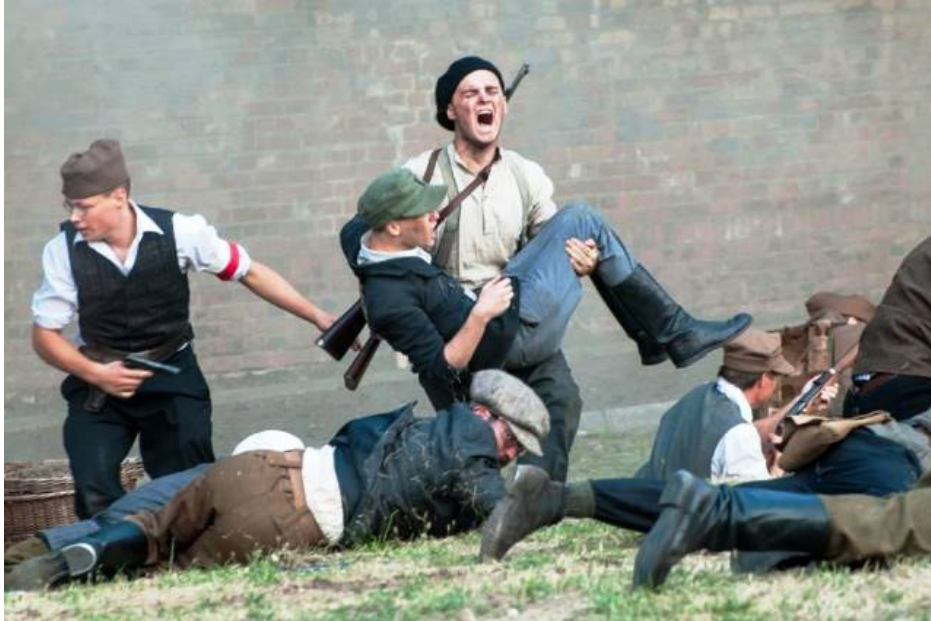
Reenactment auf Polnisch. Am 01.08.2015 Nachinszenierung der ersten Stunden des Warschauer Aufstandes, der am 1. August 1944 ausgebrochen war. Anders als damals wurde jetzt nur mit Platzpatronen geschossen.

Im letzteren Fall gibt es eine Erlaubnis nur für platzpatronentaugliche Schuss- und Kriegswaffen. Sammler wiederum müssen ihre Waffen „dauerhaft schiessunfähig“ machen.