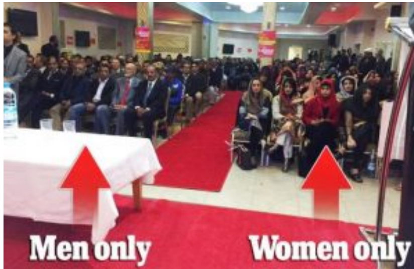
Labour-Wahlveranstaltung in Birmingham 2015.

In der britischen Presse erschien 2015 ein Foto von der Wahlveranstaltung eines Labour-Kandidaten in einem muslimischen Viertel von Birmingham. Frauen und Männer sitzen streng voneinander getrennt.