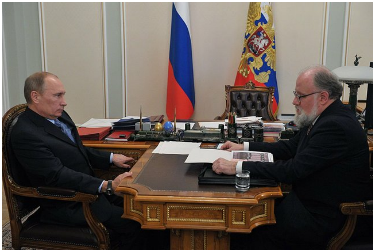
Der russische „Wahlzauberer“ Wladimir Tschurow mit Putin im Kreml...

In der Zeit vom 26. bis 27. Mai 2013 fand der Gegenbesuch einer 12-köpfigen polnischen SWK-Delegation „zu Schulungszwecken“ in Moskau statt. Unter Tschurows Aufsicht überstieg u. a. in manchen Gegenden Russlands die Wahlbeteiligung, immer wieder mal, die Einhundertprozent-Marke.