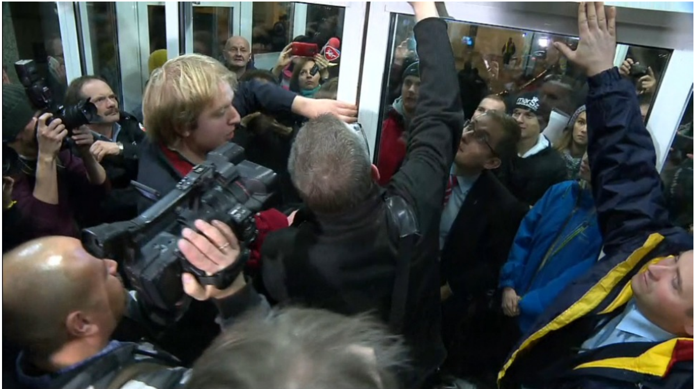
Demonstranten drängen in das Gebäude der Staatlichen Wahlkommission in Warschau in der Nacht vom 20. auf den 21. November 2014 ein

von Vertretern kleiner radikalnationaler Gruppierungen (Nationale Bewegung, Kongreß der Neuen Rechten, Die Solidarischen 2010). Die Losung hieß: „Stopp den Wahlmanipulationen“. Einige Demonstranten drangen in das Gebäude ein, besetzten für kurze Zeit den Konferenzsaal. Der Raum wurde bald darauf von der Polizei geräumt.