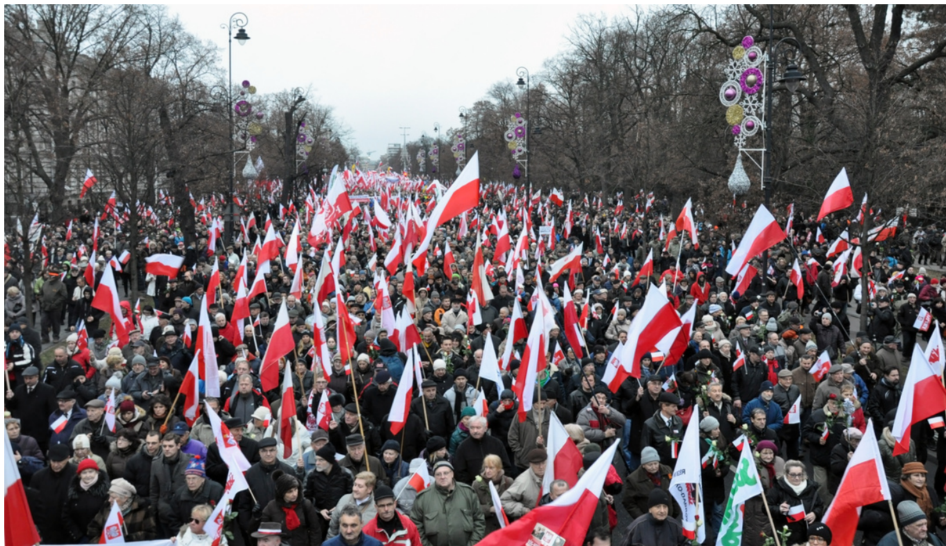
Marsch für die Verteidigung der Demokratie und der Medienfreiheit, zu dem Recht und Gerechtigkeit (PiS) am 13. Dezember 2014 in Warschau aufgerufen hat

15. Die für das Regierungslager in kritischen Situationen typische Abwehrhaltung („ist ja nicht weiter schlimm“), verleitete den Kommentator der Tageszeitung „Rzeczpospolita“ am 20. November zu der Feststellung: „Es ist ein Fehler, diejenigen die Fragen nach dem Verlauf der Wahlen stellen als »Wahnsinnige« zu bezeichnen, während aus dem ganzen Land Berichte eintreffen, nicht nur über Fehler im Stimmauszählungssystem, sondern auch, und das wiegt schwerer, über eine große Zahl ungültiger Stimmen. (...) Anstatt die Zweifelnden des Wahnsinns zu bezichtigen, sollte der Staatspräsident alles unternehmen, damit ihre Zweifel schnellst möglich zerstreut werden“.