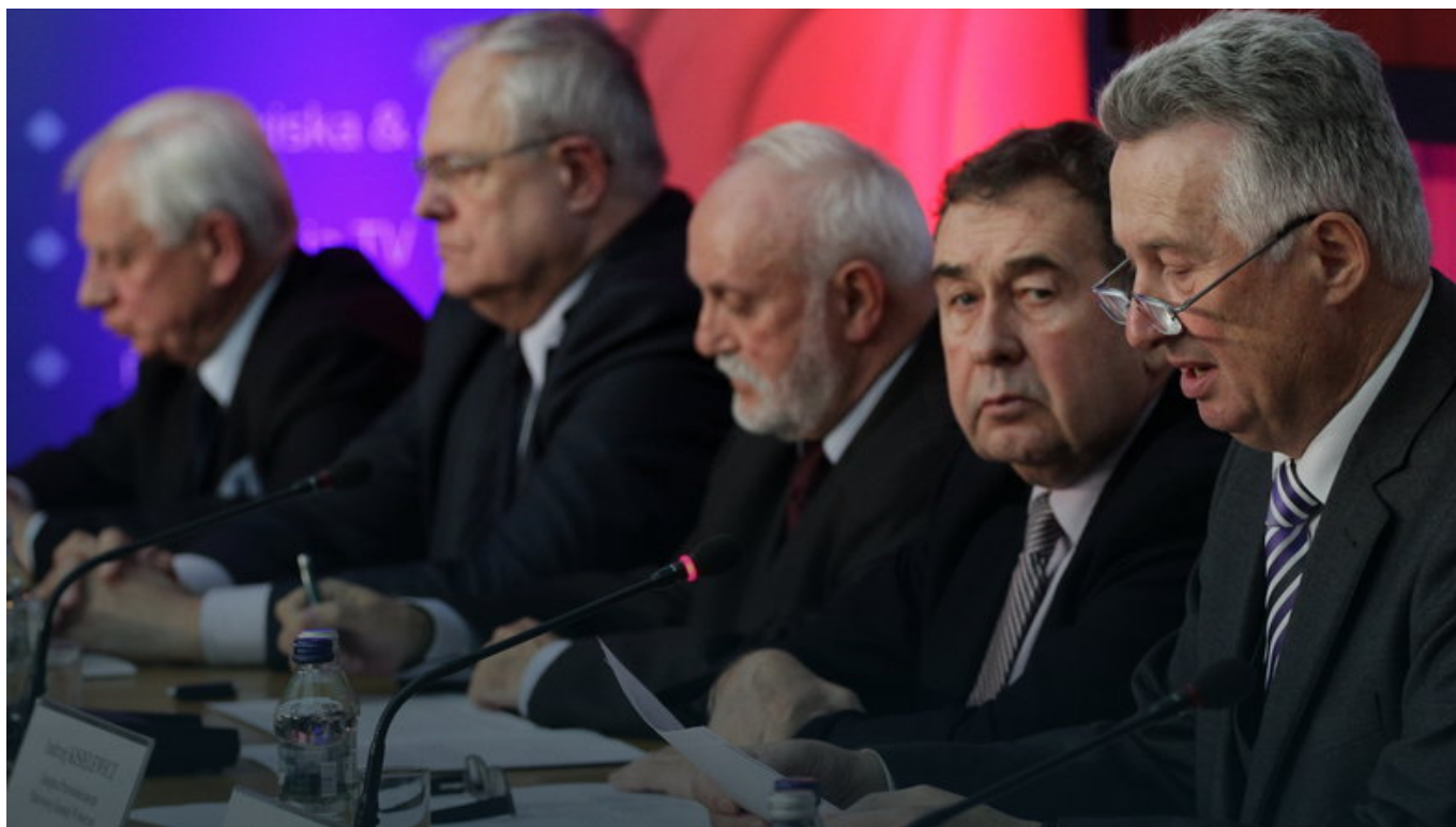
Betulichkeit und Hilflosigkeit – die Staatliche Wahlkommission

Fast alle von ihnen sind einst tief ins kommunistische Justizwesen verstrickt gewesen, zwei haben gar in den 80er Jahren an Verurteilungen von Solidarność-Aktivisten mitgewirkt. Anders als im vereinigten Deutschland (DDR), wurde in Polen, im Rahmen der „nationalen Aussöhnung“ am Runden Tisch von 1989, praktisch die gesamte Richterschaft aus der kommunistischen Zeit übernommen.