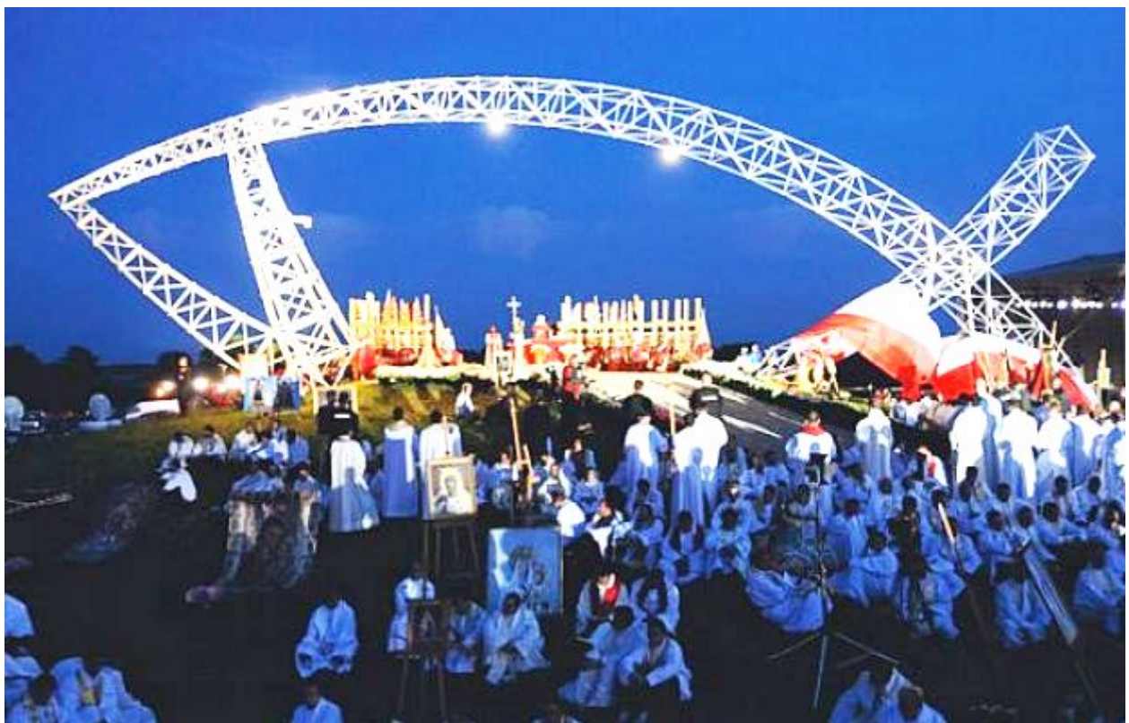
Der Fisch von Lednica als Tor und als Altar.

Es ist ein geschichtsträchtiger Ort, denn auf der Insel Ostrów im Lednica-See ließen sich der polnische Fürst Mieszko I. und sein Hofstaat im Jahr 966 taufen. Die Geschichte des polnischen Staates nahm so