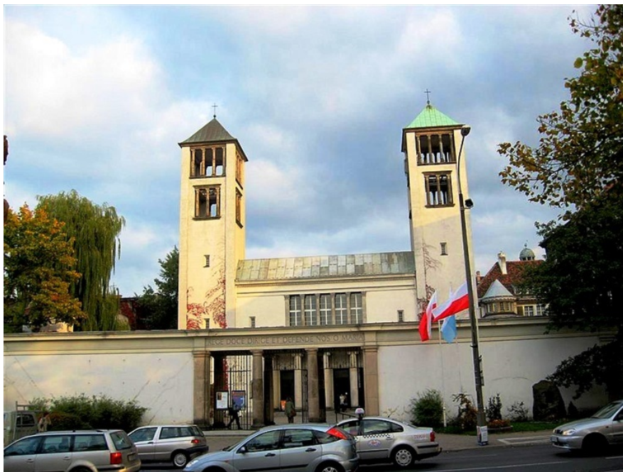
Dominikaner-Kirche in Poznań.