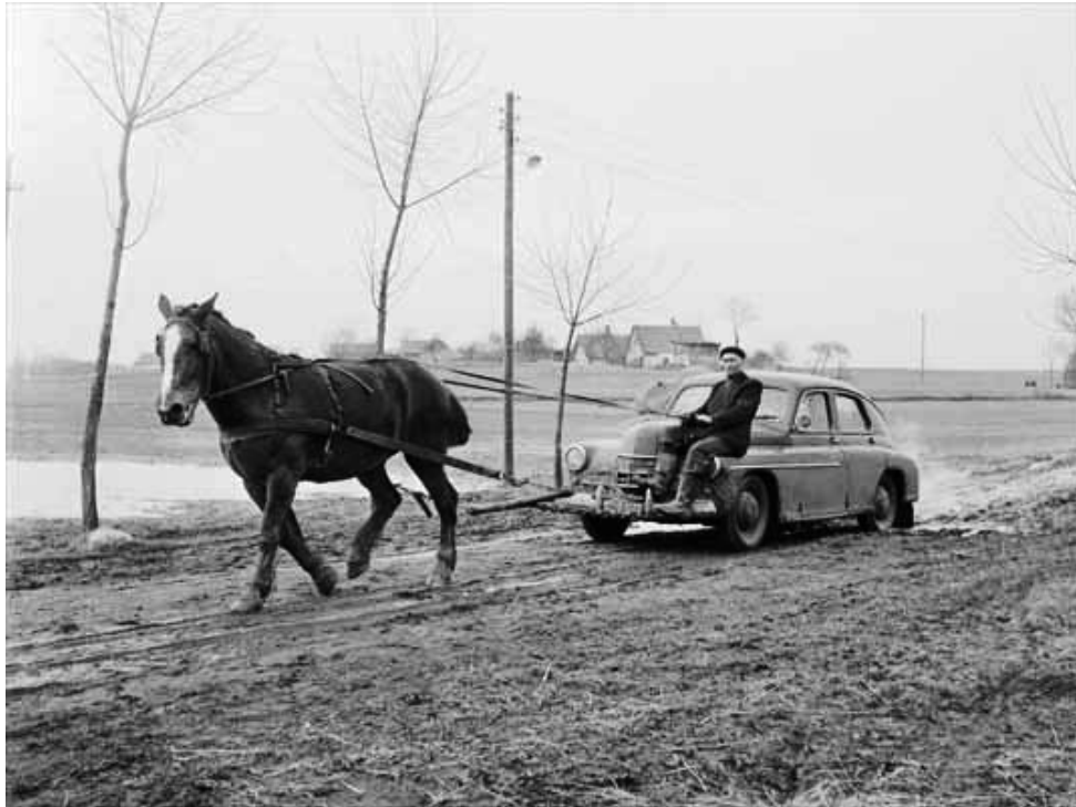
Propaganda und Wirklichkeit. Landleben im kommunistischen Polen der 50er und 60er Jahre.

Dieser drückte den Bauern bei Nahrungsmitteln (Getreide, Kartoffeln, Schweine, Milch) immer höhere Zwangsabgaben (sog. Kontingente) zu Niedrigstpreisen auf. Wer sie nicht erbringen konnte, landete im Gefängnis, aus dem er nur herauskam, wenn er sich bereiterklärte der LPG (Kolchose) beizutreten.