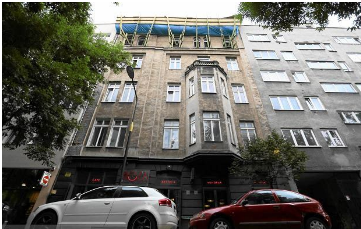
Haus in der Warschauer Hozastrasse 25A. Für zwölf Euro abgeluchst.