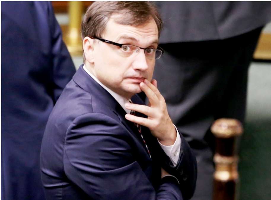
Justizminister Zbigniew Ziobro.

Anfang März 2016 ist eine Reform in Kraft getreten, die das ermöglicht: Polens Justizminister ist wieder gleichzeitig Generalstaatsanwalt, er kann von Amtswegen tätig werden und übernimmt dafür die volle Verantwortung. Die Staatsanwaltschaft ist wieder handlungsfähig geworden. Sechs Jahre lang war das anders.