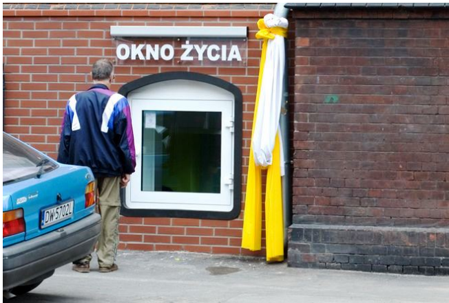
Fenster des Lebens in Wrocław.