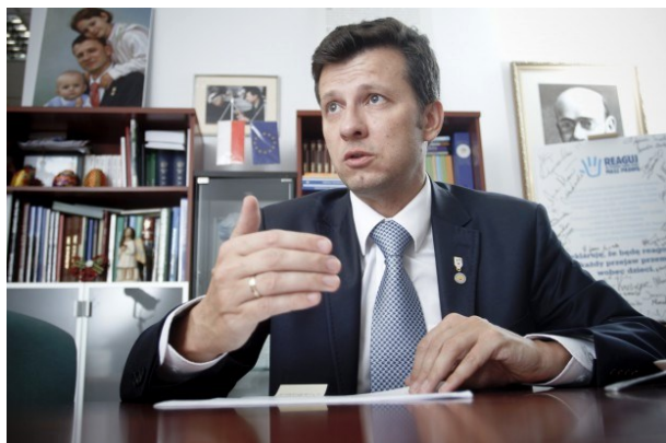
Marek Michalak, der Kinderrechtsbeauftragte des polnischen Parlaments.

von Babyklappen durchzusetzen. Im November 2015 wurde auch Polen von der UNO namentlich aufgefordert die Fenster des Lebens abzuschaffen, weil sie das „Recht der Kinder“ verletzen, die eigenen Eltern kennenzulernen. Zitat: „Zudem unterbleibe eine Abwägung des Rechts auf Leben und Entwicklung (Artikel 6 der Kinderrechtskonvention) mit dem Recht des Kindes auf Kenntnis der eigenen Identität und auf Beziehungen zu seinen Eltern.“