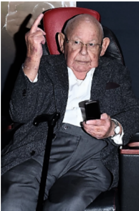
Jerzy Urban, der altersmüde Medienluzifer.

Doch die Postkommunisten, die Urban und sein Schmuddelblatt nach Kräften unterstützten, haben sich durch Korruption, Arroganz und innere Zerwürfnisse bis zum Jahr 2005 ins politische Abseits manövriert, wo sie bis heute verharren. Und wie der Kommunismus, dem er treu diente, erwies sich auch Jerzy Urban als nicht reformierbar.