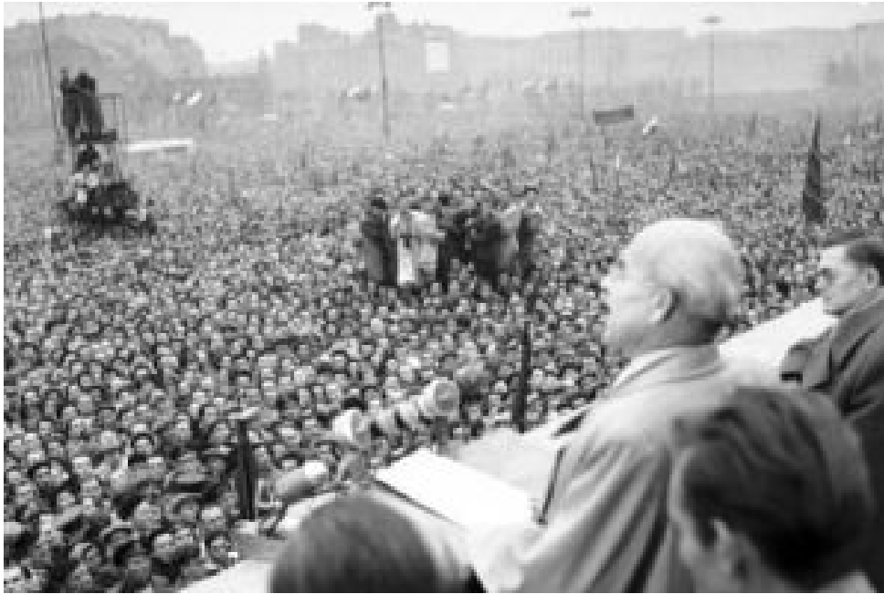
Hoffnungsträger Władysław Gomułka im Oktober 1956. Polen lag ihm zu Füßen.

Polens Hoffnungsträger in dieser Zeit hieß Władysław Gomułka. Dem Stalinismus abgeneigt, Ende der Vierzigerjahre aller Ämter enthoben, verhaftet und nur knapp einem Schauprozess entkommen, sollte er nun einen „polengerechten“ Sozialismus schaffen: ohne Kollektivierung der Landwirtschaft, nationalpatriotisch, mit einer ausgeprägten Arbeiterselbstverwaltung, statt wirtschaftlicher Zentralplanung, mit Kunst- und Medienfreiheit.