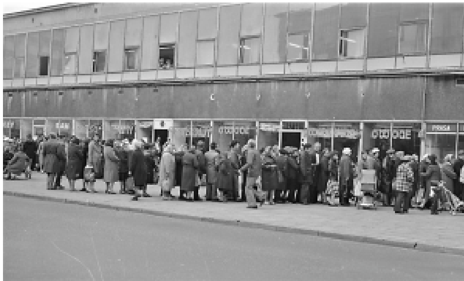
Polen 1980-1981. Schlangestehen und nichts zu kaufen.

Je weitverbreiteter die Entmutigung und Resignation, so der Plan, umso schwächer der Widerstand gegen das Kriegrecht, dessen Verhängung, unter strengster Geheimhaltung, von langer Hand vorbereitet wurde. Die Rechnung ging weitgehend auf. Als dann am 13. Dezember 1981 die Panzer und die Verhaftungswellen rollten, waren Proteste und Gegenwehr schnell gebrochen.