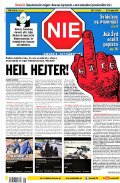
NIE-Titelseite vom 21. Mai 2020.