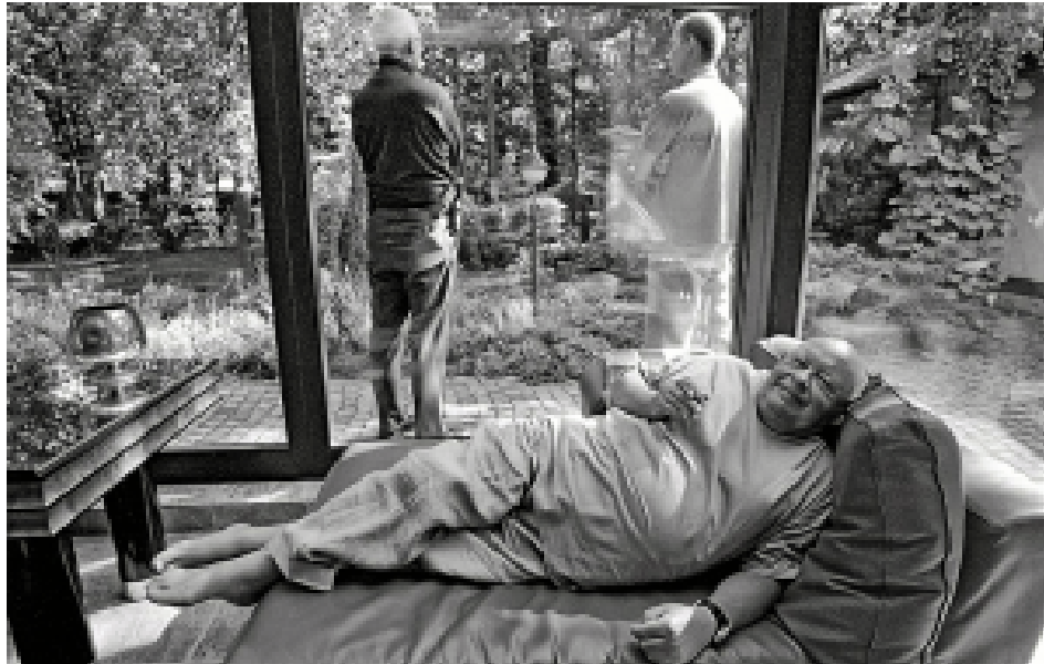
Millionär Jerzy Urban in seinem Haus, bewacht von Leibwächtern. Und in seiner Luxuslimousine.

Es bereitete ihm eine diebische Freude, seinen Reichtum zur Schau zu stellen. Er fuhr einen Jaguar, trug handgeschneiderte italienische Anzüge, trank Whisky und Champagner und ließ seine Villa mit Swimmingpool im Warschauer Nobelprevort Konstancin von Leibwächtern bewachen. Er liebe nun mal den Luxus und ein ausschweifendes Leben, „vor allem weil sich meine Gegner so herrlich grün und blau darüber ärgern“.