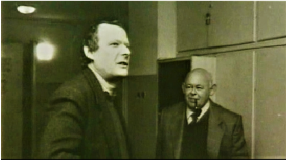
Adam Michnik und Jerzy Urban 1990.

Aber Urban, der Zyniker, scherte sich nicht im Geringsten um seine Leser aus den stillgelegten Staatsgütern auf dem Lande und den rostbefallenen Fabrikruinen. Sein Ziel war es, in die neue Machtelite aufgenommen zu werden.