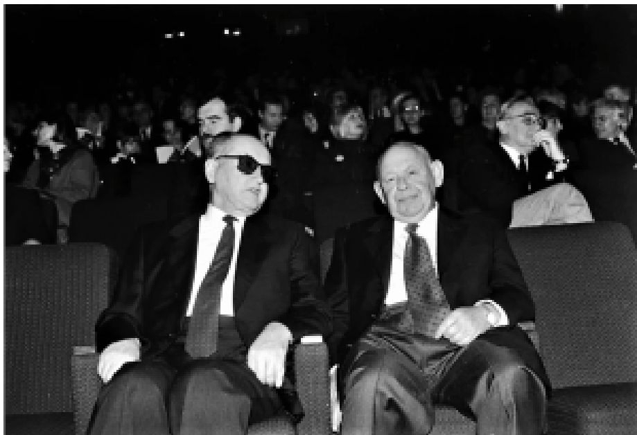
Zufriedene Pensionäre: General Wojciech Jaruzelski und sein einstiger Regierungssprecher Jerzy Urban Mitte der 1990er Jahre.

Die Triebfedern seines Tuns blieben dieselben. Da war zum einen die tiefe Abneigung gegen Solidarność und Lech Wałęsa, der im Dezember 1990 zum Staatspräsidenten gewählt wurde. Zum anderen war es die Kirche und das Christentum im weiteren Sinne, die Urban schon immer gehasst hatte.