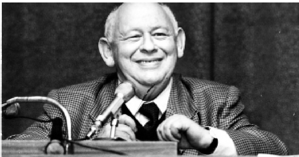
Regierungssprecher Jerzy Urban.

Als General Wojciech Jaruzelski im Februar 1981 an die Spitze von Partei und Staat trat, und Mieczysław Rakowski sich ihm als stellvertretender Ministerpräsident zur Seite stellte, eilte Urban dem neuen Team zu Hilfe. Er zwinkerte den abgehalfterten Provinz-Parteisekretären und den tumben Generälen zu: „Wir wollen doch dasselbe, eine Welt bewahren, in der wir die privilegierte Elite sind. Hinter euch steht die Macht der Geheimpolizei und des Militärs, und ich weiß, wie man die Menschen durcheinanderbringt, die Gesellschaft in die Depression treibt“.