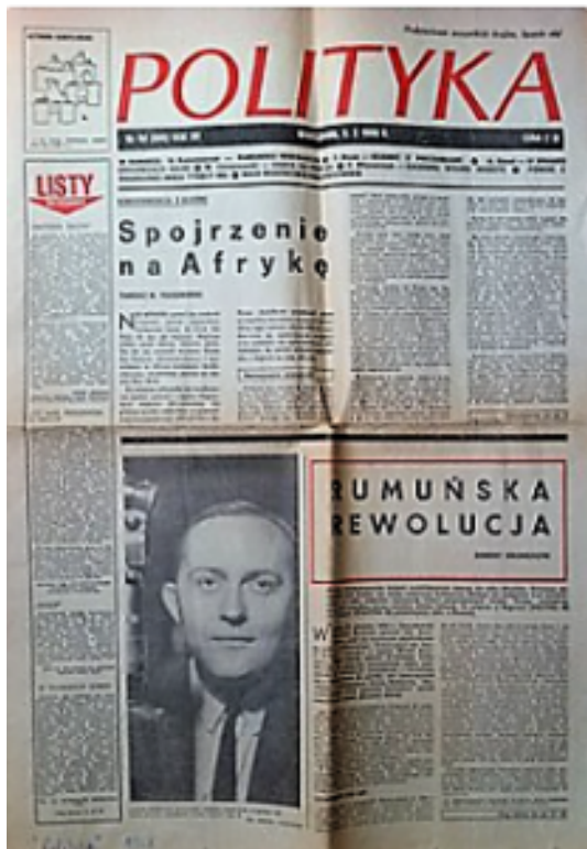
„Polityka“-Titelseite vom 5. Oktober 1968.