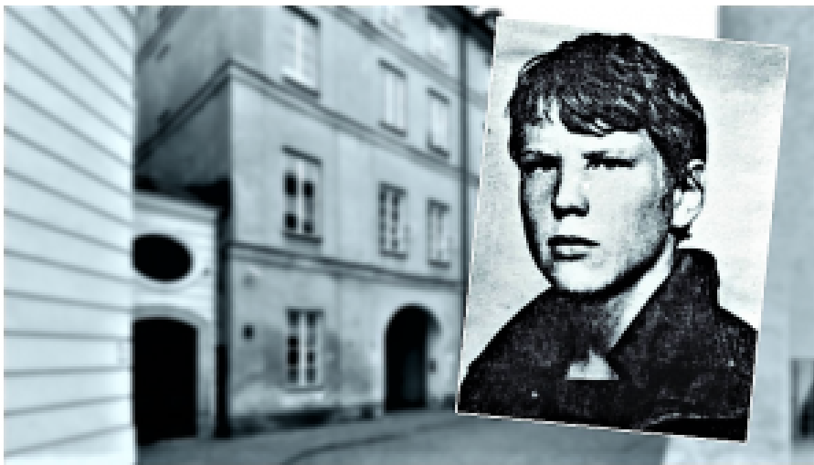
Der Abiturient Grzegorz Przymyk. Im Hintergrund die Polizeiwache in der Warschauer Altstadt, in der er am 14. Mai 1983 zu Tode geprügelt wurde.

Parallel zu seinen Pressekonferenzen führte Urban publizistische Kreuzzüge gegen Oppositionelle, die das Regime als besonders bedrohlich ansah. Er schrieb zu diesem Zweck, unter seinem „amtlichen“ Pseudonym Jan Rem, Kolumnen, von denen jeder wusste, dass es seine Texte sind. Diese Leidenschaft, die oft bereits überwachten, verfolgten oder sogar eingesperrten Gegner zu verhöhnen und zu demütigen, war eine der widerlichsten Erscheinungsformen seines Tuns.