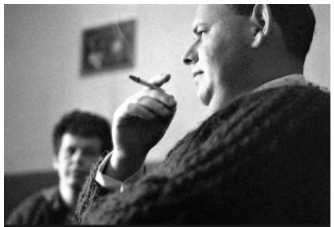
Jerzy Urban 1962.

Nach der Auflösung von „Po Prostu“ erhielten Urban und einige andere Journalisten des Blattes Schreibverbot. Doch Urban war intelligent und geschickt genug, um schnell herauszufinden, wie man dieses Verbot umgehen konnte. „Zuerst lebte ich sehr bescheiden, aber innerhalb kürzester Zeit ging es mir prächtig. Ich habe unter Pseudonym geschrieben oder für andere. In einer Regionalzeitschrift in Łódź erschien zum Beispiel meine wöchentliche Kolumne. Darunter stand der Name des Chefredakteurs. Er heimste den Ruhm ein, ein begnadeter Glossenschreiber zu sein, und ich hatte das Geld“.