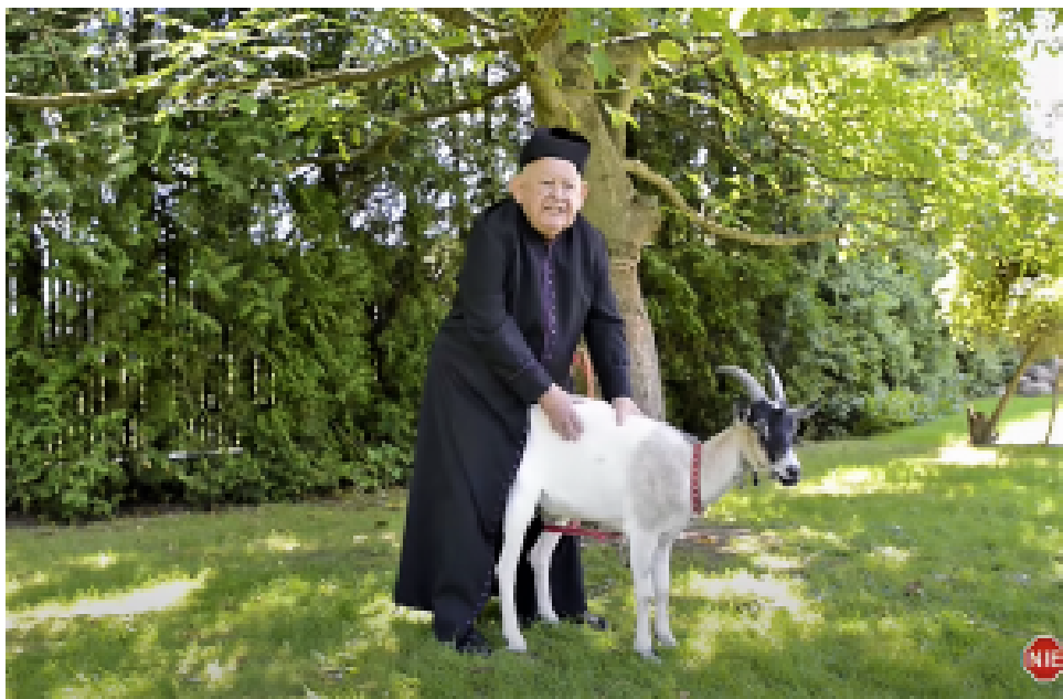
Erniedrigen und verletzen. Urban mimt den zoophilen katholischen Priester.

Urban lechzte zudem geradezu danach, Polen und den Polen das alles zu nehmen, worauf sie stolz sein können, was sie positiv verbindet, Vertrauen schafft und sie ermutigt, ihr eigenes und das gemeinschaftliche Leben zu verbessern. In seinem letzten großen Interview für die „Gazeta Wyborcza“ verkündete er: „Ich bin für Vandalismus und Schändung. Mehr Radikalismus. Drescht auf die Katholiken ein! Macht die Weiß-Roten platt!“.