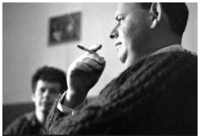
Jerzy Urban 1962.

Nach der Auflösung von „Po Prostu“ erhielten Urban und einige andere Journalisten des Blattes Schreibverbot. Doch Urban war intelligent und geschickt genug, um schnell herauszufinden, wie man dieses Verbot umgehen konnte. „Zuerst lebte ich sehr bescheiden, aber innerhalb kürzester Zeit ging es mir prächtig. Ich habe unter Pseudonym geschrieben oder für andere. In einer Regionalzeitschrift in Łódź erschien zum Beispiel meine wöchentliche Kolumne. Darunter stand der Name des Chefredakteurs. Er heimste den Ruhm ein, ein begnadeter Glossenschreiber zu sein, und ich hatte das Geld“.