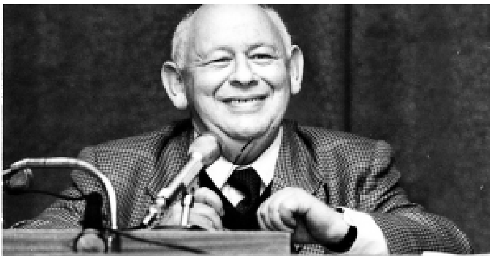
Regierungssprecher Jerzy Urban.

Als General Wojciech Jaruzelski im Februar 1981 an die Spitze von Partei und Staat trat, und Mieczysław Rakowski sich ihm als stellvertretender Ministerpräsident zur Seite stellte, eilte Urban dem neuen Team zu Hilfe. Er zwinkerte den abgehalfterten Provinz-Parteisekretären und den tumben Generälen zu: „Wir wollen doch dasselbe, eine Welt bewahren, in der wir die privilegierte Elite sind. Hinter euch steht die Macht der Geheimpolizei und des Militärs, und ich weiß, wie man die Menschen durcheinanderbringt, die Gesellschaft in die Depression treibt“.