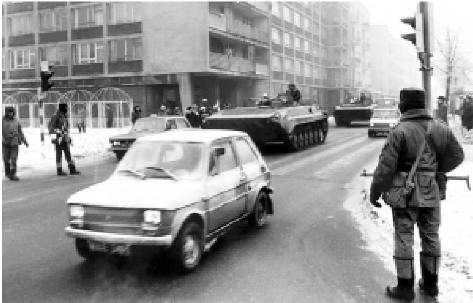
Verhängung des Kriegsrechts am 13. Dezember 1981. Straßenszene in Warschau.

selbst zugab. Jaruzelski sollte der gute Polizist sein und er der böse. Er erinnerte sich: „Ich bin ein Kämpfer und an dieser Front, in dieser Armee, zu der ich mich gemeldet hatte, wurden die Waffen entsprechend zugewiesen. Jaruzelski war für gutes Zureden zuständig, ich für das rhetorische Einprägen. Diese Rolle passte zu mir, weil ich das gerne tue“.