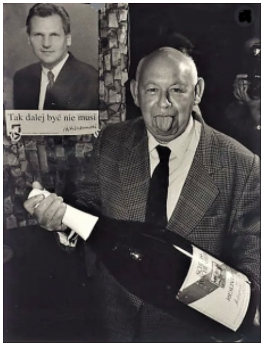
Jerzy Urban feiert 1993 den Wahlsieg der Postkommunisten.

Urban war ihr Sprecher. Und in ihrem Namen erschien er am Abend des 19. September 1993 auf der Wahlparty der Postkommunisten, die gerade die Parlamentswahlen haushoch gewonnen hatten und nur vier Jahre nach ihrer Absetzung wieder die Macht in Polen übernehmen sollten. Das Foto, auf dem Urban mit weit herausgestreckter Zunge und einer riesigen Champagner-Flasche in der Hand die Abwahl des Solidarność-Lagers feierte, hatte für alle, die im antikommunistischen Kampf vor 1989 ihren Kopf hingehalten hatten, etwas Gespenstisches und zutiefst Erniedrigendes.