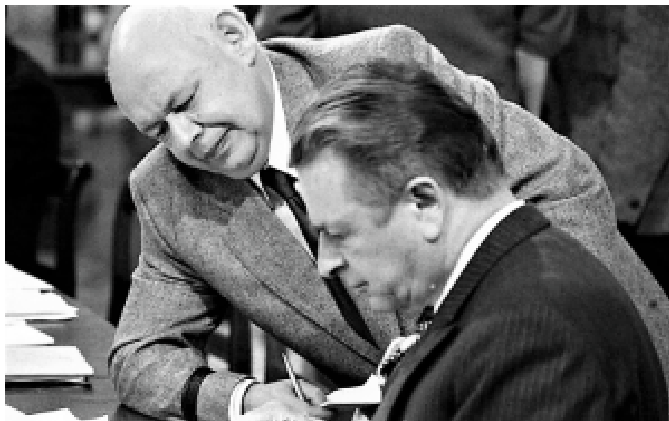
Der Souffleur. Jerzy Urban im Frühjahr 1989, während der Beratungen am Runden Tisch, mit dem Chef der Polizei und der Geheimdienste, General und Innenminister Czesław Kiszczak

hinter den Kulissen der Macht am Werk. Aus Sicht der Kommunisten galt es, das politische Kunststück zu vollbringen: Solidarność zu legalisieren und zugleich möglichst tief in das marode Wirtschafts- und Politikgefüge des dahinsiechenden kommunistischen Polens einzubinden, sie in die Mitverantwortung zu ziehen und am Ende so in den Augen der Bevölkerung in Misskredit zu bringen.