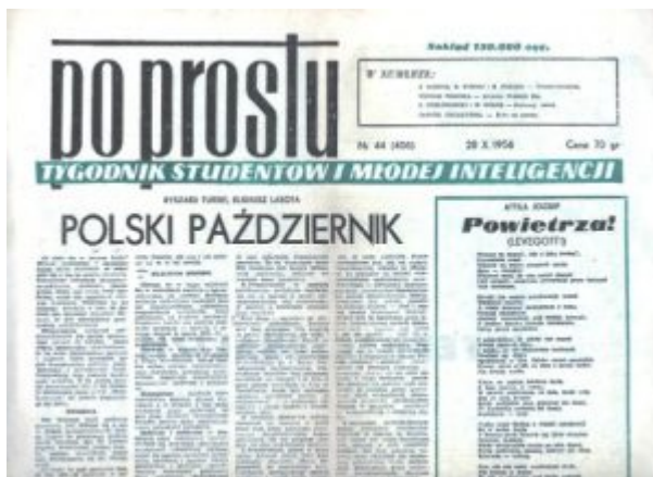
„Po Prostu“. Titelseite.

Sein Journalistikstudium an der Warschauer Universität hängt er schnell an den Nagel, denn das Geschehen ringsumher war viel aufregender. Urban landete 1955 in der Redaktion der heute legendären Wochenzeitung „Po Prostu“ („Ohne Umschweife“). Das ursprünglich öde Propagandablatt für Studenten verwandelte sich in jener Zeit in ein publizistisches Banner des immer schneller um sich greifenden politischen Tauwetters.