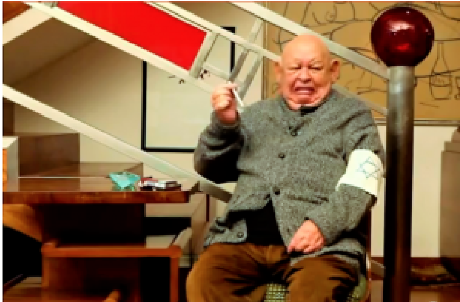
Urban und der Holocaust. Die Zigarette (Zitat) „brennt wie Opa“.

Daher: „Mein Judentum baumelt mir zwischen den Beinen wie ein schrumpeliger Wurm, der keinen Fisch zu locken vermag, geschweige denn eine Frau“, mokierte sich Urban später über seine Herkunft. Es war eine für ihn typische Sottise, mit der er sich als Jude und Antisemit zugleich zu erkennen gab.