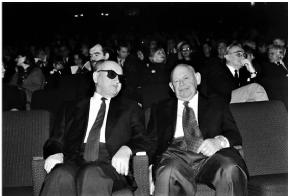
Zufriedene Pensionäre: General Wojciech Jaruzelski und sein einstiger Regierungssprecher Jerzy Urban Mitte der 1990er Jahre.

Die Triebfedern seines Tuns blieben dieselben. Da war zum einen die tiefe Abneigung gegen Solidarność und Lech Wałęsa, der im Dezember 1990 zum Staatspräsidenten gewählt wurde. Zum anderen war es die Kirche und das Christentum im weiteren Sinne, die Urban schon immer gehasst hatte.