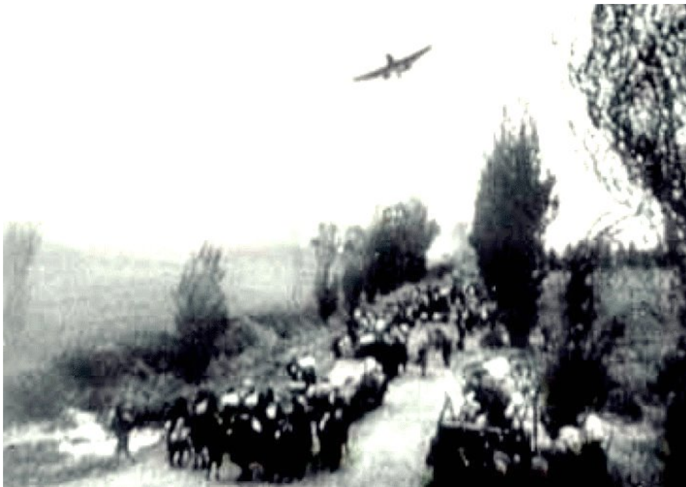
September 1939. Deutsches Flugzeug, polnische Flüchtlingskolonnen.

Mal zu Fuß auf den verstopften Straßen, die immer wieder von deutschen Tieffliegern bombardiert und beschossen wurden, mal ein Stück des Weges mit der Bahn zurücklegend, gelangten sie nach Ostpolen. Das war kurz nach dem 17. September 1939, dem Tag als die Rote Armee Polen vom Osten her überfallen hatte und schließlich die Hälfte des Landes besetzte.