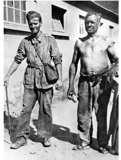
In den Rekrutierungslagern der Anders-Armee kamen vom Hunger, der Sklavenarbeit und nach wochenlangen Transporten ausgezehnte Menschen an.