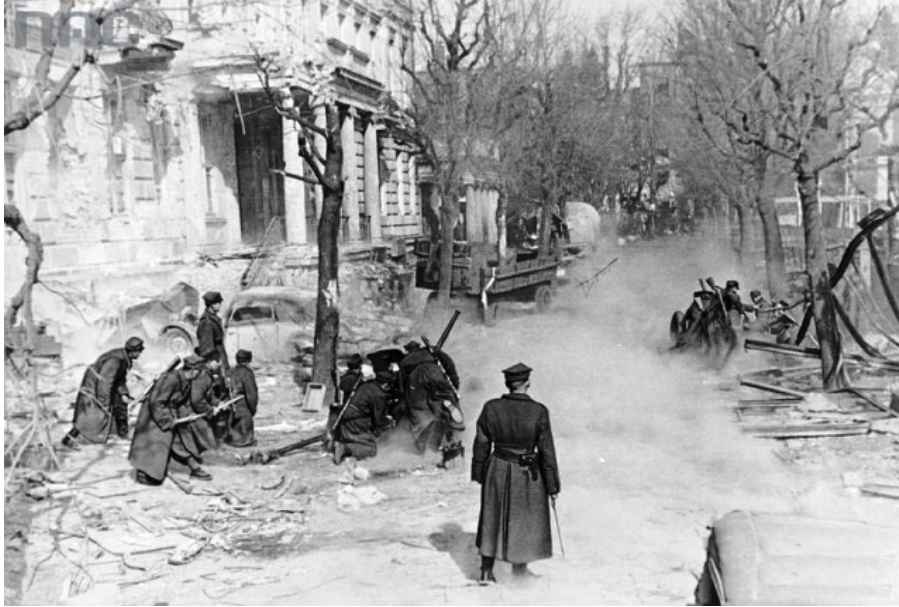
März 1945. Nach dem Abzug der Anders-Armee, unter kommunistischen Vorzeichen in der Sowjetunion gebildete 1. Polnische Armee während der verlustreichen Kämpfe um den Pommernwall und die Stadt Kolberg/Kołobrzeg. Bauman war dabei.

In Polen zurück (die Ablegung der sowjetischen Staatsbürgerschaft war jetzt kein Problem) wurde seine Einheit in das sogenannte Korps der Inneren Sicherheit (KBW) eingegliedert. Es war die „Haustruppe“ des Ministeriums für Staatssicherheit, die in enger Zusammenarbeit mit Einheiten der sowjetischen Staatssicherheit (NKWD) den bewaffneten polnischen antikommunistischen Widerstand bekämpfte.