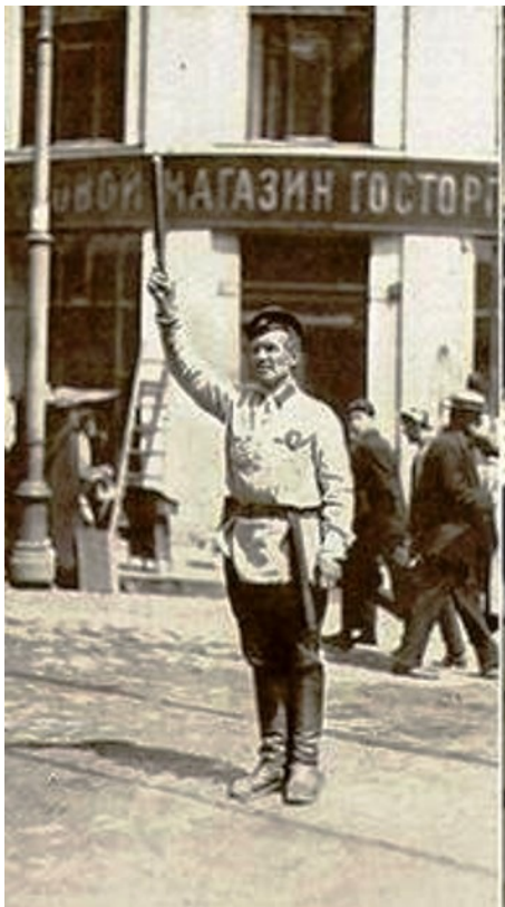
Sowjetischer Milizionär (Polizist) regelt Anfang der 40er Jahre den Verkehr in Moskau. So soll Baumans Dienst 1943 aussehen haben.

Zurückgeblieben in der Sowjetunion waren hunderttausende Menschen aus Polen, darunter die Baumans. Gemäß der „Amnestie“ vom Sommer 1941 hatte man sie Ende 1941 aus dem Lager nach Gorki (heute Nischnij Nowgorod) entlassen. Baumans Vater Maurycy, der im Lager beinahe umgekommen war, wollte mit der Familie zu einem der Sammelpunkte der Anders-Armee gelangen, doch die Sowjets blockten ab. Juden, Weißrussen, Ukrainer, die bis 1939 in Polen gelebt hatten und polnische Staatsbürger waren, durften nicht zur polnischen Armee. Sie wurden endgültig „Bürger der UdSSR“.