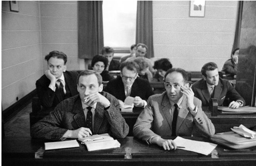
1963 an der Warschauer Universität. Zygmunt Bauman (rechts vorne), neben ihm Leszek Kołakowski.