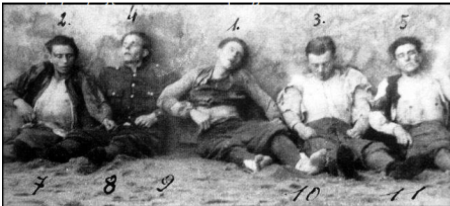
Erschossen und nummeriert 1946. Soldaten des antikommunistischen polnischen Widerstandes.

Ob, wen und weswegen „Semion“ Personen denunziert, der Verhaftung und der Folter preisgegeben hat, wissen wir nicht. Seine Zuträger-Akte hat nicht überdauert. 1946 trat Bauman in die KP ein.