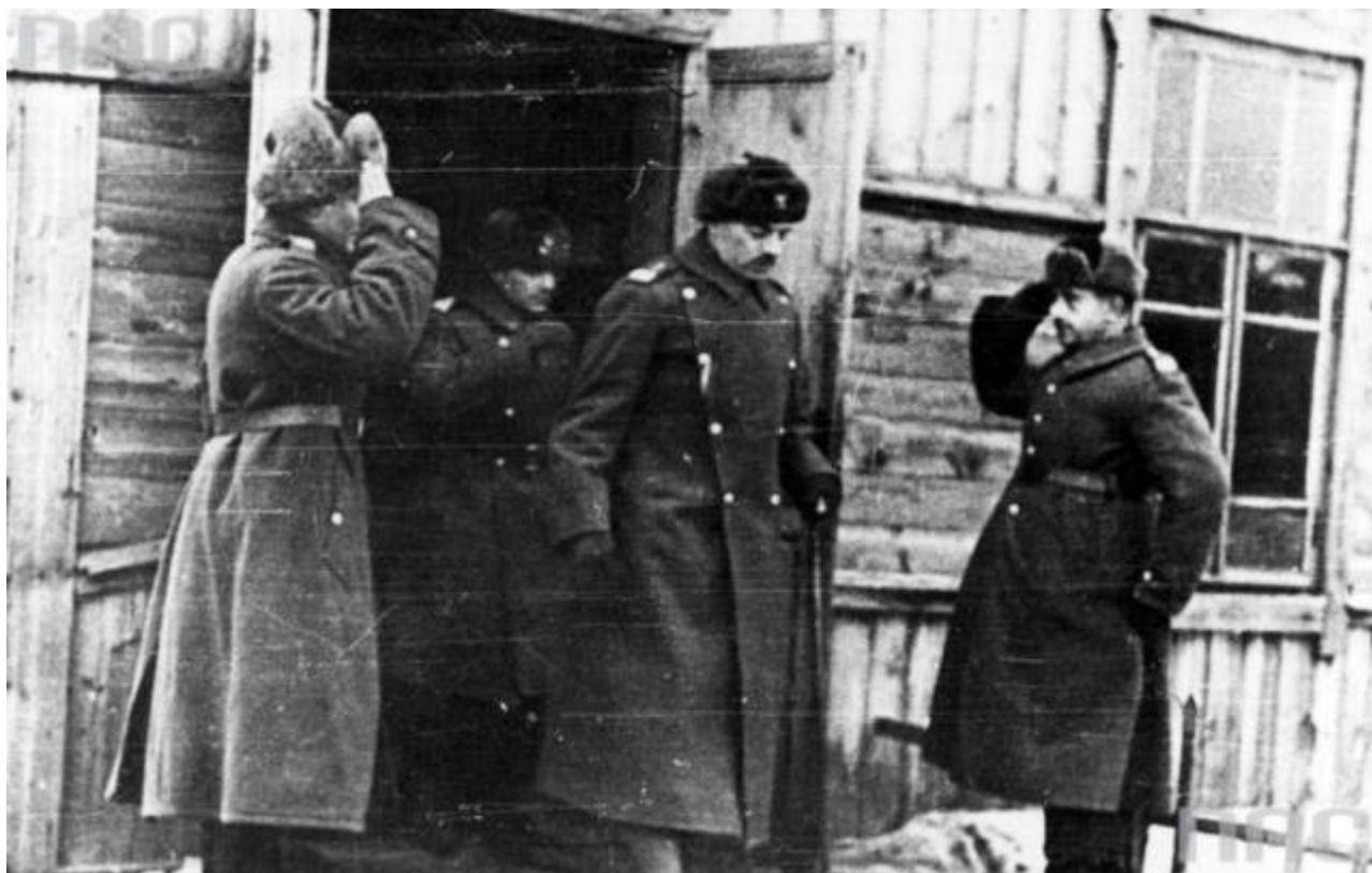
General Władysław Anders versuchte 1941-1942 im Auftrag der polnischen Exil-Regierung in London eine polnische Armee in der Sowjetunion aufzubauen.

Doch in den drei hierfür eingerichteten Auffanglagern kamen vom Hunger, der Sklavenarbeit und nach wochenlangen Transporten ausgezehrtc Menschen an. Es fehlten Lebensmittel (die Sowjets lieferten Anfang 1940 nur 40 000 Essensrationen für 70 000 Soldaten) und Medikamente um sie wieder aufzupäppeln. In den primitiven Baracken und in Zelten, in denen sie den Winter 1941-1942 verbringen mussten, lichtete der Tod schnell ihre Reihen. Zu den Sammelpunkten strömten auch tausende zuvor verschleppter polnischer Zivilisten, meistens Frauen, viele Waisenkinder, die auf diese Weise der Sowjethölle entkommen wollten.