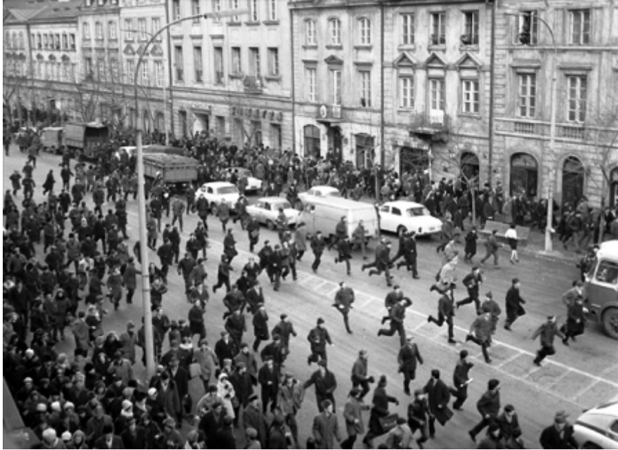
März 1968. Studentenunruhen in Warschau.

Das geschah kurz nach dem triumphalen Sieg Israels im Sechstagekrieg (Juni 1967) über die von der Sowjetunion bewaffneten und wirtschaftlich unterstützen arabischen Staaten. Auf Geheiß Moskaus mussten in der Folge alle Ostblockstaaten die diplomatischen Beziehungen zu Israel kappen. Das von den „USA-Imperialisten“ massiv unterstützte Israel stieg für einige Jahre zum „Erzfeind“ des Ostblocks auf. Da passte es gut, die jüdischen Genossen als Zionisten zu diffamieren, eine „fünfte Kolonne“, die angeblich mit Israel gemeinsame Sache machte.