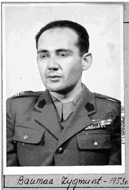
Major Zygmunt Bauman. Foto aus der Stasi-Militärakte.

In Polen zurück (die Ablegung der sowjetischen Staatsbürgerschaft war jetzt kein Problem) wurde seine Einheit in das sogenannte Korps der Inneren Sicherheit (KBW) eingegliedert. Es war die „Haustruppe“ des Ministeriums für Staatssicherheit, die in enger Zusammenarbeit mit Einheiten der sowjetischen Staatssicherheit (NKWD) den bewaffneten polnischen antikommunistischen Widerstand bekämpfte.