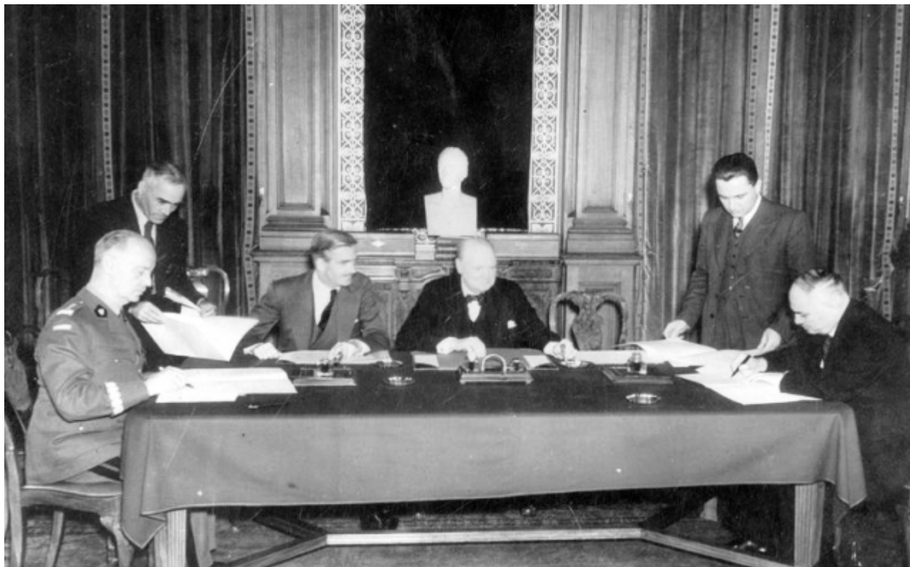
London 30. Juli 1941. Der polnische Ministerpräsident im Exil General Władysław Sikorski (links) und der sowjetische Botschafter in Großbritannien Iwan Maiski (rechts) unterzeichnen das Abkommen u. a. über die Bildung einer polnischen Armee in der UdSSR. In der Mitte die Vermittler: der britische Außenminister Anthony Eden und Premierminister Winston Churchill.

Er drängte darauf die ersten zwei mühsam aufgestellten, kaum kampffähigen Divisionen an verschiedene Frontabschnitte zu schicken, wo sie umgehend aufgerieben worden wären. Die polnische Exil-Regierung dagegen verlangte, dass die gesamte polnische Armee an einem Ostfrontabschnitt eingesetzt wird, erkundigte sich immer wieder nach dem Verbleib der von den Sowjets im Herbst 1939 gefangenen polnischen Offiziere. Die Russen taten so, als hätten sie keine Ahnung. Das Katyn-Massaker sollte erst im April 1943 bekannt werden.