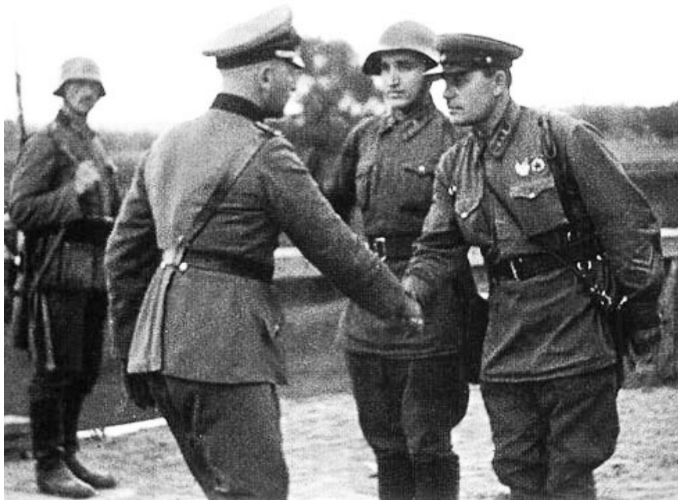
Deutsch-sowjetische Eintracht im eroberten Polen.