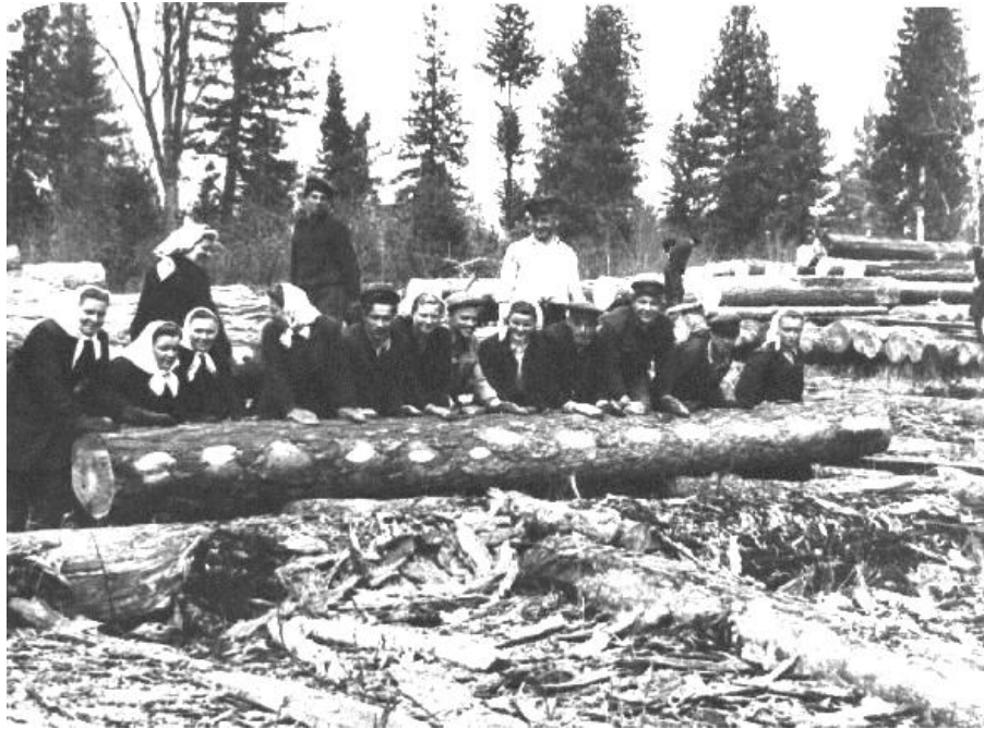
Gleichberechtigt unter den Sklaven des Kommunismus. Frauen aus dem eroberten Polen und Baltikum als Holzfällerinnen.