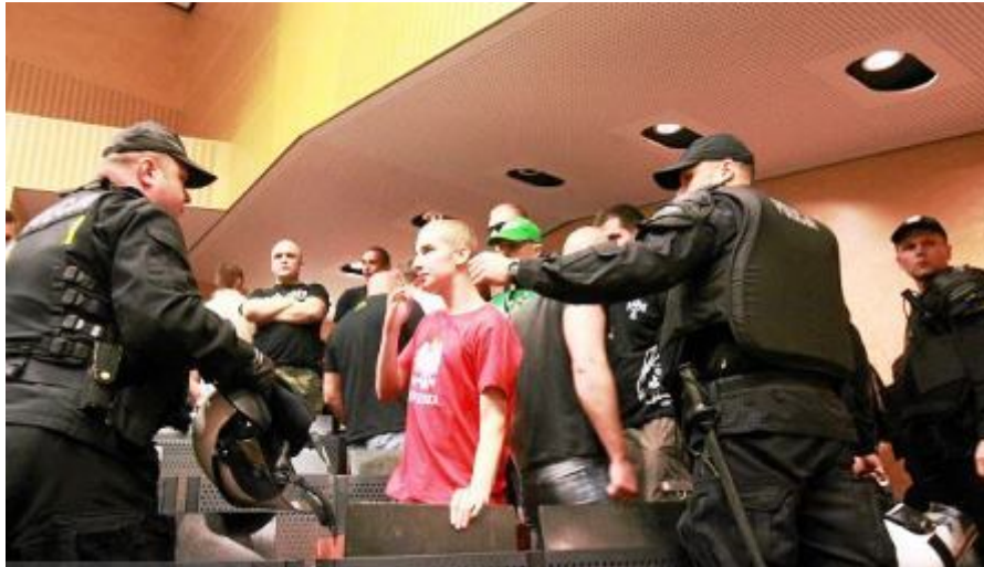
Proteste gegen eine Bauman-Vorlesung an der Universität Wrocław/Breslau. Polizei räumte den Hörsaal. Juni 2013.

Mehrfach wurde er öffentlich als Schuft geschmäht, auch durch den prominenten nationalkonservativen Publizisten jüdischer Abstammung, Bronisław Wildstein: