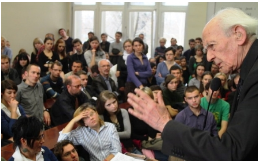
Vor Studenten der Universität Toruń/Thorn im November 2010. Zuhörer und Leser schätzten seine ironischen, pointierten Schilderungen, reich an Methapern, klar in der Aussage.

Das einst so geordnete, solidarische Gemeinwesen, so Bauman, weicht dem unbarmherzigen Wettbewerb vieler „Einzelkämpfer“, die sich zu immer mehr Konsum und Selbstvervollkommnung verführen lassen. Der Mensch heute verirrt sich irgendwo zwischen Cyberspace, den deregulierten Märkten und künstlich geweckten Sehnsüchten. Baumans scharfsinnige Beobachtungen glichen kleinen Bausteinen zum Legebild der Postmoderne oder wie Bauman sagte: einer flüchtigen Moderne.