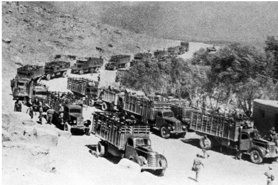
August 1942. Knapp 120 000 „General-Anders-Polen“ , darunter 80 000 Soldaten, und 40 000 Zivilisten wurden aus der Sowjetunion in den britisch besetzten Iran evakuiert.

Am Ende ließ Stalin die ungewollten Verbündeten gehen. Im August 1942 wurden die knapp einhundertzwanzigtausend „General-Anders-Polen“ in den britisch besetzten Iran evakuiert, darunter nicht ganz achtzigtausend Soldaten und achtzehntausend Kinder. Die Truppe, später das 2. Polnische Korps, zog weiter über den Irak nach Palästina und kam ab April 1944 bei den schweren Kämpfen in Italien (Monte Cassino, Ancona, Bologna) zum Einsatz.