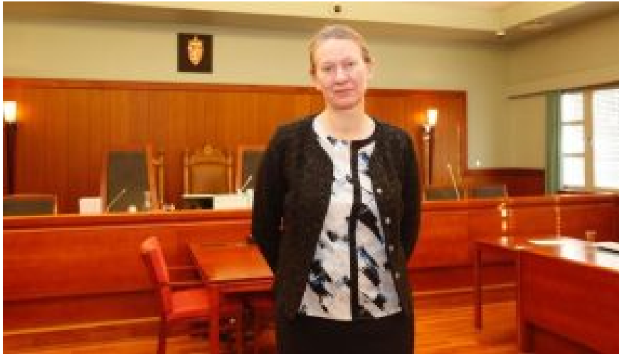
Erschöpft und glücklich. Gewonnen!

Und wie hat die katholische Kirche reagiert?